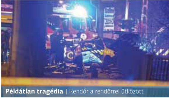
Példátlan tragédia | Rendőr a rendőrrel ütközött

A két autó a riasztás miatt nagy sebességgel hajtott, és így találkozott az említett kereszteződésben. A baleset következtében egy 21 éves újpesti rendőr a helyszínen életét veszítette, míg járőrtársa, illetve a másik autóban ülő két, XV. kerületi rendőr megsérült. (A XV. kerületi autót vezető rendőr könnyebben sérült, a másik két rendőr viszont nyolc napon túl gyógyuló sérüléseket szenvedett).