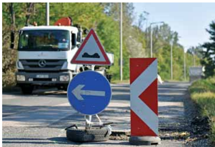
Felsőkert és Bogács utca | Idén már harmadszor kátyúznak

A Felsőkert és a Bogács utcába idén már harmadszor kellett kivonulni a Répszolg által megbízott alvállalkozónak, hogy a méretes, sok kárt okozó kátyúkat felszámolja.