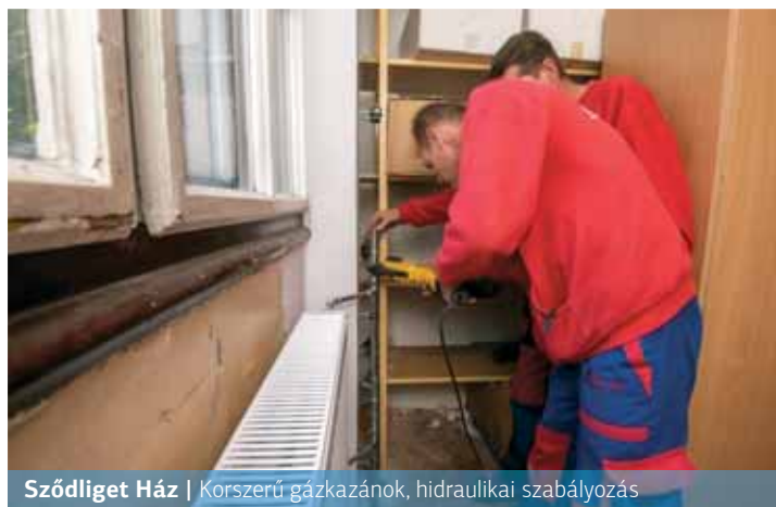
Sződliget Ház | Korszerű gázkazánok, hidraulikai szabályozás

A GMK egyik telephelyeként üzemelő Sződliget Ház épületének fűtési hálózatát önálló földgázüzemű kazánokkal alakították ki, a szerelvények egyidősek voltak a fűtési rendszerrel, így bőven megérették a cserére.