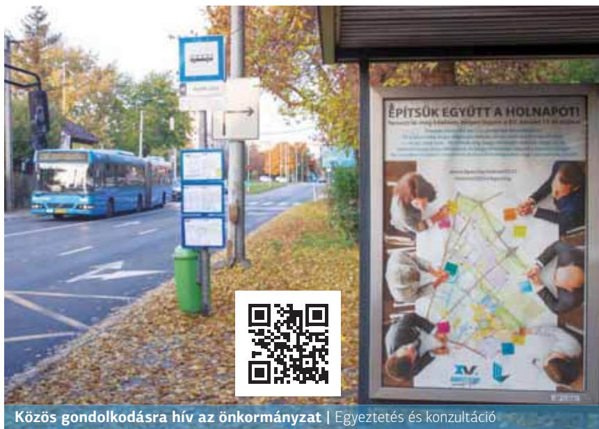
Közös gondolkodásra hív az önkormányzat | Egyeztetés és konzultáció

„A Tizenötödik kerület jövője közös ügyünk. Együtt kell kitalálnunk, milyen kerületben szeretnénk élni és milyen lépések szükségesek ehhez. Ebben a folyamatban fontos elem az Integrált Településfejlesztési Stratégia (ITS) és a Kerületfejlesztési Konceptió (KK) kidolgozása. A fejlesztések fő irányait, céljait közösen kell meghatározni, ezért mind a célok kijelölése, mind azok elérése csak akkor lehet sikeres, ha abban minél többen vesznek részt.”