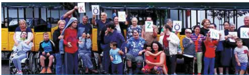
Gondoskodás Gyermekeinkért Alapítvány | A nyári programok sem maradtak el

rozták, melyet a Nemzeti Együttműködési Alap, a MVM XPerT Zrt., az ÉTA Szövetség, a XV. kerületi önkormányzat és az alapítvány biztosított.