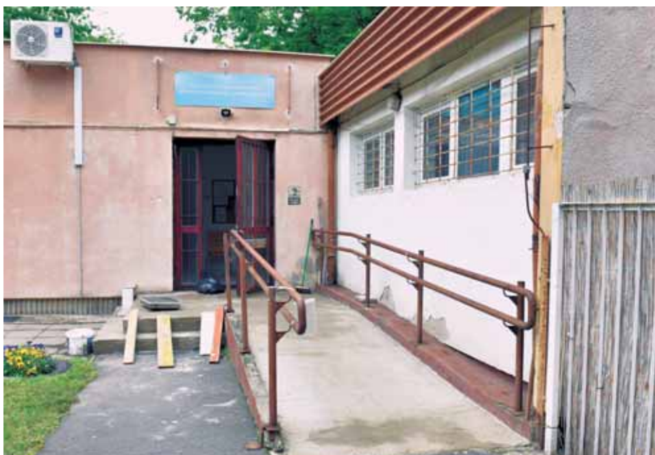
Idősklub és melegedő | Megkezdődött a rég várt felújítás

mellett a menekülést jelző táblák újulnak meg. A radiátorok és szerelvényeik lecserélése is a felújítás része. A vizes helyiségekben a csővezetékek és padlóösszefolyók cseréje az aljzatbeton felbontásával és a vezetékek komplett újraszerezésével