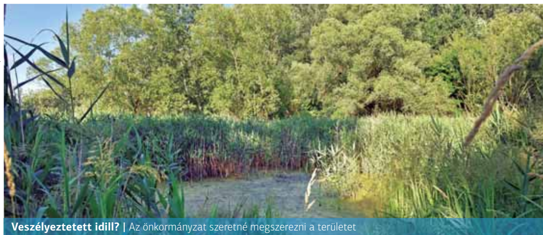
Veszélyeztetett idill? | Az önkormányzat szeretné megszerezni a területet

– Október 1-jére egyeztetést hívtunk össze a földterület tulajdono-