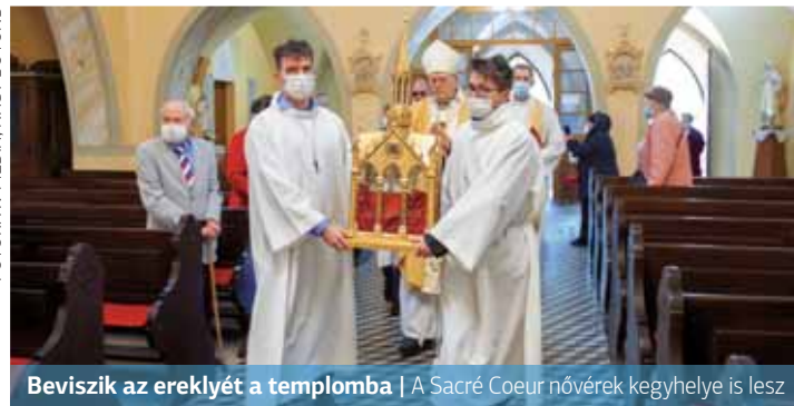
Beviszik az ereklyét a templomba | A Sacré Coeur nővérek kegyhelye is lesz

„Barat Szent Magdolnának, a Jézus Szíve nővérek alapítójának ereklyéjét ma ünnepélyesen elhelyezzük ebben a templomban. A Sacré Coeur nővérek küldetésében, karizmájában a tanítás kiemelkedő szerepet töltött be. Alapítójuk pártfogását bizalommal kérhetjük mai katolikus iskoláink és óvodáink minden oktatója és növen-