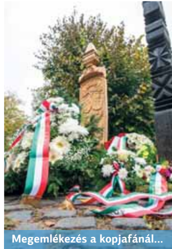
Megemlékezés a kopjafánál...

– A mai kettős ünnepen, az 1956-os forradalom és szabadságharc kezdetének és a harmadik köztársaság kikiáltásának évfordulóján azok emléke előtt tisztelgünk, akik a szabad, független Magyarorszáért küzdöttek – mondta a kerület vezetője az 1989. október 23-án, a harmadik köztársaság kikiáltásának emlékére állított kopjafánál. – Ez a kettős évforduló azonban arra is figyelmeztet bennünket: a demokráciáért nap mint nap tenni kell. Óvnunk és védenünk kell a demokratikus alapértékeinket, folyamatosan őrödnünk kell a demokratikus alapjogok betartása és betartatása felett. Az 1956-os forradalom napjai máig érvényesen igazolták: bármennyire is fásztó és időigényes műfaj