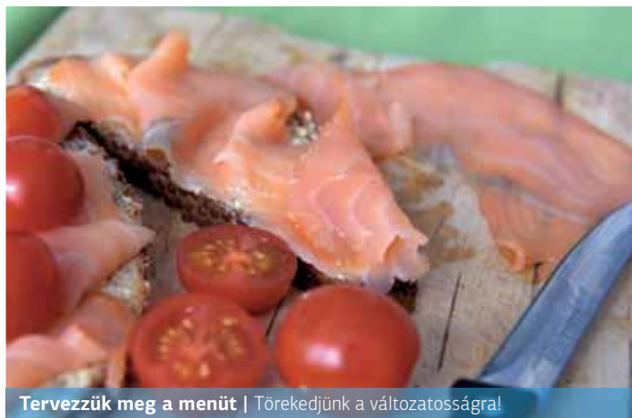
Tervezzük meg a menüt | Törekedjünk a változatosságra!

zal, hogy közösen ülünk le az asztalhoz, hogy bevonjuk a gyermekeket is a fogások elkészítésébe.