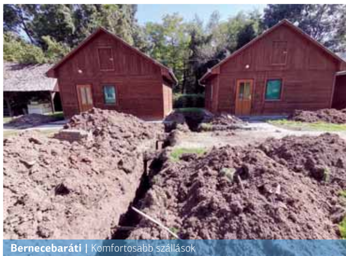
Bernecebaráti | Komfortosabb szállások

„A tábor épületének fűtési hálózatát önálló, földgázüzemű fűtési hőtermelő közbeiktatásával alakít-