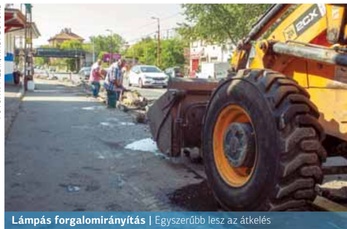
Lámpás forgalomirányítás | Egyszerűbb lesz az átkelés

a megállás, azaz a korábbi parkolási lehetőség megszűnt.