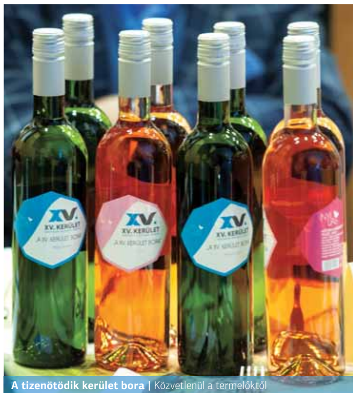
A tizenötödik kerület bora | Közvetlenül a termelőktől

Az ötlet nem újszerű, más településeken is előfordul, hogy címkézett borokat adnak ajándékba. Debrecenben például komoly szakmai versenyt rendeznek az ország borászainak, melynek győztese a presztízsen kívül a város bora címet is viselheti. A XV. kerület környékén nem található szőlőhegyek, ezért a kabinet munkatársainak mesz-