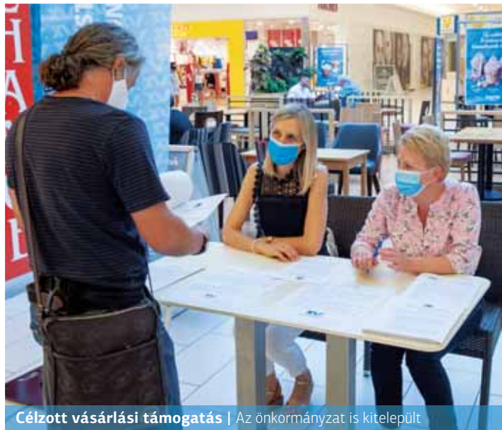
Célzott vásárlási támogatás | Az önkormányzat is kitelepült

Augusztus 28. és szeptember 13. között „Youtuber Suli Show-t” hirdetett a Pólus Center. Ennek keretében fiatal és népszerű influenszerek oktatták a fiataloságot a YouTube használatára. A cél, hogy a „tanulóifjúság” elsajátítsa a videóképzés fortélyait, s hogy ez alapján megalkossa saját filmjeit.