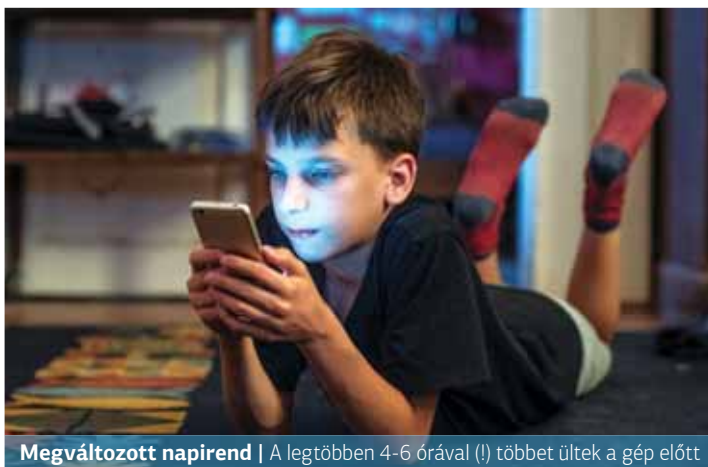
Megváltozott napirend | A legtöbben 4-6 órával (!) többet ültek a gép előtt

A mozgás hiányával összefüggésben megnőtt a képernyő előtt töltött idő. Az online tanulás miatt általában 15-20 százalékkal több időt töltöttek a