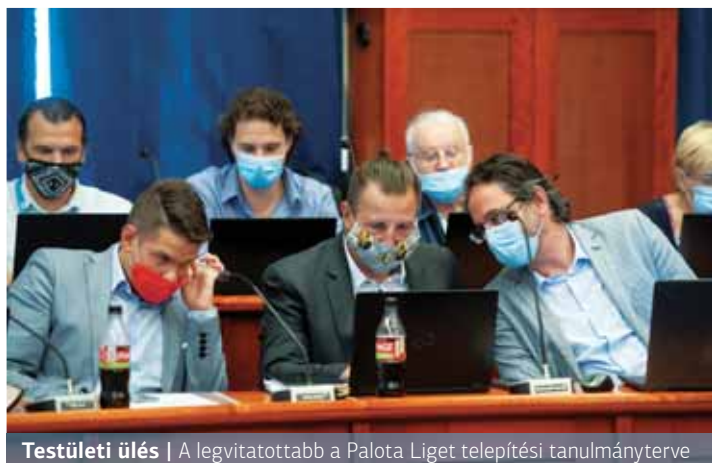
Testületi ülés | A legvitatottabb a Palota Liget telepítési tanulmányterve

A helyi adókról szóló rendelet módosítása már nyílt ülésen történt. Ennek során a testület többsége úgy döntött, tekintettel a kormányzati elvonásokra és a COVID-járvány gazdasági hatásaira, a polgármester vizsgálja felül a jövő évi várható adóbevételeket. Mint elhangzott, erre azért van szükség, mert eddig lehetőség volt a reklámhordozók megadóztatására, erre azonban 2020. július 15-től már nincs módja az önkormányzatoknak. Ez évi