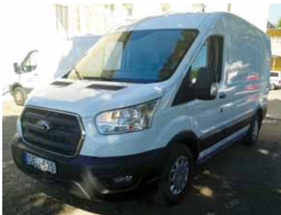
Időben érkező meleg étel | Folyamatos fejlesztési terv

A GMK egyik legfelelősebb feladata a kerületi óvodák, bölcsődék közétkeztetésének biztosítása. Az étel időben és hőfokban megfelelő helyszínre érkeztetése érdekében három területre osztva járkák a gépkocsivezetők az intézményeket.