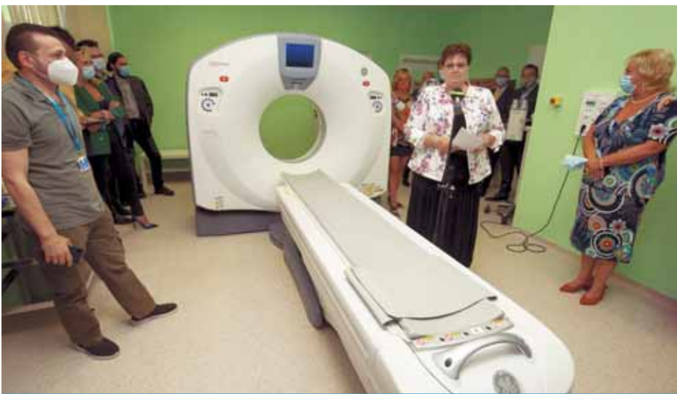
Képkalkotó diagnosztika | Jelentős mértékben megkönnyítheti majd a betegek diagnosztizálását

– A visszautasítások ellenére egyre inkább elkötelezettjei lettünk a CT beszerzésének – nyomatékosította a polgármester.