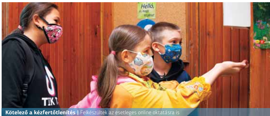
Kötelező a kézfertőtlenítés | Felkészültek az esetleges online oktatásra is

A bevezetőt most egy színes riportnak kellene követnie arról, hogy a hosszú szünet után, mennyire várta az idei becsöngetést. Ám, ahogy haladtunk az őszbe, úgy változott rossz irányba a hazai vírushelyzet. Így a tanévkezdet előtti utolsó hetek ugyanazzal az izgalommal teltek, mint márciusban a digitális oktatásra történő átálláskor.