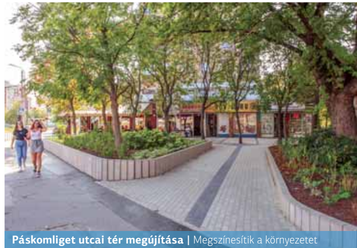
Páskomliget utcai tér megújítása | Megszínesítik a környezetet

Az újjalotai vásárcsarnokkal szemben, a Páskomliget utca 2–4. szám előtt befejeződött a terület megújítása. A beruházást a Nyitott Ajtók iroda előtti részhez hasonlóan, annak folytatásaként valósították meg a Répszolg munkatársai a közterület-felújítás második ütemeként.