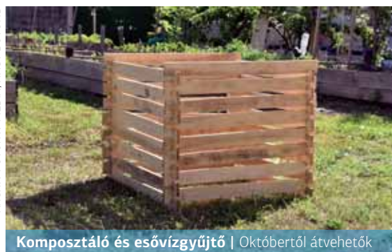
Komposztáló és esővízgyűjtő | Októbertől átvehető

tési Bizottsága bírálja el. A nyertes pályázó – az önrész befizetését és az oktatáson történt részvételt követően a komposztáló-keretet és az esővízgyűjtőt a Répszolg Kft. telephelyén veheti át – jelezte az önkormányzat.