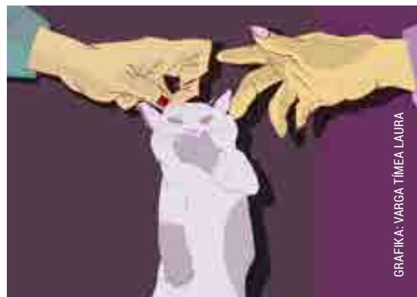
GRAFIKA: VARGA TÍMEA LAURA

Egy kerületi állattulajdonos feljelentést tett, mert elmondása szerint valaki ivartalanította a fedezésre szánt nagy értékű fajtatiszta macskáját. Az ivartalanítás szakszerű volt, így a rendőrség nem állatkínzás, hanem rongálás vétségében indított eljárást. Sikerült is egy nőt beazonosítaniuk, aki elismerte az ivartalanítást. Elmondása szerint az elhanyagolt állapotban levő macska jelölgetni kezdett a háza környékén, és terrorizálta a cicáit, s mivel gazdátlanok tűnt, elvitte orvoshoz és kérte az ivartalanítását. A házikedvenc ezt követően visszament a gazdájához.