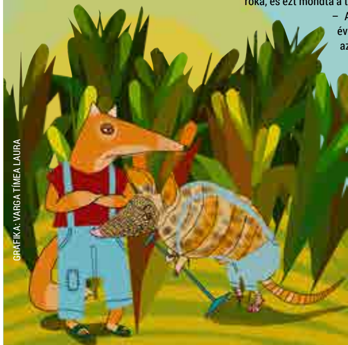
GRAFIKA: VARGA TÍMEA LAURA