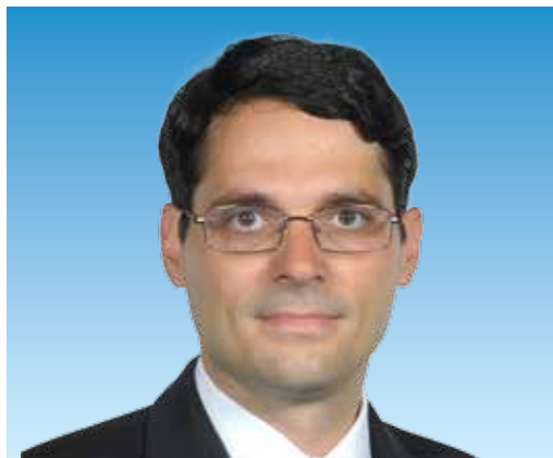
DR. PINTÉR GÁBOR – FIDESZ

Változást ígértünk és valósítottunk meg kerületünk életében 2010–2014 között. Az önkormányzat gazdálkodásának rendbetétele, az adóssághozzájárulás, valamint az uniós források hatékony kihasználása hat és fél milliárd forint összegű fejlesztést eredményezett a kerületben az elmúlt ciklusban. Viszonyításképpen: a 2006–2010 közötti időszakban ez 600 milliót tett csak ki.