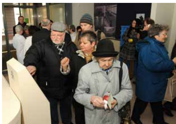
Modern sorszámosztó berendezés a Zsókavár rendelőben

J elenleg a Rákos úti Szakrendelőben a rendelésre történő bejelentkezéskor a betegnek a TAJ-kártyáját kell bemutatnia a földszinti recepción, ahol a számítógépes rendszer-