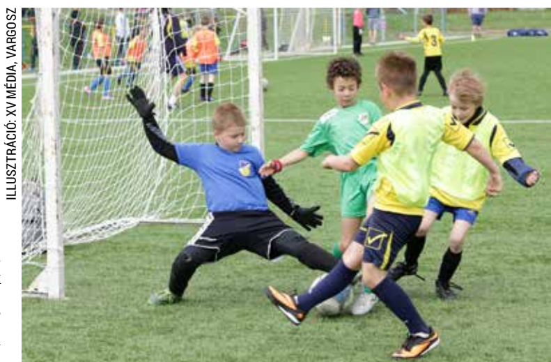
ILLUSZTRÁCIÓ: XV MÉDIA, VARGOSZ

ban a 14 év alatti gyerekek játszanak, a többi helyszínre pedig a minimum 5+1 (maximum 10) fős felnőtt csapatok jelentkezését várják. A csapatok szombaton selejtezőket játszanak, vasárnap pedig a döntőket rendezik meg. Az 1–6. helyezettek mindkét korcsoportban ér-