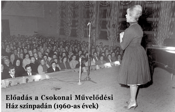
Előadás a Csokonai Művelődési Ház színpadán (1960-as évek)

Palota csak egy van, de a Csokonai hatvan! Ez a szlogenje annak a programsorozatnak, melyet a Csokonai Művelődési Központ (Csoki) alapításának 60. évfordulója kapcsán szerveznek a kulturális szakemberek.