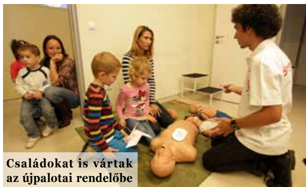
Családokat is vártak az újpalotai rendelőbe

A Rákos úton megszokott, hogy az őszi egészségnapon mindig nagyobb az érdeklődés, mint a tavaszi programon. Idén azonban minden eddiginél többen, hétszáznyolcvan