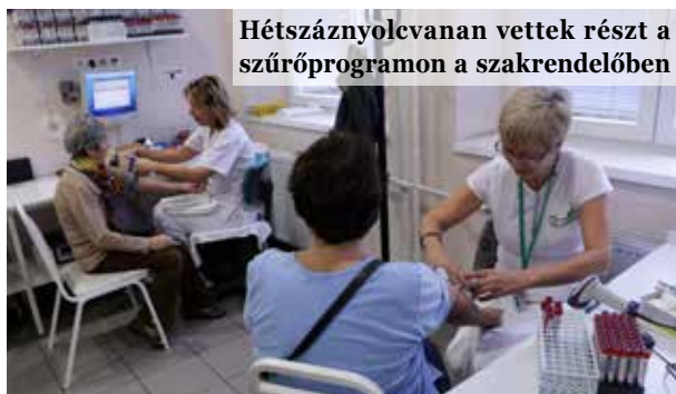
Hétszáznyolcvan vettek részt a szűrőprogramon a szakrendelőben

Tavasszal és ősszel a Rákos úti Szakrendelőn kívül az újpalotai Zsóka-vár utcai egészségügyi intézményben is rendeznek ingyenes szombati szűrővizsgálatokat. Újpalotán a 14 év alatti gyerekek a megcélzott korosztály, emiatt mindig családias, sok játékkal, érdekes programokkal és egészséges finomságok kóstolásával fűszerezett eseménnyel várják a családokat. Persze a rendezvényen játszva is lehet tanulni, például arról, hogyan vigyázunk a fogainkra vagy miként lehet valakit újraéleszteni.