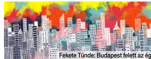
Fekete Tünde: Budapest felett az ég.

Egy hónapon keresztül kereste a FŐTÁV azt a legkreatívabb városszinesítő ötletet, amely alapján megújulhat a IV. kerületi Elem utcában található, föld fölött futó távhővezeték. A verseny befejeződött, a városlakók szavazatai alapján szakmai zsűri döntött: egy Újpest-térkép részletet fog felfesteni a távhővezetékre a Színes Város, az ország első legális köztérzsinesítéssel és tűzfalfestéssel foglalkozó csoportja.