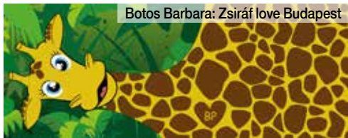
Botos Barbara: Zsiráf love Budapest