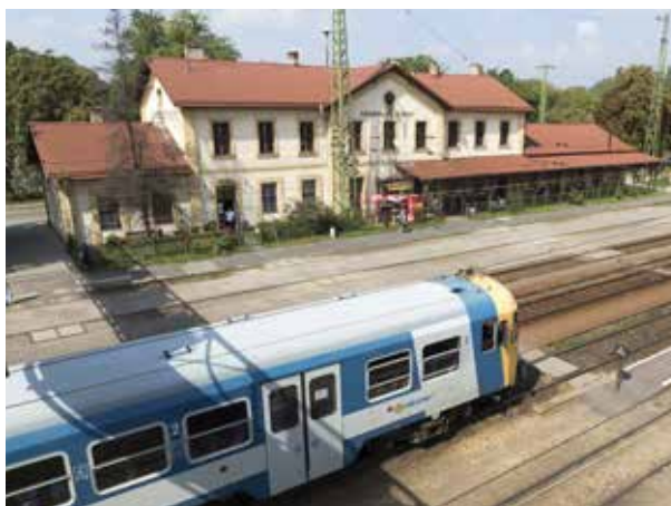
Az elővárosi vasút is fontos szerepet kap a tervben

A központ MTI-hez eljuttatott közleménye szerint több fórumon is lehetőség van a vélemények kifejtésére, a bkk.hu honlapon is készítettek egy felületet erre a célra. Az egyeztetésről több mint kétszáz intézményt levélben is tájékoztattak. Az írásos észrevételeket, javaslatokat november 15-ig a www.bkk.hu/bmt oldalon vagy e-mailben a balazsmorterv@bkk.hu címen várják.