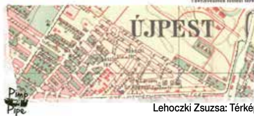
Lehoczki Zsuzsa: Térkép