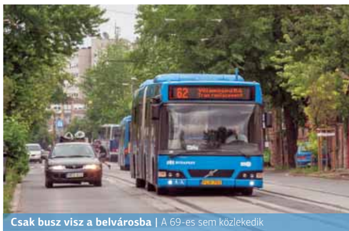
Csak busz visz a belvárosba | A 69-es sem közlekedik

A BKV Zrt. zuglói villamoskocsiszínje előtti vágányhálózat felújításra, átalakításra szorul, mert jelenleg a villamosok ki-, illetve beállásakor jelentősen akadályozzák a Bosnyák tér közúti kapacitását. A fejlesztés megvalósításával a környék útforgalma jelentősen javulni fog, hiszen