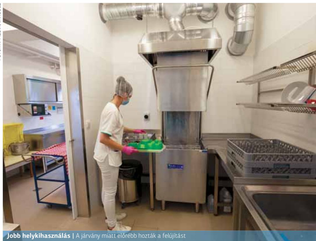
Jobb helykihasználás | A járvány miatt előrébb hozták a felújítást

A tálalókonyha egy 13 négyzetméteres és egy 27 négyzetméteres helyiségből állt, a kisebbben történt az ételek tálalása és a fehérmosogatás. A nagyobbban, ahol régebben főzőkonyha üzemelt, viszont több olyan funkció keveredett (feketemosogató, dolgozói étkező, bútorokkal lekerített raktár), ami nem felelt meg az előírásoknak. A helyiségekben a fali csempeburkolatok helyenként repedtek, hiányosak, foltosak, az