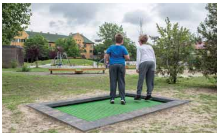
Felemelő érzés | Megférnek egymás mellett a gyermekek és a kutyások