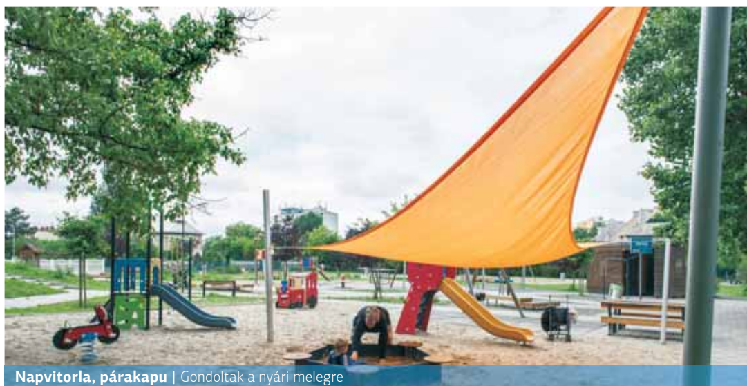
Napvitorla, párapap | Gondoltak a nyári melegekre

használhatott. A modern játszótéren van mosdó, gondnoki iroda, ivókút, napelemes világítás és a homokozó,