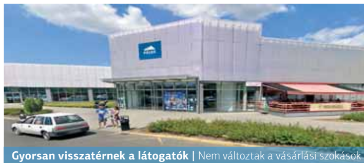
Gyorsan visszatérnek a látogatók | Nem változtak a vásárlási szokások

Ahogy megjelent a vírus Európában, a bevásárlóközpontban már