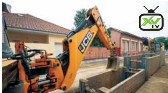
Többrétegű felújítás | Munkálatok a Batthyány utcában