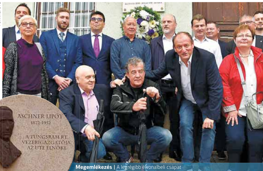
Megemlékezés | A legrégebbi élvonalbeli csapat

Az ünnepség harmadik állomásként az olimpiai bajnok, Bene Ferenc mellszobrát két UTE-legenda, a szintén olimpiai bajnok tornász, Berki Krisztián és a korábbi jégkorongozó, Ancsin János koszorúzták meg. A megemlékezés ezzel még nem ért véget, az ünnepségen részt vevők ugyanis a Szent István tér 19-es számú épületének falán levő emléktáblát is megkoszo-