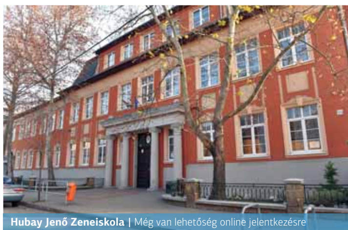
Hubay Jenő Zeneiskola | Még van lehetőség online jelentkezésre

A járványos időszak megváltozott körülményei új helyzetet teremtettek a zeneiskolai jelentkezésnél is. Ahogy Bokor György igazgató fogalmazott, más volt a lehetőség és más volt a bátorság a jelentkezők részéről. Ugyanis a korábbi évekhez képest idén lényegesen kevesebben jelentkeztek a zeneiskolába. Az elmúlt 3-4 évben évente mintegy 250 hallgató jelentkezett a különböző szakokra, most körülbelül százan