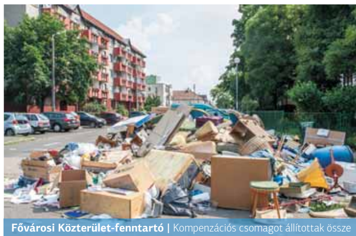
Fővárosi Közterület-fenntartó | Kompenzációs csomagot állítottak össze

„A három hónapos rendkívüli járványhelyzet miatt összesen 61 nap, így 61 körzet lomtalanítása maradt el, amit a szoros éves lomtalanítási programba már nem lehet változtatás nélkül beilleszteni. Az év során fennmaradó használható napok száma függ az időjárás korlátoktól, az év végi ünnepek időszakos korlátozó tényezői-