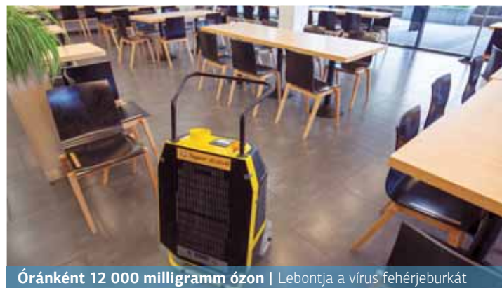
Óránként 12 000 milligramm ózon | Lebontja a vírus fehérjeburkát

A Super ActivO egy mozgatható generátor, amely kettős dielektromos védőgátló technológiával rendelkezik, óránként 12 000 milligramm ózont bocsát ki a levegőbe. Fertőzés esetén az ózon a vírus fehérjeburkát kezdi megbontani, és hatol be a ribonuk-