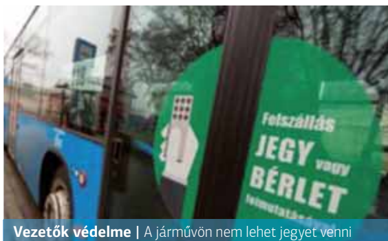
Vezetők védelme | A járművön nem lehet jegyet venni

A vezető védelme érdekében kérik az utasokat, lehetőség szerint ne a vezetőfülke közelében foglaljanak helyet. Továbbra is kötelező a maszk vagy más, orrot és szájat eltakaró eszköz használata.