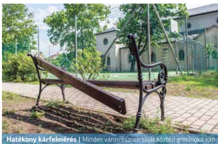
Hatékony kárfelmérés | Minden városrésznek saját köztéri gondnoka van

Kerületünk mindhárom városrészének van egy felelőse a Répszolgnál. A szektorfelelősök feladata, hogy a körzetüket bejárva feltérképezzék a problémákat, legyen szó akár kátyúkról, megrongált padokról, illegálisan lerakott szemétről, elburjánzott gazról, leszakadt faágról vagy szemetes homokozóról. A bejárás során észlelt anomáliákat aztán egy adatbázisban rögzítik, ahol egyébként a lakossági panaszok és a városházáról jelzett problémák is megtalálhatók. Így biztosítható,