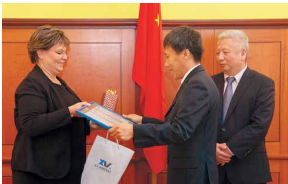
Támogatás a kerületből és külföldről | Cserdiné Németh Angéla oklevéllel köszönte meg a segítséget

A járványügyi védekezésben a kínai–magyar összefogás előtt tiszteltet a városrész. Duan Jielong, a Kínai Népköztársaság magyarországi nagykövete június 18-án ez alkalomból látogatott a XV. kerületbe.