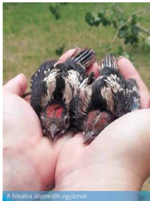
A fiókákra állatvédők vigyáznak

megerősödnek – ami néhány hetet vesz csak igénybe –, szabadon engedik majd őket – jegyezte meg a közterület-felügyelő. R. T.