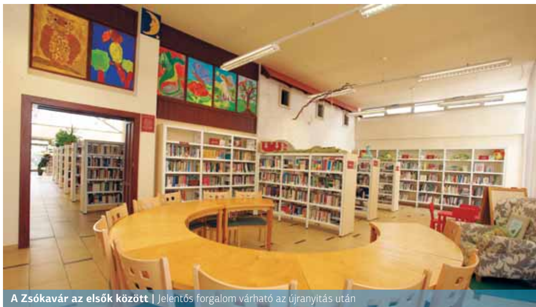
A Zsókvár az elsők között | Jelentős forgalom várható az újraindítás után

A XV. kerületben is jelentős a rendszeres könyvtárlátogatók száma. Számukra jó hír, hogy a tagkönyvtárak három ütemben nyitnak újra.