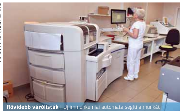
Rövidebb várólisták | Új immunkémiai automata segíti a munkát

A hamarosan „munkába álló” modern eszköznek köszönhetően az intézményen belül végezhető viz-