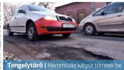
Tengelytörő | Háromszáz kátyút tömnek be

A javítások mielőbbi elvégzése érdekében a