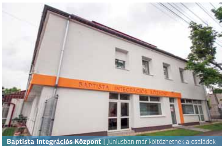
Baptista Integrációs Központ | Júniusban már költözhetnek a családok

több intézményt tart fenn. Négy hajléktalanszállóval, egy átmeneti – úgynevezett kiléptető – szállóval, utcai szolgálattal és zuglói lakásokkal több száz embernek segítettek már.