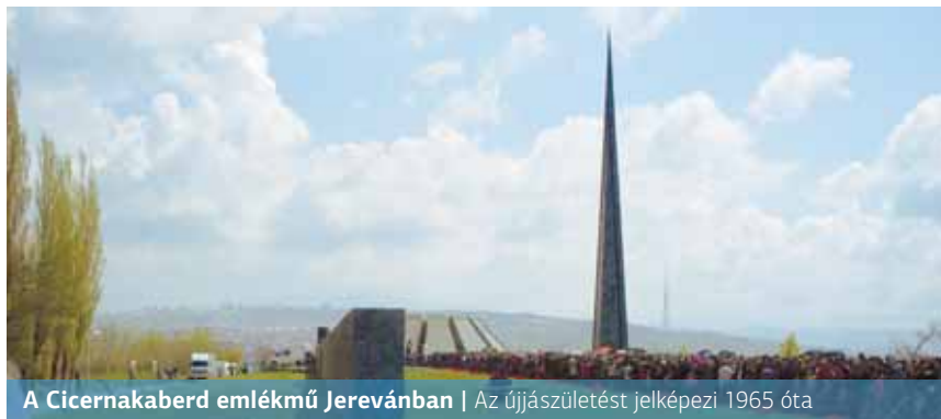
A Cicernakaberd emlékmű Jerevánban | Az újjászületést jelképezi 1965 óta

Talaat pasa az ifjú törökökkel kormányprogrammá nyilvánította a keresztény örmény nép megsemmisítését. Az első világháború elterelte a nagyhatalmak „figyelmét” a török kormány gaztettéről.