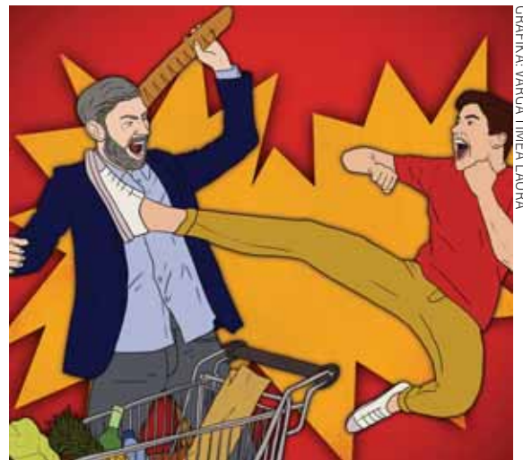
GRAFIKA: VARGA Tímea LAURA

Egy 29 és egy 57 esztendőes férfi veszett össze az egyik kerületi élelmiszerüzletben. Mindketten már a kasszánál álltak, amikor vitába keveredtek egymással, majd dulakodni kezdtek, melynek során több alkalommal is megütötték egymást. A verekedésnek végül a többi vásárló és a bolti alkalmazottak vetettek véget. A helyszínre kitérő rendőrök mindkét férfit előállították, és mindkettőjük ellen garázdaság miatt indítottak eljárást.