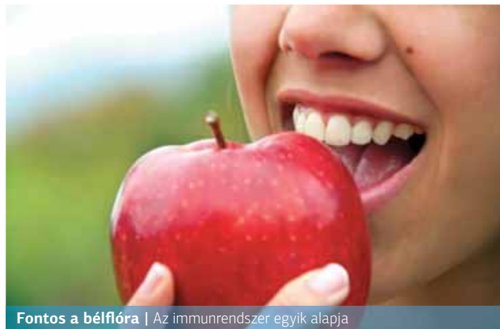
Fontos a bélflóra | Az immunrendszer egyik alapja

– A bélflóra, vagy más néven mikrobiom, az emésztőrendszerünkben (főleg a vastagbélben) élő mikroorganizmusok sokszínű, dinamikusan változó közössége. A velük élő és együttműködő baktériumok összességét elképesztő módon 1-2,5 kilogramm közé becsülik, összetétele pedig minden emberben eltérő, tehát minden-