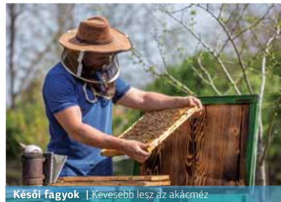
Késői fagyok | Kevesebb lesz az akácmez

– Kéthetes késéssel, de elkezdődött a méhek felkészítése a fő hordásnak számító akácvirágzásra. A késői fagyok miatt idén előre láthatóan kevesebb lesz a hungarikumnak számító akácmezéből – írja az MTI.