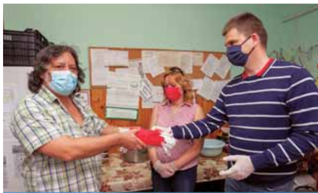
Gondoskodó képviselők | Maszkokat adományoztak

Tizenkét fiatal lakik a Down Alapítvány Oroszlán utcai házában, elsőként őket látogatták meg a képviselők. Az átadott maszkokhoz használati utasítás is járt – mind a tisztításhoz, mind a vasaláshoz kapott útmutatót az intézmény vezetője.