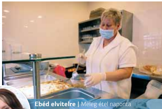
Ebéd elvitelre | Meleg étel naponta