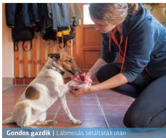
Gondos gazdik | Lábmosás sétáltatás után

A vonatkozó jogszabályok értelmében az állattartó köteles a jó gazda gondosságával eljárni, az állat fájának, fajtá-