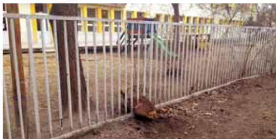
Mezőőrök szolgálata | Kiszabadították a beszorult állatot

Március végén őzet találtak az egyik újjalotai óvodában. Nem a kertben bóklászva, hanem a kerítésbe szorulva.