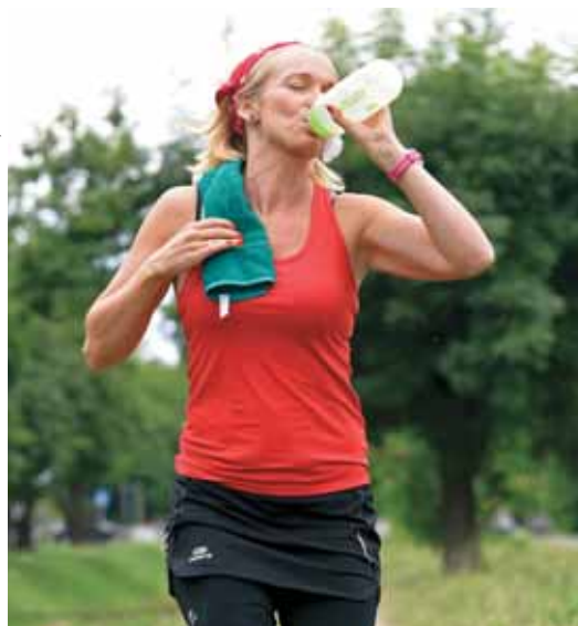
ILLUSZTRÁCIÓ: XVI. MÉDIA, NAGY BOTOND

Nézzük csak! Egy: mindennap együtt ebédelünk. Kettő: nincs reggeli rohanás, így ordibálás sem, hogy azonnal kelj ki az ágyból, öltözz fel, induljunk már és társai. Három: nekem sem kell időben beérnem. Négy: amióta napjaimat a lakásban töltöm, ha pedig ki kell mozdulnom, sem találkozom 3-4 autónál többel, az arcbőröm szebb lett, eltűntek a gyulladások, aminek nagy részéért a rossz levegő a felelős. Öt: amióta el tudtam fogadni, hogy nemcsak érdemes lassítani, de muszáj is, mert különben megbolondul az ember, jó pár fordulattal