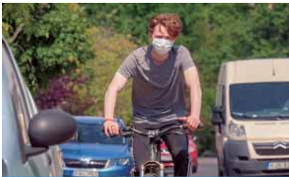
Nagyobb sebességkülönbség | Nagyobb távolság

A jó idő beköszöntével amúgy is megnő a két kéreken közlekedők száma az utakon, a világjárvány miatt pedig jóval többen választják ezt a közlekedési módot. Vannak közülük, akik rutintalanabbak a rendszeresen kereközőknél, de nem csak emiatt kell nagyon odafigyelni a biciklizőkre.