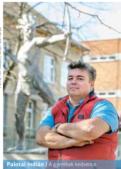
Palotai indián | A gyerekek kedvence

A Mézeskalács tér és a szomszédos Széchenyi-télpel azzal is büszkélkedhet, hogy az ötvenes években több kultikus szobor is helyet kapott itt. A házak között találni pancsoló gyereket, ugró szarvast, nőt