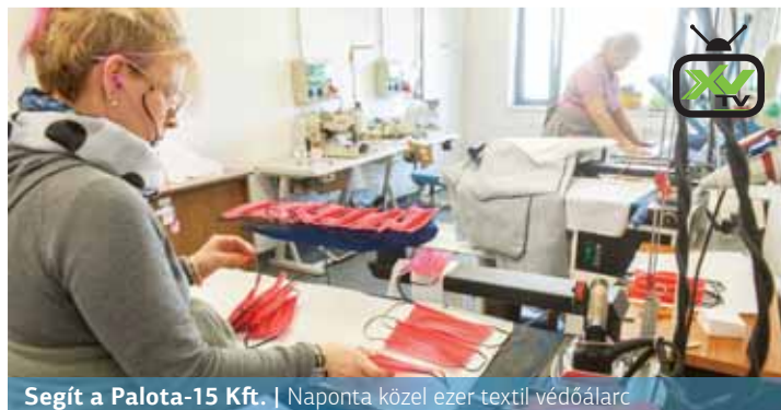
Segít a Palota-15 Kft. | Naponta közel ezer textil védőárlac

A koronavírus-járvány az önkormányzat gazdasági társaságainak működésére is hatással van. A legjobb példa erre, hogy a Palota-15 Rehabilitációs és Közfoglalkoztatási Közhasznú Nonprofit Kft. varrodája teljes kapacitással állt az egészségügyi védőmaszkok gyártására.