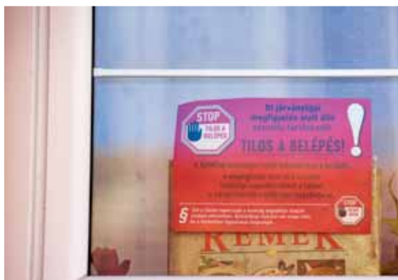
Hatósági házi karantén felirata | Két hét otthon

Végezzen rendszeres teszt-mozgást otthon, ami csökken-