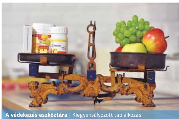
A védekezés eszköztára | Kiegyensúlyozott táplálkozás

– A C-vitamin mellett az A-, az E-, illetve a D-vitamin megfelelő beviteléről kell gondoskodnunk ebben az idő-