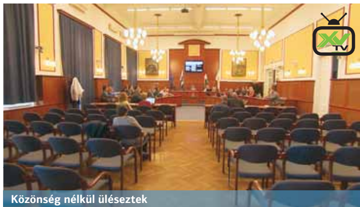
Közönség nélkül üléseztek

Az önkormányzat a jogszabály szerinti mentesül az ügyleti kamatfizetés