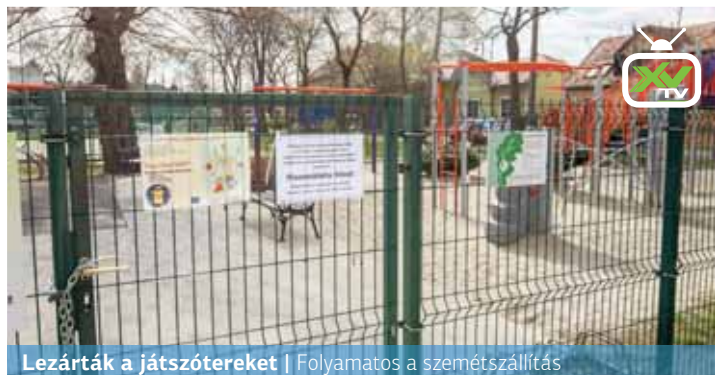
Lezárták a játszótereket | Folyamatos a szemétszállítás

Veszélyhelyzeti üzemmódra állt át a Répszolg. A köztisztaság fenntartása érdekében továbbra is folyamatos a hulladék elszállítása a kerületi közterekről, ezért ha szükséges, akár több embert is munkába állít a társaság.