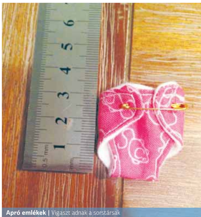
Apró emlékek | Vigaszt adnak a sorstársak

A kórházi gyakorlat intézményenként változó, az viszont egységes, hogy minden esetben lehetőséget kellene biztosítani pszichológussal való konzultációra, ezzel is elősegítve, hogy a család pont a legnehezebb időszakban, a veszteség pillanatában támaszkod-