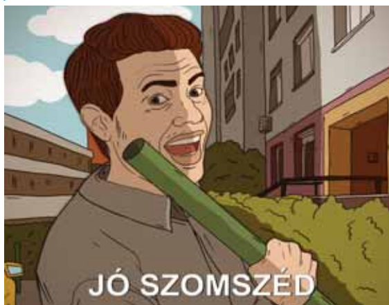
GRAFIKA: VARGA TIMEA LAURA

Szomszédvitához riasztották a kerületi rendőröket. A két szomszéd úgy összeveszett egymással, hogy az egyikük – a sértett állítása szerint – megrugdosta a másik kapuját, illetve egy műanyag csővel az ablakát is betörte. A férfi ellen garázdaság miatt indult eljárás. ◆