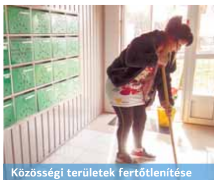
Közösségi területek fertőtlenítése

közösségi tereket, a személedobók bejáratát, a liftajtókat és gombokat, illetve a lépcsőkorlátokat (a tízemeletes épületekben a harmadik, a négyemeletesekben pedig a második szintig).