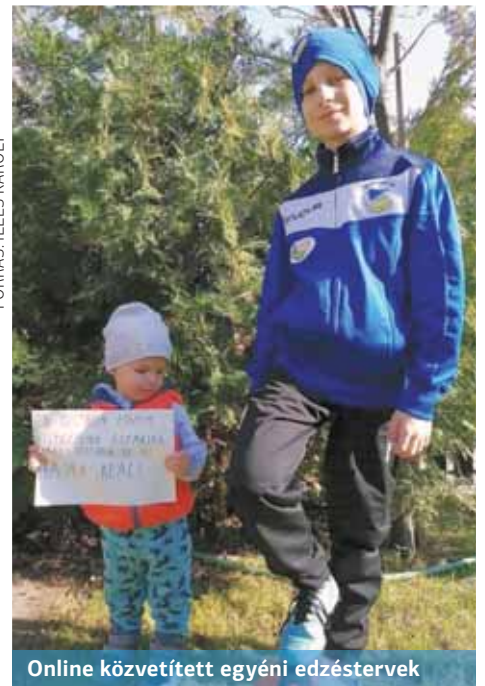
Online közvetített egyéni edzéstervek

– A mostani helyzetben az atlétáknak és a kézilabdázóknak szoktam feladatokat küldeni. A