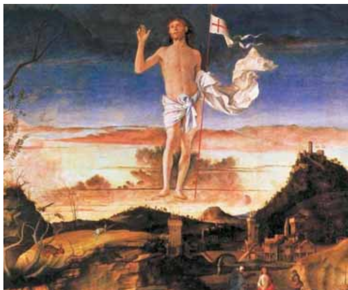
GIOVANNI BELLINI KRISZTUS FELTÁMADÁSA

– A közösségi oldalunkon mindennap többször küldök igei gondolatokat és imádságokat a gyülekezet tagjainak, hogy erősítsem a lelkiüket,