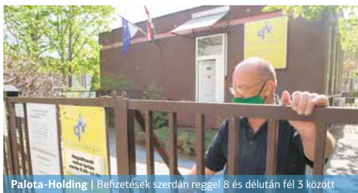
Palota-Holding | Befizetések szerdán reggel 8 és délután fél 3 között

Az önkormányzat új bérlakáskonceptió megvalósításán dolgozik, amihez a Palota-Holding készít szakmai értékelést, elemzőanyagot. Erre létrehoztak egy projektet, melynek keretében teamek dolgozzák ki a rész-