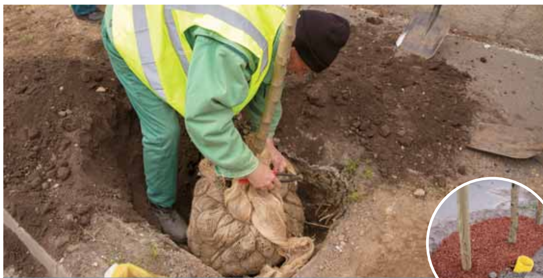
Előnevelt földlabdás facsemeték | Utolsó fázisban az ültetések

„Az utcában lakók, illetve az arra járók tapasztalhatták, hogy néhány hete elkezdtük a fasor-rekonstrukciót, jó néhány többször iskolázott, előnevelt földlabdás facsemetét elültettünk már. A munka most jutott abba a szakaszba, hogy a beteg, menthetetlen, balesetveszélyes régi nagy fákat kivágjuk” – mondta az ügyvezető. Hozzátette: a jelenlegi faállomány összetétele vegyes: főként fehér akác, nyugati platán, kislevelű hárs, japánakác és néhány gyümölcsfa található benne. A fák életkora meghaladja a 40 évet.