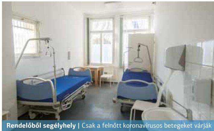
Rendelőből segélyhely | Csak a felnőtt koronavírusos betegeket várják

A segélyhelyen két elkülönített fektető található, ahol azon betegek ellátása történhet majd, akiket mentővel kórházba kell szállítani, de az orvosi beavatkozást már előtte meg kell kezdeni.