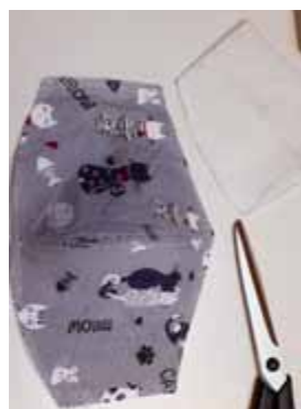
Így néz ki összevarrva.