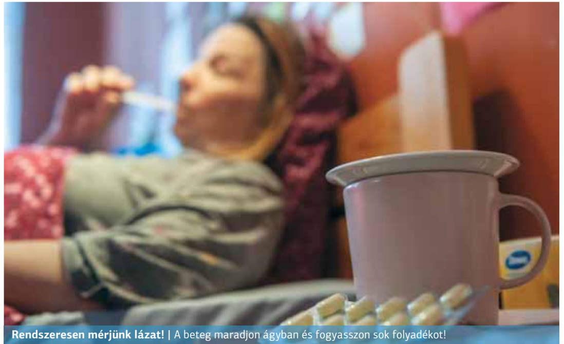
Rendszeresen mérjük lázat! | A beteg maradjon ágyban és fogyasszon sok folyadékot!

Használat után minden tárgyért, poharat, bögrét, evőeszközt alaposan el kell mosogatni. Ha rendelkezésre áll, mosogatógép használata javasolt ezek mosogatására és szárítására. Ha nincs, meleg vizes és mosogatószeres kézi mosás (kesztyűben!) és alapos törölés, egy külön, mások által nem használt konyharuhával. Minden szennyes ruhaneműt, ágyneműt, törülközőket,