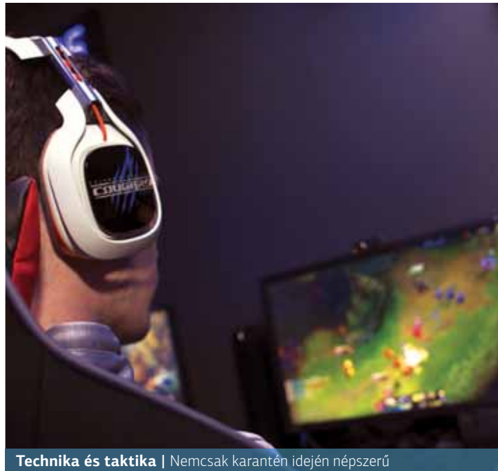
Technika és taktika | Nemcsak karantén idején népszerű

– Jelenleg egy 16–17 fős csapattal rendelkezünk, melynek minden tagja igazolt sportoló. A mérkőzéseinket a Hungarian Pro Clubs League második vonalában játszunk Grosics Alapítvány E-Sport néven. A bajnokság nemrég kezdődött, egyelőre a mezőny végéhez