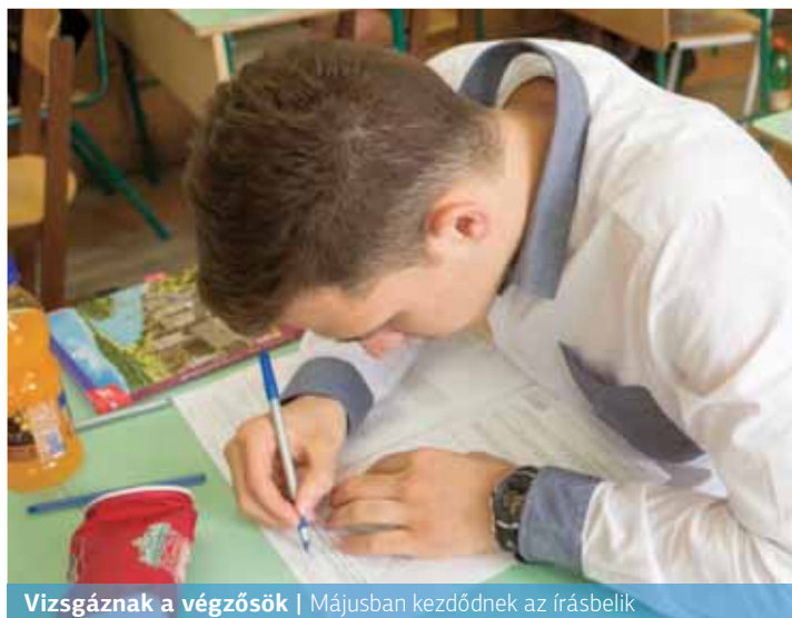
Vizsgáznak a végzősök | Májusban kezdődnek az írásbelik

Az ő esetükben a beiratkozás április 28. – május 15. között lesz. Itt is elsősorban az online módszer és a KRÉTA-felület lesz preferálva, ám azok számára, akik valamilyen okból kifolyólag nem tudnak online jelentkezni, az intézmények-