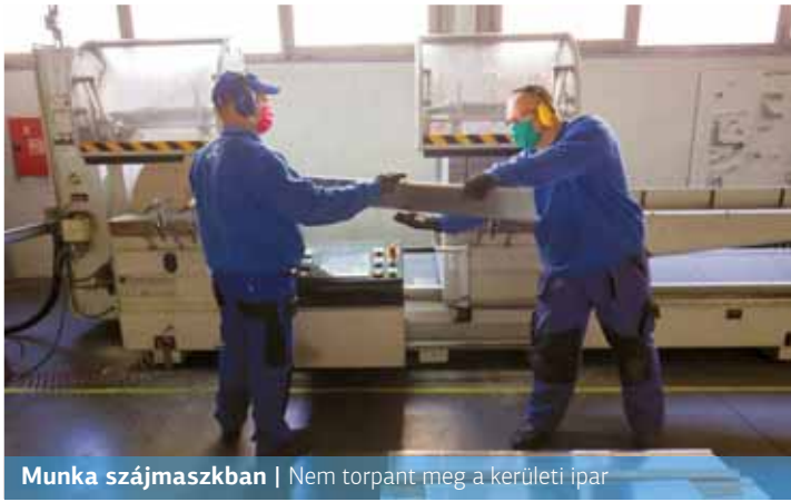
Munka szájmáskban | Nem torpant meg a kerületi ipar

Sem a Jármű Zrt., sem pedig a Siemens Energy Kft. nem állította le a termelést itt, a XV. kerületben. A koronavírus okozta járvány miatt azonban számos intézkedést vezettek be a dolgozók egészségének védelme érdekében.