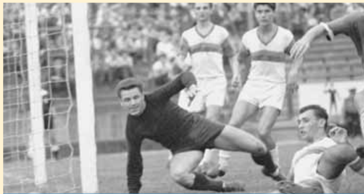
199 bajnoki mérkőzésen védett | Legnagyobb sikerei a Csepel SC-hez kötődnek

Legnagyobb sikerét 1968-ban érte el azzal, hogy tagja volt a mexikói olimpián aranyérmes magyar labdarúgó-válogatottnak. 1968-ban mind a hat mérkőzésen (Salvador 4-0, Ghána 2-2, Izrael 2-0, Guatemala 1-0, Japán 5-0