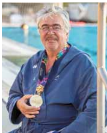
A Magyar Köztársasági Érdemrend lovagkeresztje polgári tagozat kitüntetését vehette át Kenéz György olimpiai bajnok vízilabdázó augusztus 20-án alkalmából.