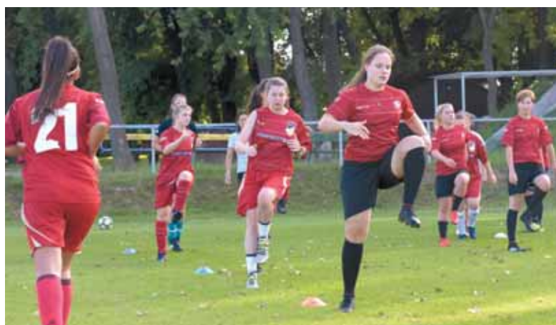
Fuzionált a REAC Sportiskola és az 1.FC Femina június 1-én, és a női csapatok már REAC SISE–Femina néven szerepelnek.