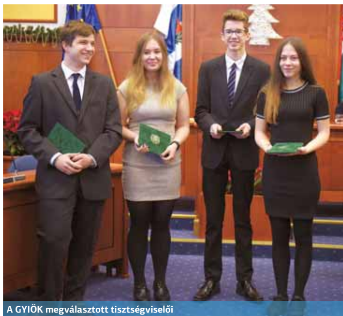
A GYIÖK megválasztott tisztségviselői

(A testületi ülések élőben és felvétellel is megtekinthetők az onkormanyzati.tv és a bpxv.hu honlapokon.)