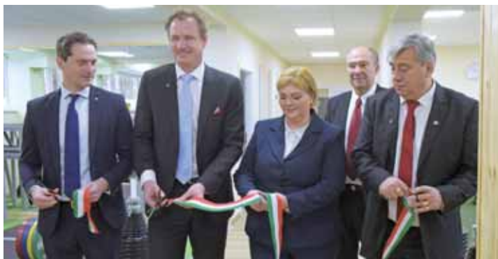
Január végén átadták az új, tízállásos súlyemelőközpontot a Budai II. László Stadion főépületének alagsorában.