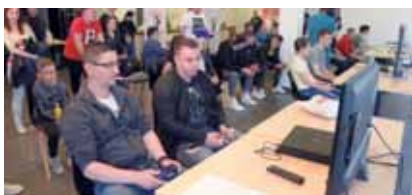
A Grosics Gyula Kapusiskola a kerületben elsőként hozta létre e-sportszakosztályát, majd március 24-én a Spirálház Pajtás Éttermében az első versenyét is megrendezte.

Városrésünkben élt a vívó olimpiai bajnok Kulcsár Győző, akiről sportolói ösztöndíjat neveztek el a kerületben. A százezer forintos támogatást évente nyolc fiatal kaphatja meg.