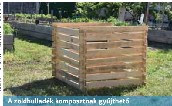
A zöldhulladék komposztálnak gyűjthető

A zero waste, azaz nulla hulladék kifejezés akármennyire is furcsa, még az 1970-es években honosodott meg Kaliforniában. Paul Palmer vegyész alapította azt a társaságot, amely kezdetben festékek és lakkok