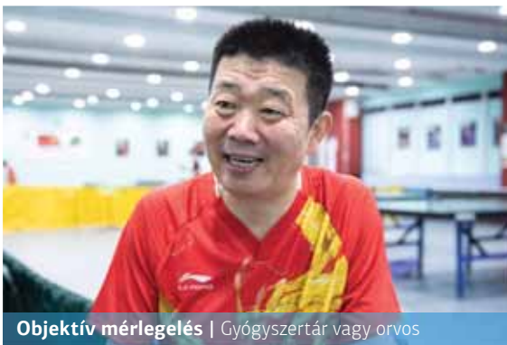
Objektív mérlegelés | Gyógyszertár vagy orvos