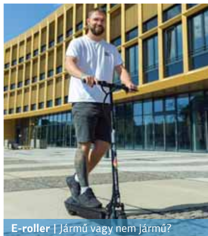
E-roller | Jármű vagy nem jármű?

Pintér Sándor belügyminiszter pedig azt válaszolta egy képviselői kérdésre a legutóbbi parlamenti vitában, hogy „az elektromos rollert a hatályos szabályozás alapján, külön eltérő rendelkezés hiányában csak segédmotoros kerékpárnak lehet megfeleltetni”. Azt is hozzátette, hogy a rendőrség a jogszabályok alapján köteles eljárni – közölte az infostart.hu .