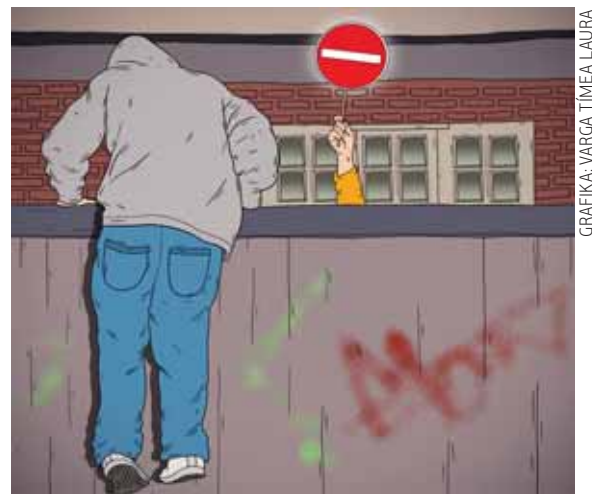
GRAFIKA: VARGA TÍMEA LAURA

Egy családon belül olyannyira megromlott a kapcsolat, hogy a szülők hivatalosan is távolságtartást kértek felnőtt gyermekük ellen, aki viszont többször megszegte a határozatot és visszatért a szülői házba. A rendőrség ezért vizsgálatot indított a férfi ellen. ◆