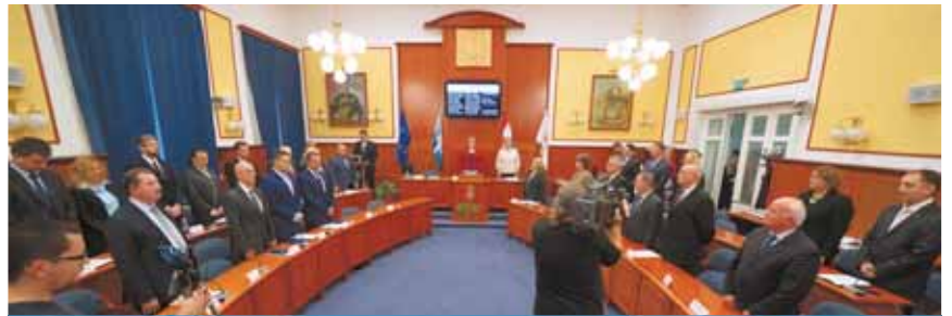
A képviselők leteszik az esküt

Megtartotta alakuló ülését a képviselő-testület október 29-én. A megbízólevelek átvételét és az esküteteleket követően a képviselők megválasztották az alpolgármestereket.