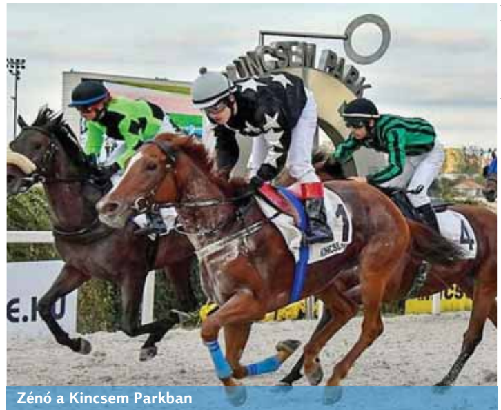
Zénó a Kincsem Parkban