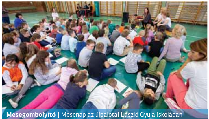
Mesegombolyító | Mesenap az újpalotai László Gyula iskolában