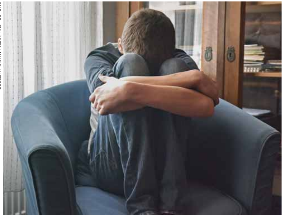
ILLUSZTRÁCIÓ: XV MÉDIA, NAGY BOTOND

A depresszió betegség, így csak klinikai pszichológus vagy pszichiáter kezelheti, de első körben az is segíthet, ha a háziorvost keressük fel a tünetekkel, ő megmondja, hova forduljunk. A pszichológus elmondta, hogy a mai napig szégyenként éli meg a beteg és a környezet is a depressziót. „Sokan nem akarnak terápiára járni, súlyosabb esetben gyógyszer szedni, megpróbálják eltitkolni az állapotukat. A családtagoknak is nagyon nehéz helyzet ez, nem lehet hosszú ideig benne lenni, mert nincs hála,