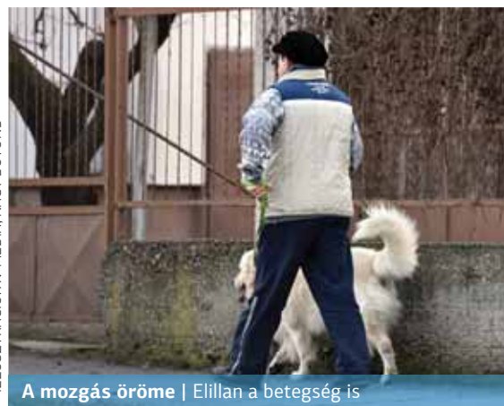
ILLUSZTRÁCIÓ: XV MÉDIA, NAGY BÓTOND