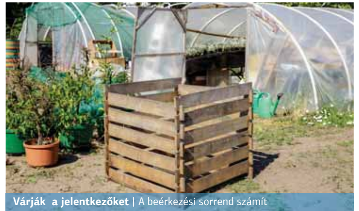
Várják a jelentkezőket | A beérkezési sorrend számít

A korábbi évekhez hasonlóan idén is folytatódik kerületünkben a házi komposztálási program.