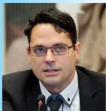
Pintér Gábor Fidesz-KDNP frakcióvezető

A területtel kapcsolatos tervekről elmondta: „mivel nem tudtunk építkezni, ezért vettünk magunknak egy házat Rákospalotán, és amíg a gyerekek ki nem repülnek, addig itt élünk majd. Ha a gyerekeink szeretnének itt maradni, akkor lehet cél, hogy építkezzünk a meglévő telkekre. De ez valószínűleg nem fog 10 éven belül megvalósulni. Persze, a fejlesztésnek csak örülni lehet, hiszen ez egy lehetőség, az viszont egy kicsit furcsa, miért most jutottunk el ideig.”