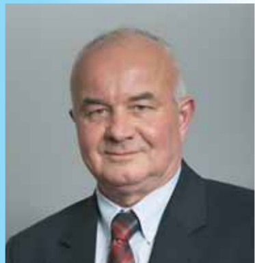
Hajdu László országgyűlési képviselő

„A kerület fejlesztése szempontjából az egyik legfontosabb beruházások egyike” – mondta Hajdu László országgyűlési képviselő a Szilas menti főgyűjtő megépítéséről. Hozzátette, hogy a városrész többi része már csatornázott.