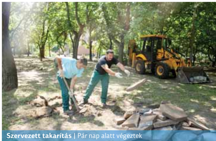
Szervezett takarítás | Pár nap alatt végeztek

található sportpályák is elhanyagolt, lepusztult képet nyújtottak.