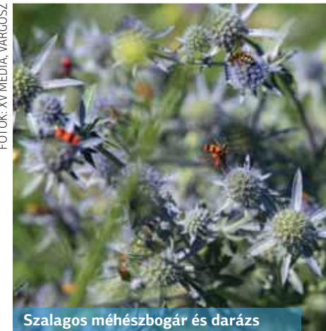
Szalagos méhészbogár és darázs

– Elsősorban a poloskákat gyűjtöm, természetesen csak fényképen. Csak azóta foglalkozom rovarokkal, amióta van digitális fényképezőgépem. A növény- és állatfajokban gazdag kert nagyszerű lehetőség az