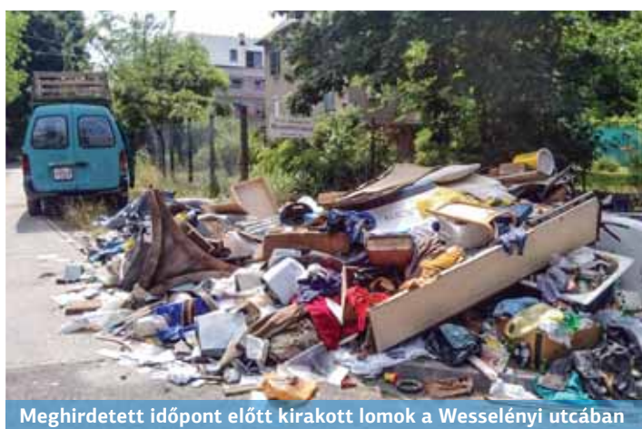
Meghirdetett időpont előtt kirakott lomok a Wesselényi utcában

Sokan már napokkal a meghirdetett időpont előtt kihordják a