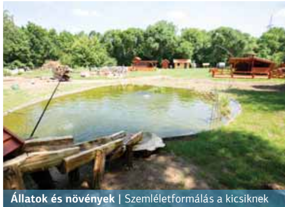
Állatok és növények | Szemléletformálás a kicsiknek

Június elején ünnepelte a Rákossmenti Mezei Őrszolgálat működésének tizedik évfordulóját. Az ünnepség helyszíne Rákosszentmihályon, a Sarjú utcai új telephelyük volt, ahol másfél év alatt rengeteg munkával egy Tanyaudvart alakítottak ki. S bár ez utóbbi még nem készült el teljesen, a tizedik születésnap akár egy udvaravató is lehetett volna.