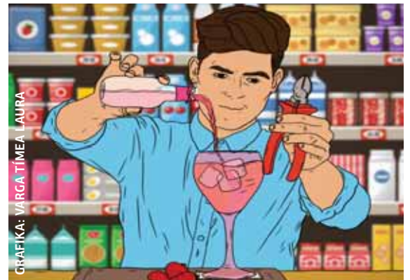
GRAFIKA: VARGA TIMEA - LAURA

Az esti koktélt akarta egy férfi összeállítani az egyik bevásárlóközpontban. Ezért egy csípőfogót is magával vitt, amivel az ital alapjául szolgáló szeszes italról lecsippentette az áruvédelmi eszközt. Az üveget egy flakon ásványvízzel együtt a táskájába tette, majd egy másik ásványvízzel a kezében a pénztárhoz szietett, ahol már várták őt a biztonsági őrök, akik a rendőrök kérésére visszatartották a férfit. ♦