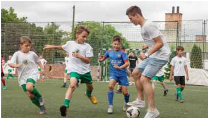
Büszke akadémia | Tehetségeik a válogatottban