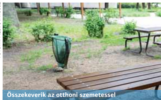
Összekeverik az otthoni szemetessel

Arra jók, hogy ezekbe dobják a kiürült üdítő dobozokat, palackokat, használt papír zsebkendőt, kéztörölőt, hogy ezek ne a parkokat, játszótéreket csúfítsák.