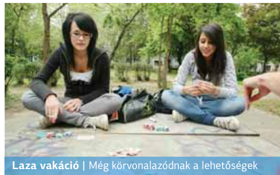
Laza vakáció | Még körvonalazódnak a lehetőségek

A tanév utolsó hetében kerestünk meg középiskolás fiatalokat, hogy töltsenek ki egy anonim internetes kérdőívet a nyári terveikről.