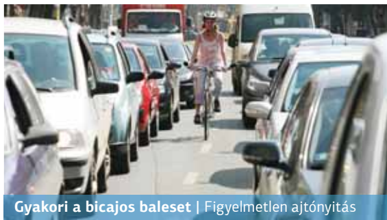
Gyakori a bicajos baleset | Figyelmetlen ajtónyitás

A kerékpárosok és az autósok viszonya sosem volt felhőtlen. Pedig érdemes volna rendezni a viszonyokat, már csak azért is, mert a statisztikák szerint az EU-s országok között hazánk élen jár a közúti haláleseteken belül a kerékpáros balesetek arányában.