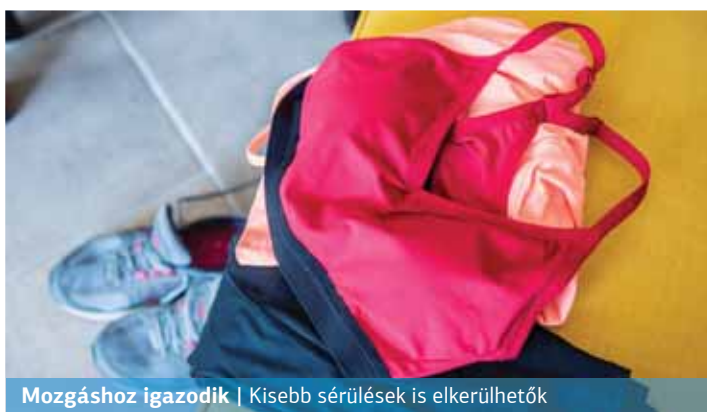
Mozgáshoz igazodik | Kisebb sérülések is elkerülhetők

Az elmúlt száz évben azonban ezen a területen is óriási változott a világ. A technikai anyagok folyamatos kutatás és fejlesztés alatt állnak azért, hogy az akár hobbi-, akár versenysportolók a legnagyobb kényelemben és teljesítménykapacitás mellett mozoghassanak.