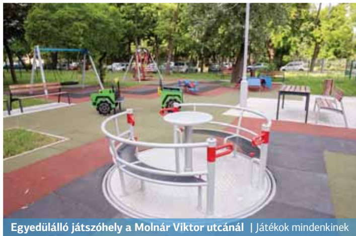
Egyedülálló játszóhely a Molnár Viktor utcánál | Játékok mindenkinek

Tavaly – a környező kerületekben is egyedülállóan – egy integrált játszótér épült a Molnár Viktor utca – Lócsevár utca sarkán, ahol a mozgáskorlátozott, sérült és ép gyermekek együtt játszhatnak. A játszóhelyen hat játszóeszköz (kerekeszékés hinta, kerekeszékkel is használható forgójáték, fészekhinta, integrált rugós libikóka és homokozó, többfunkciós játék) várja a kisebbeket és nagyobbakat. A Drégelyvár utca Pestújhely felőli oldalán szintén új játszótér létesült, ahol több korosztály számára is sokféle lehetőség van a szabadidő eltöltésére.