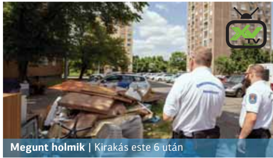
Megunt holmik | Kirakás este 6 után