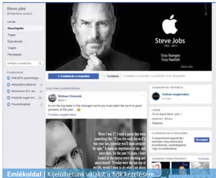
Emlékdalt | Kijelölhetünk valakit a fiók kezelésére.

A közösségi média sűgő oldala többféle megoldást kínál: rendelkezhetünk mi magunk a személyes oldalunk sorsáról, eldönthetjük, halálunk után töröljék az egészet vagy kijelölhetünk egy úgynevezett hagyatéki kapcsolattartót. A hagyatéki kapcsolattartó az az ember, akit a fiókunk gondozására kiválaszthatunk, ha emlékdalt sze-