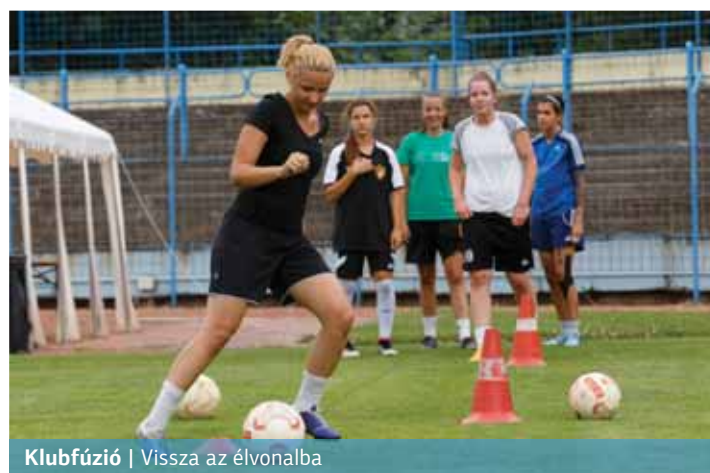
Klubfúzió | Vissza az élvonalba

A REAC Sportiskola és a 1. FC Femina június 1-én „örök hűséget” esküdött egymásnak. A két klub ugyanis fuzionált, és a női labdarúgócsapatok a jövőben REAC SISE-Femina néven szerepelnek majd.