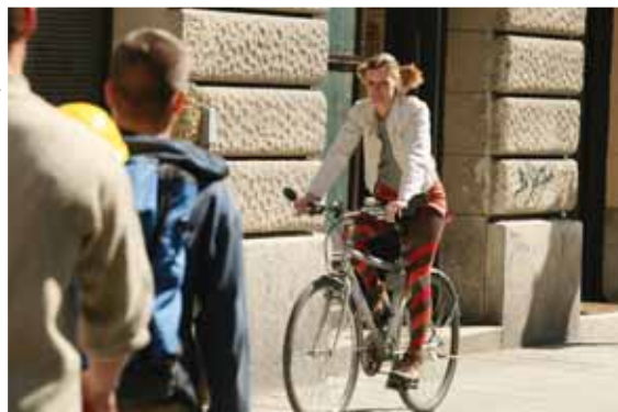
Bicajozni jó... | De nem mindegy, hogy hol!

Az esetek többségében az úttesten kell és érdemes közlekedniük a bicikliseknek, ha csak azt nem jelzi tiltás. Egyébként, ha az út mellett kerékpárút húzódik, azt kötelező használniuk, kivéve, ha az úttesten kerékpáros piktogramot festettek fel, ez esetben ugyanis mindkettőt használhatják – derül ki a Magyar Kerékpárosklub kisokosából.