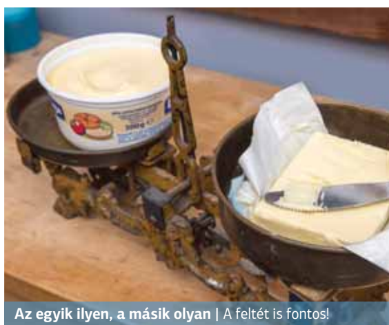
Az egyik ilyen, a másik olyan | A feltét is fontos!

A vaj tejből készülő állati eredetű zsíradék. A margarin – a közhiedelemmel ellentétben – nem kőolajból, hanem növényi eredetű zsíradékokból (repce-, napraforgó-, len- vagy pálmaolajból, kókuszszírból) készül. A margarint korábban hidrogénezéssel állították elő, amely jelentősen megnövelte az úgynevezett transzszírsavak mennyiségét a termékben. Ezekről a zsírsavakról pedig azt kell tudni, hogy ha nagy mennyiségben fogyasztjuk őket, kedvezőtlen hatással lehet-