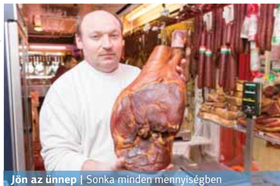
Jön az ünnep | Sonka minden mennyiségben

Jó barátaink, a lengyelek például különleges asztaldíszszel emlékeznek meg a húsvétról, és vajból faragnak báránnyt, melyet rendszerint az asztal közepére helyeznek. Míg Németországban a bárány szimbolikája egy édes sütemény formájában ölt testet, de sok család tányérjában helyet kap a báránysült is. Nagycsütör-