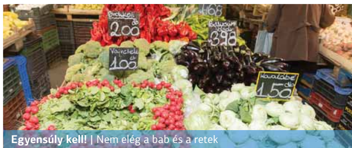
Egyensúly kell! | Nem elég a bab és a retek

A lúgosító diéta, bár nem új keletű, hiszen már a XIX-XX. században is létezett, a mai napig töretlen népszerűségnek örvend. Annak ellenére, hogy a szakemberek szerint a szervezet sav-bázis egyensúlyát étrenddel befolyásolni nem lehet.