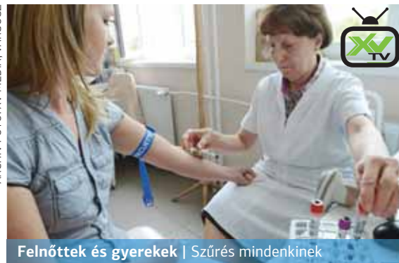
Felnőttek és gyerekek | Szűrés mindenkinek

A tavaszi egészségnapot május 11-én reggel 8 és délután 2 óra között rendezik a Rákos úti szakrendelőben, ahol kizárólag a felnőttek részvételére számítanak. A szervezőktől kapott információ alapján a 14 év alatti gyermekek számára hagyományosan meghirdetett Zsókaúti utcai szűrőnapot novemberben rendezik.