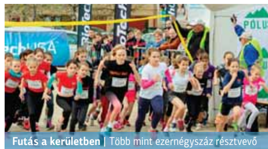
Futás a kerületben | Több mint ezernégy száz résztvevő

Huszonharmadik alkalommal rendezte meg Újpalotán a Budapesti Atlétikai Szövetség a Palota Kupa futófesztivált. A szervezőknek idén mintegy ezernégy száz embert sikerült megmozgatniuk, így április 6-án a telt ház táblát is ki lehetett volna tenni a kerületi bevásárlóközpont parkolójában.