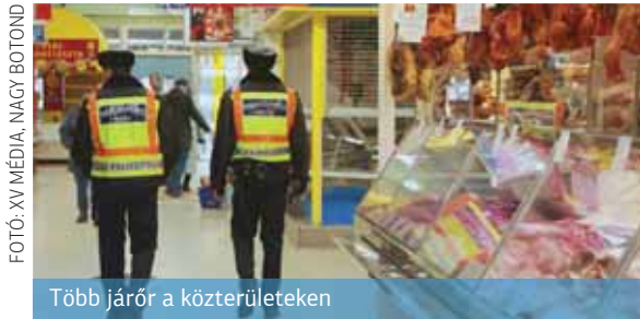
Több járőr a közterületeken