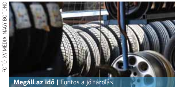
Megáll az idő | Fontos a jó tárolás

Talán furcsának tűnhet a címben szereplő kérdés, pedig jogos. Ugyanis az abroncs nem gyorsan romló áru, így nem kell mindenáron az ideai gyártásút keresni. Hasznos tulajdonságait megfelelő tárolás mellett éveken át megőrzi.