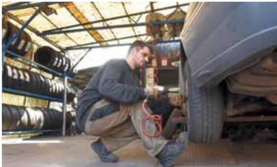
Gumiabroncscímke | Fontos paramétereket tartalmaz

Hamarosan eljön a téli gumiabroncs-csere ideje, mégpedig akkor, ha az átlaghőmérséklet tartósan 7 Celsius-fok fölé emelkedik. Azonban korántsem mindegy, hogy milyen minőségű abroncsot választunk, a széles méret-, ár- és minőségbeli kínálatból azonban nehéz kiválasztani az ideálisat.