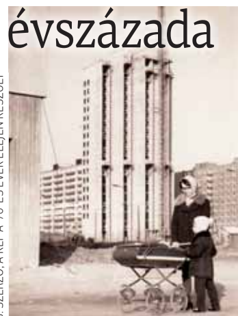
FORRÁS: SZERZŐ: A KÉP A '70-ESES ÉVEK ELEJÉN KÉSZÜLT

A javarészt mezőgazdasági területen épülő, emberközpontú telep házait a 43-as Számú Építőipari Vállalat 3-as Számú Házgyárában készítették. Komoly szervezőmunkát igényelt, hogy naponta 15 lakás paneljét elkészítsék a gyárban, amit azonnal beépítettek a tízemeletes házakba, írta a Tükör című lap 1970. november 10-i számában. Két évvel később is meglátogatták az újságírók Újpalotát, akkor így látták a telepet (részlet a Tükör 1972. szeptember 12-i cikkéből): „Sétálunk tovább az utcán, a leendő főútvonalon, ahol már megépültek a villamosvágányok – sajnos nem a kéreg alatt, ahogy tervezték –, a kétirányú autópálya, egy-egy, a lakóházakhoz csatlakozó belső forgal-