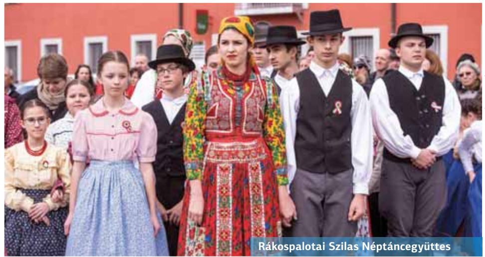
Rákospalotai Szilas Néptáncgyűttes

– Ahogy a történelmi időkben, úgy ma is egy kis közösség életében a helyi, lokálpatrióta értékek és vállalások mentén kötelesek vagyunk helytállni – mondta Németh Angéla polgármester az idei ünnepségen. – Ezeket az alapvető értékeket és célokat ma is vállalhatjuk, a magunk szűkebb pátriájában, lokálpatriótaként küzdenünk kell és küzdenünk is érdemes értük a mindennapokban.