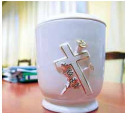
Kegyeletsértés | Nem egyedi eset

tat valóban a Budapesti Temetkezési Intézet protokollja alapján hamvasztották el, majd megpróbálják értesíteni a hozzátartozókat. A hamvakat általában egy évig szokták megőrizni, ám ha senki sem jelentkezik értük, akkor jeltelen sírba temetik.