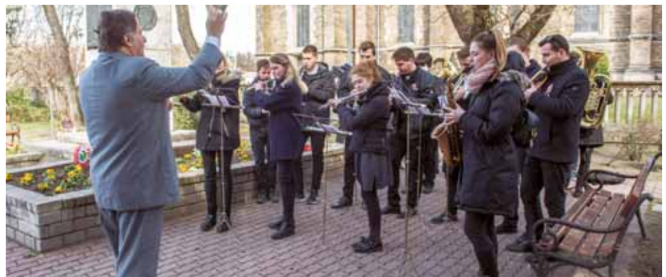
Hubay Jenő Ifjúsági Fúvószenekar

A rákospalotai Széchenyi téren, a Batthyány Lajos-emlékműnél is tartottak ünnepséget. Ezt korábban az önkormányzat szervezte, ám 2011 óta ezt a feladatot az Együtt Újpalotáért Kulturális és