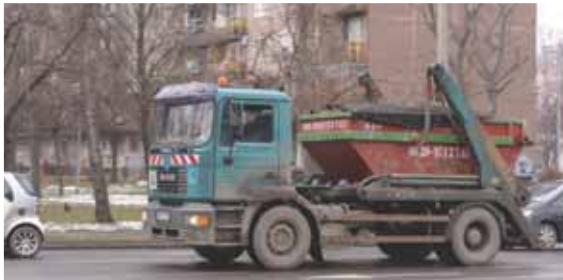
Átmenő nehézségek | Legyen menetlevél és tachográf!

Sokan panaszkodnak a kerületben az átmenő teherautó-forgalomra. A nehézgépjárművek ugyanis nemcsak a személyautó-forgalmat lassítják, hanem az útburkolatot is rongálják, illetve a gépjárművek zaja a lakosságot is zavarja.