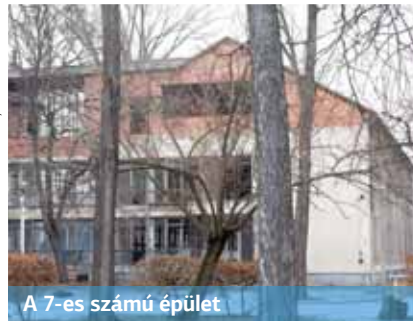
A 7-es számú épület