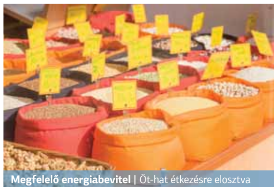
Megfelelő energiabevitel | Öt-hat étkezésre elosztva

– A rendszeres testedzést azért nem úszhatjuk meg, mert ez növeli a sejtek inzulinérzékenységét. Így az IR terápiájának egyik alappillére a kardio- és erősítő edzés is magába foglaló rendszeres testmozgás, a másik pedig a megfelelő