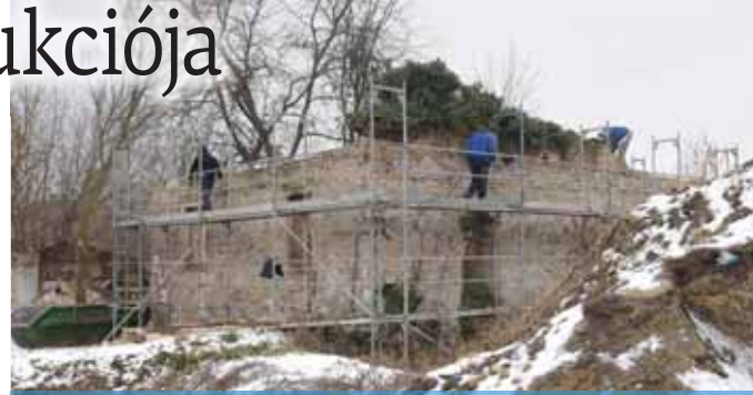
Állagmegóvás | Rendezvényeknek adna otthont