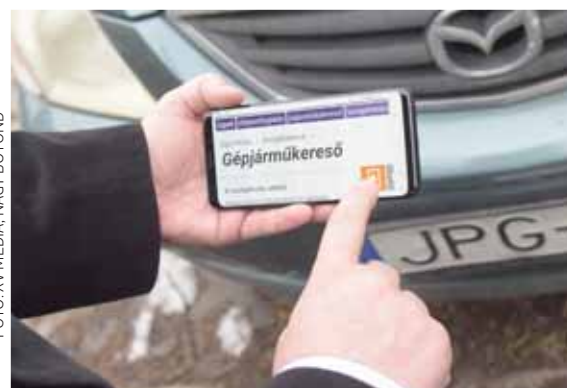
Vége a tekergetésnek? | Egy év szabadságvesztéssel járhat

A központi adatbázisrendszerből korlátlanul és ingyenesen lehet utánanézni a gépjárműveknek. A platform egyik nagy előnye, hogy az új autótulajdonos ellenőrizheti, hogy ténylegesen annyi-e a kilométer-