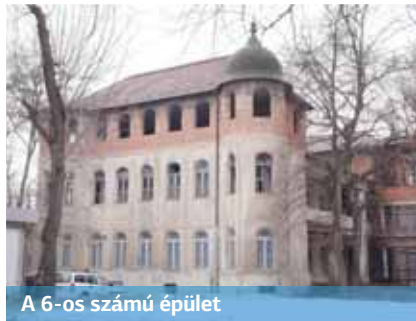
A 6-os számú épület