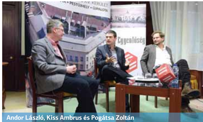
Andor László, Kiss Ambrus és Pogátsa Zoltán

Városházi esték címmel indult közéleti rendezvénysorozat az Új Egyenlőség magazin szerkesztőségében. Első alkalommal, január 23-án az elmúlt nyolc év gazdaság- és bérpolitikája volt a téma. Az érdeklődők megtöltötték a hivatal házasságkötő termét, ahol Németh Angéla polgármester köszöntője után Andor László, az Európai Bizottság egykori biztosa és Pogátsa Zoltán közgazdász, szociológus Kiss Ambrus moderálásával közérthetően beszélgettek ezekről a komoly szakmai témákról.