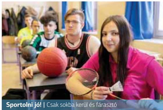
Sportolni jó! | Csak sokba kerül és fásasztó

A megkérdezettek 73 százaléka sportolt hivatalosan egyesületi vagy iskolai csapatban az elmúlt években, de jelenleg csak egy fiatal jár rendszeresen edzeni. Az eddig kipróbált sportágak