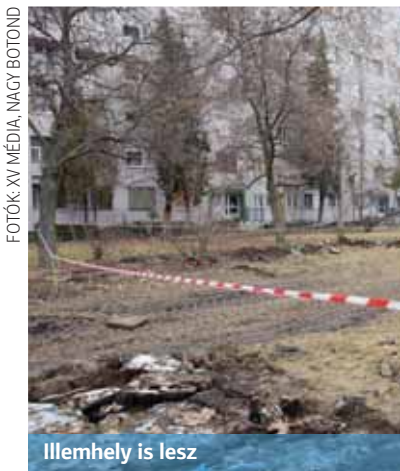
Illemhely is lesz

és egy 400 méteres futókört is épít a meglévő játszótér mellett – sorolta Tóth Imre alpolgármester.