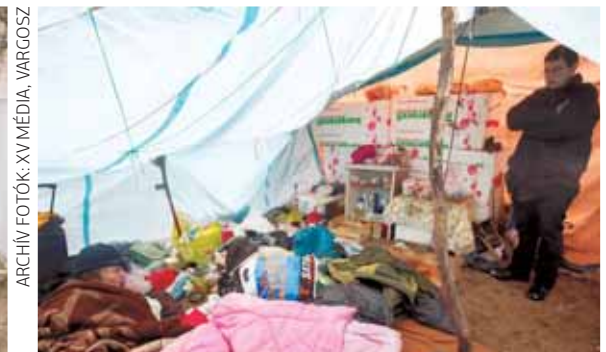
Szociális munkás egyik gondozottjakkal