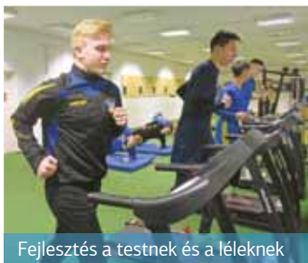
Fejlesztés a testnek és a léleknek

sori helyiségben tudtunk maximum egy-két gyerekkel erősíteni. De azon a helyiségen is osztoznunk kellett a súlyemelő-szakosztályunkkal.