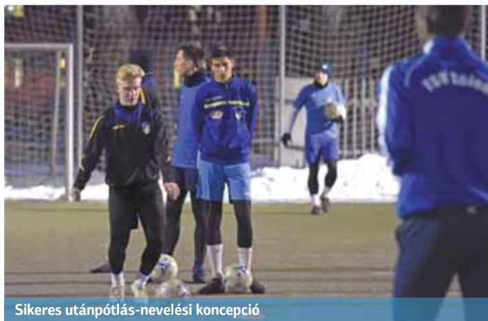
Sikeres utánpótlás-nevelési koncepció