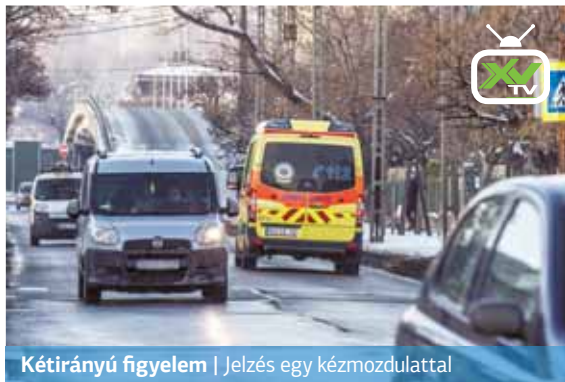
KÉTIRÁNYÚ FIGYELEM | Jelzés egy kézmozdulattal

A mentők akkor tudnak a leghatékonyabban dolgozni, ha gépkocsivezetőik segítséget kapnak a többi közlekedőtől – mondta el Győrfi Pál, az Országos Mentőszolgálat szóvivője egy, a mentők számára szervezett vezetéstechnikai tréningen.