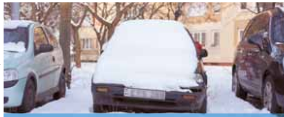
FELSZÓLÍTÁS A SZÉLVÉDŐN | Költséges szállítás

Évente átlagosan 700-800 közterületen hosszabb ideje álló, üzemképtelenné minősülő járművet derítenek fel a rendészeti osztály járőrei, ennek egy részét lakossági bejelentések alapján. A közterület-felügyelők mindig