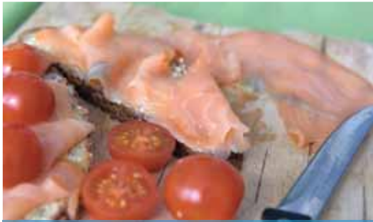
Zsírszegény húsok | A rostok segítenek

A laborleteken gyakran magas a koleszterin értéke, ami nélkülözhetetlen vegyület az emberi szervezet számára. Sejtmembránok, az epesavak, valamint egyes hormonok alkotóeleme. De mint az esetek többségében, a koleszterin kapcsán is igaz, a jóból is megárt a sok.