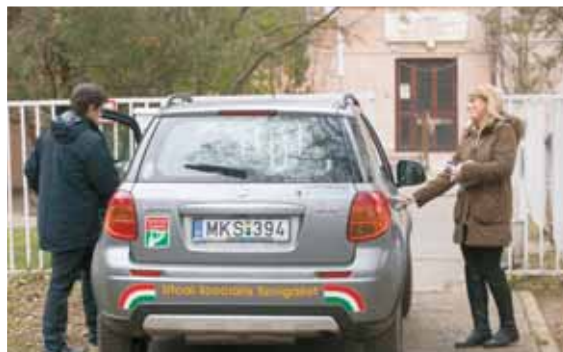
Körútra indulnak a Gondozó Szolgálat munkatársai

– Az Egyesített Szociális Intézmény Család- és Gyermejjóléti Központ keretein belül működő Utcai Gondozó Szolgálat a 2018–19-es téli krízisidőszakban – azaz 2018. november 1. és 2019. április 30. között hétköznapokon – a Twist Olivér Alapítvány munkatársainak ügyeleti idejével