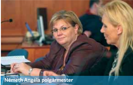
Németh Angéla polgármester

A kisebb civil szervezetek kétszáz ezer forintos egyszerűsített támogatást vezet be a Nemzeti Együttműködési Alap (NEA), a nagyobbaknál összevonják a korábbi működési és szakmai célú támogatást. Többek között ez is kiderült január 8-án a kerületi Civil Kerekasztal-beszélgetésen.