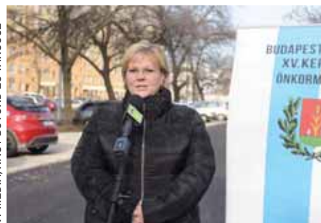
A Nyírpalota úti 81 állásos parkoló átadóján december 14-én