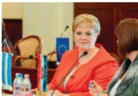
A Fővárosi Közgyűlésben november 14-én, miután letette az esküjét