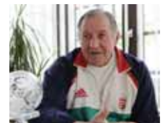
Dr. Géczy István

Gyászolt a kerület, szeptemberben alig egy hét különbséggel két sportlegendát is elveszítettünk. Elhunyt dr. Géczy István, a Ferencváros kapusikonja, olimpiai ezüstérmes, aki három nemzetközi kupa döntőjében is védett, illetve távozott közülünk a négyszeres olimpiai bajnok párbajtőrívó, a Nemzet Sportolója, Kulcsár Győző, aki edzőként is számos vívót vezetett olimpiai bajnoki címre. ■