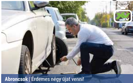
Abroncsok | Érdemes négy újat venni!

A korábbi évekhez képest korábban, már szeptember végén elkezdődött a téligumibroncs-csere szezonja – adta hírül az MTI.