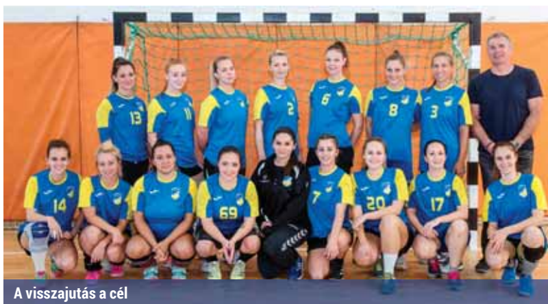
A visszajutás a cél