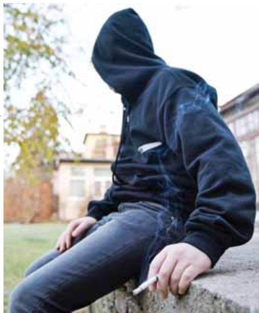
Korai dohányosok | Függőség tizenévesen

Ez a keresztály nagyon nyitott a technikai újdonságokra, így mindenki ismerte az elektromos cigarettát, bár nagyon megosztanak róla a vélemények. A válaszok