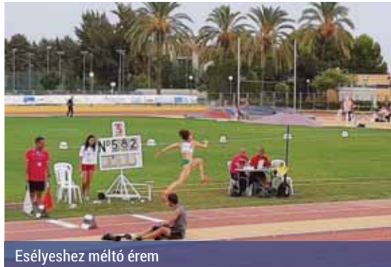
Esélyeshez méltó érem

gai masters világbajnokságon végül a dobogó legfelső fokára is felállhatott.