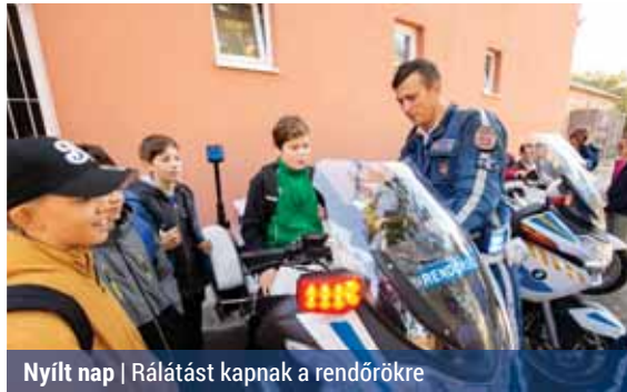
Nyílt nap | Rálátást kapnak a rendőrökre