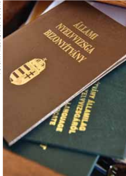
Motivált tanulók | Érettségi a második nyelvből

Néhány „pedagógiai fogással” azonban a motivációt is lehet erősíteni. Példaként hozta fel az igazgató az újságotai iskola egyik hagyományos programját, a szeptember eleji ausztriai táborukat, melynek célja a nyelvismeret erősítése.