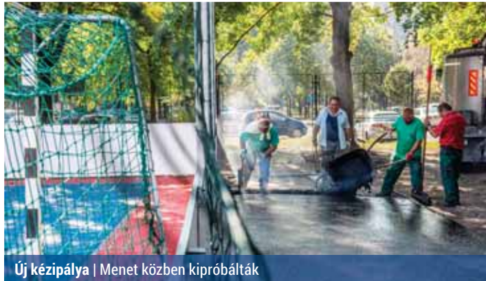
Új kézilapálya | Menet közben kipróbálták