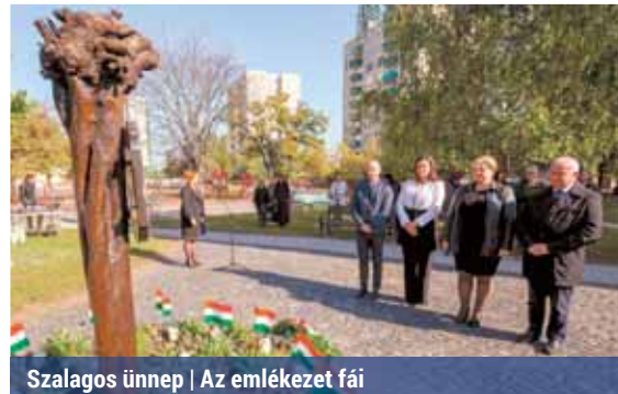
Szalagos ünnep | Az emlékezet fái

A XV. kerületben – azon belül Rákospalotán – nemcsak 169 évvel ezelőtt voltak szabadságpártiak az emberek, hanem ma is méltóképpen ápolják a hősök emlékét. A Batthyány Emlékkertet 2002-ben alapította az önkormányzat – a Kossuth utcában, közvetlenül a Kos-