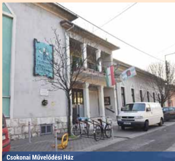
Csokonai Művelődési Ház

– Nagyon büszke vagyok a minősített intézmény címünkre. Ennek az utókövető auditján nagyobb százalékot kaptunk, mint előtte, ami azt jelenti, az intézmény szakmailag továbbfejlődött. Hiányérzetem abban, hogy valamit feltétlenül meg szerettem volna csinálni, de nem tehettem meg, nincs. Minden ötletünk, újításunk valamilyen formában megvalósulhatott. Metz