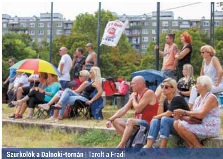
Szurkolók a Dalnoki-tornán | Tarolt a Fradi