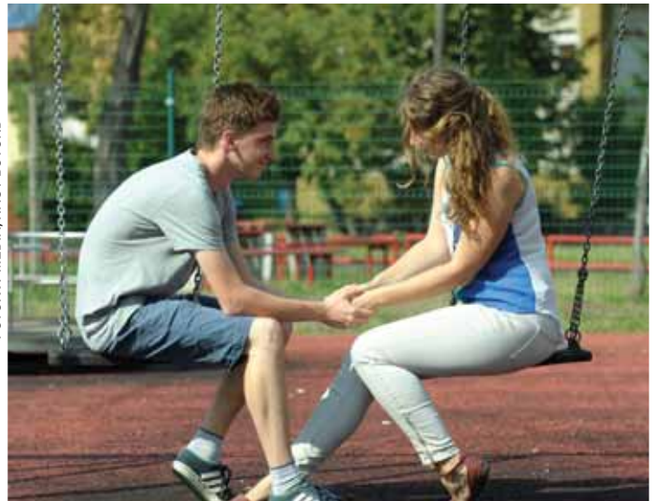
Kíváncsiság vagy valós érzelmek | Beszéljünk a gyerekekkel!

A legnehezebb, ha a gyermek eltér a családi értékrendtől az első szerelmének hatására. Tehát, minél undokabb egy kamasz, minél gyakrabban váltakozik a hangulata, annál jobban igényli a beszélgetést, a segítséget. Arra is érdemes gon-