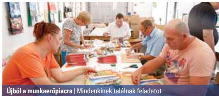
Újból a munkaerőpiacra | Mindenkinek találnak feladatot

A Palota-15 Nonprofit Kft. egyik fő tevékenysége a rehabilitációs foglalkoztatás. A munkájuk nyomán 2013 óta megötszöröztek a foglalkoztatottak számát.