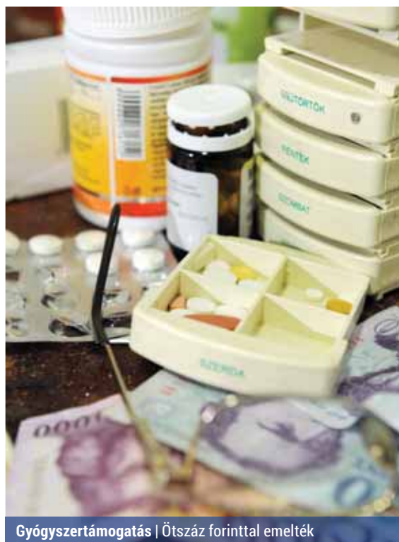
Gyógyszertámogatás | Ötszáz forinttal emelték

Új támogatási formákat is bevezettek. A Palota egészségügyi támogatást gyógyászati segédeszköz vásárlásra használhatják fel a rászoruló, évenként egy alkalommal, maximum 20 000 forint