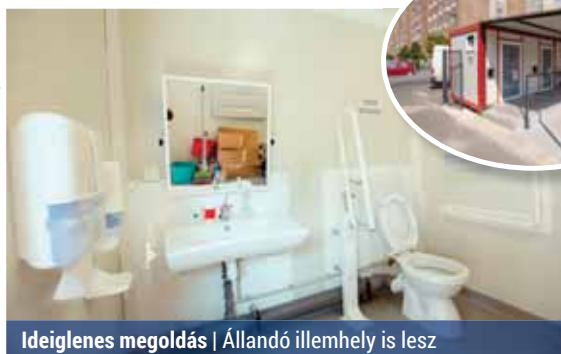
Ideiglenes megoldás | Állandó illemhely is lesz

A WC-nek a piacról és a közterületről is van bejárata. A piac vásárlói a vásárcsarnok nyitvatartási idejében használhatják az illemhelyet alkalmanként 150 forintért,