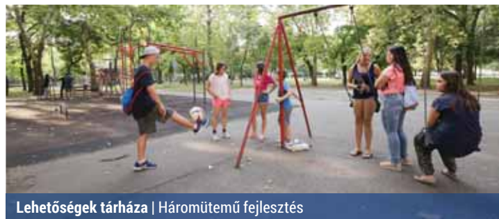
Lehetőségek tárháza | Háromütemű fejlesztés

Miként tud több generáció együtt pihenni, szórakozni? Többek között erről is szó volt augusztus 30-án azon a lakossági tájékoztatón, amit a Kikötő ifjúsági tér Száraznád utcai épületében szervezett az önkormányzat a Nemzedékek Parkja koncepciótervének egyeztetésére.