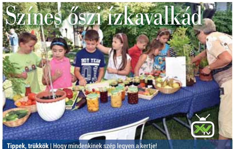
Tipppek, trükkök | Hogy mindenkinek szép legyen a kertje!

De tényleg, mikor mehet egyedül iskolába? Ha Anyán múlik, csak ha elvégezte a nyolc osztályt... Persze tudja, hogy ez képtelenség, de azt