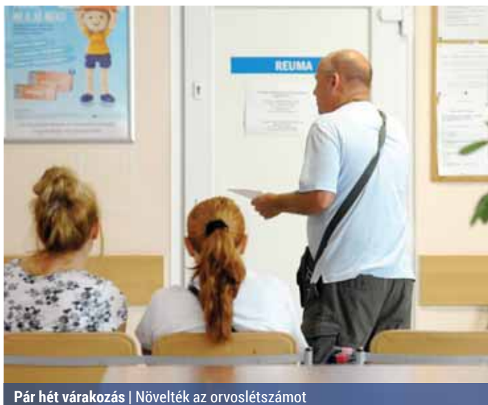
Pár hét várakozás | Növelték az orvoslétszámot

Ekkor történt, hogy a betegek egy részét átrányították a Királyhágó utcai Országos Gerincgyógyászati