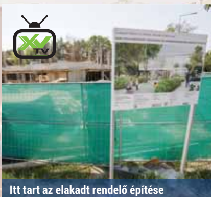
Itt tart az elakadt rendelő építése

A képviselők a munkát zárt üléssel folytatták, amelyen a Csokonai Kulturális Központ igazgatói megbízásáról tárgyaltak. Három pályázat érkezett be határidőre, ebből kettőt érvénytelennek nyilvánítottak. Hosszas vita után végül nem támogatta a