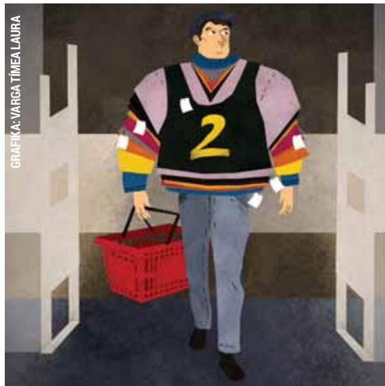
GRAFIKA: VARGA TÍMEA LAURA

Tizenhat pólót akart lopni egy férfi a kerületi bevásárlóközpont egyik divátüzletéből. A tolvaj nem foglalkozott az üzlet biztonsági berendezéseivel, egyszerűen ki akart sétálni a holmikkal, ám az áruvédelmi kapu azonnal beriasztott, a biztonsági őrök pedig visszatartották az elkövetőt. A férfi csak szabálysértési értékben lopott, de mivel ezt már nem először tette, a rendőrség vizsgálatot indított ellene.