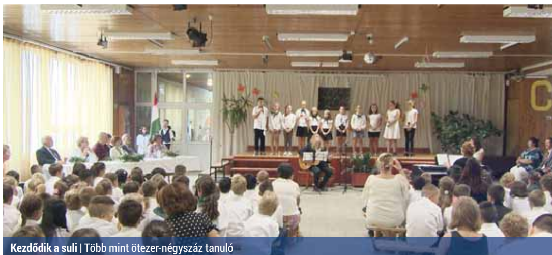
Kezdődik a sulis | Több mint ötezer-négyszáz tanuló

A Kontyfa iskolában szeptember 3-án hivatalosan is megnyitották a 2018/19-es tanévet. A XV. kerület 12 iskolájában több mint ötezer-négyszáz tanuló kezdte el tanulmányait idén ősszel. A kerület iskoláiba mintegy 153 ezer könyvet szállítottak ki. A legtöbb iskolában a diákok az első tanítási napon vehették kézbe az új könyveket – tájékoztatta lapunkat az Észak-Pesti Tankerületi Központ.