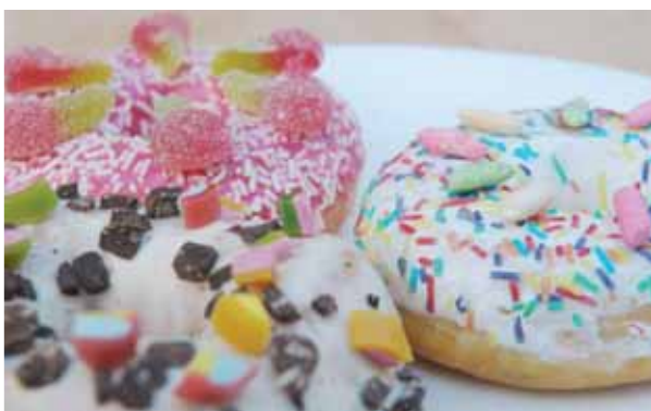
Kerüljük az édeset! | Fontos a mérték megtartása

Az Egészségügyi Világszervezet (WHO) ajánlása szerint nem tilos hozzáadott cukrot fogyasztanunk, de mindenképp érdemes odafigyelni a napi bevitelünkre, illetve túlfogyasztás esetén csökkenteni azt.