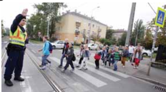
Vigyázó szemek | Nehéz a visszarázódás

– A hosszúra nyúlt nyári szünetet követően a gyerekek, de sokszor a szülők is „lezserőbbek”, figyelmetlenebbek – mondta az osztályvezető. – A személyes jelenlét lényege, hogy felhívja mindenki figyelmét az óvatosságra.