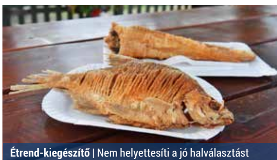
Étrend-kiegészítő | Nem helyettesíti a jó halválasztást

A 79 korábbi kutatás eredményeit összegző vizsgálat