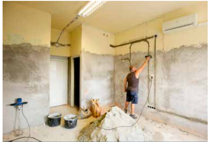
Felújított rendelők | Modern gépeket is beszerettek