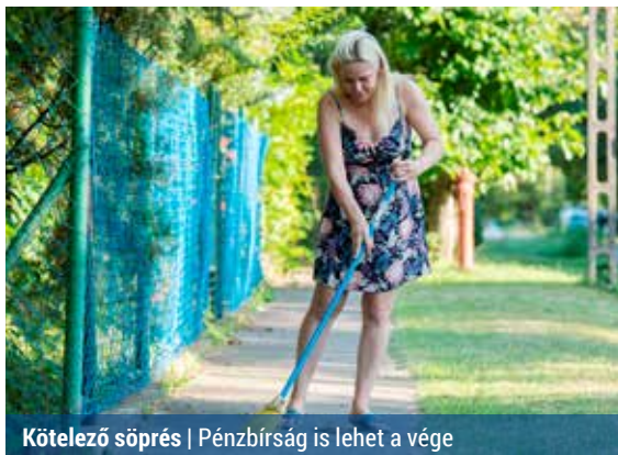
Kötelező söprés | Pénzbírság is lehet a vége

– Általános tapasztalat, hogy nyáron és ősszel kevesebb gondot fordítanak a járda tisztán tartására a tulajdonosok, pedig a fákról lepotyogó virágok, termések, az ősszel lehullott nedves falevél rendkívül csúszós, éppen ezért balesetveszélyes. Egy esetlegesen bekövetkező balesetért pedig az ingatlan