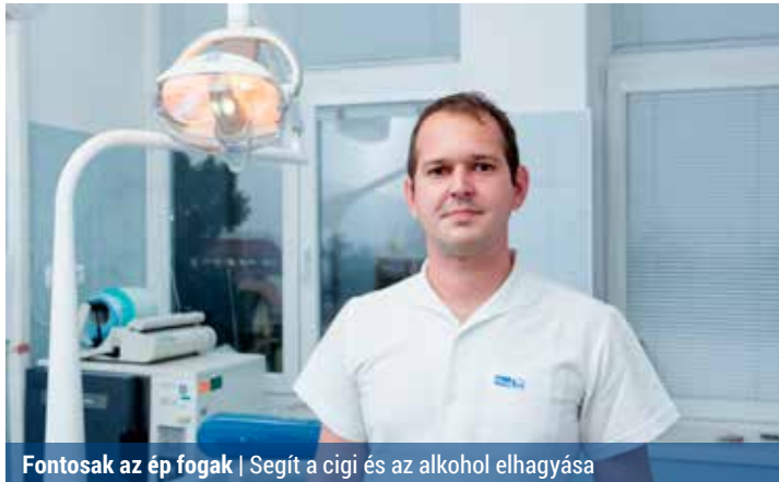
Fontosak az ép fogak | Segít a cigi és az alkohol elhagyása

Szeptembertől folytatódik az egészségügyi szűrőprogram a kerületben. Ezúttal orvosaink egy olyan területen – szájrégi rákszűrés – próbálják majd megelőzni a bajt, amely már tavaly is terítéken volt.