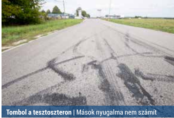
Tombol a tesztszteron | Mások nyugalma nem számít

– A panaszok hozzánk is eljuttottak. Mostanában leggyakrabban a Szentmihályi útról, illetve a Városkapu utcából, M3-Szilas-pihenő jeleznek ilyen versenyeket. Előfordul, hogy a gyorsulók a Pólus parkolójában gyülekeznek, de pont azért, mert odafigyelünk rájuk, gyakran változtatják a találkozási pontjaikat – mondta a szakember.