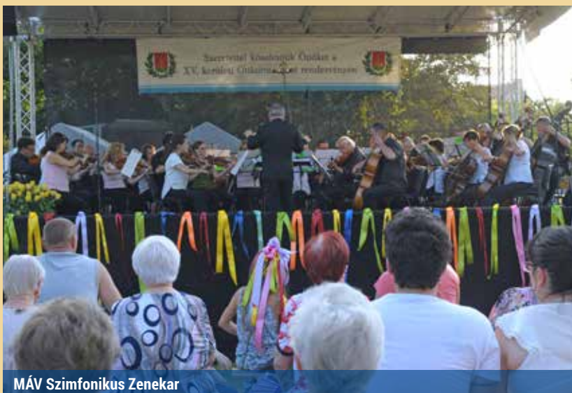
MÁV Szimfonikus Zenekar