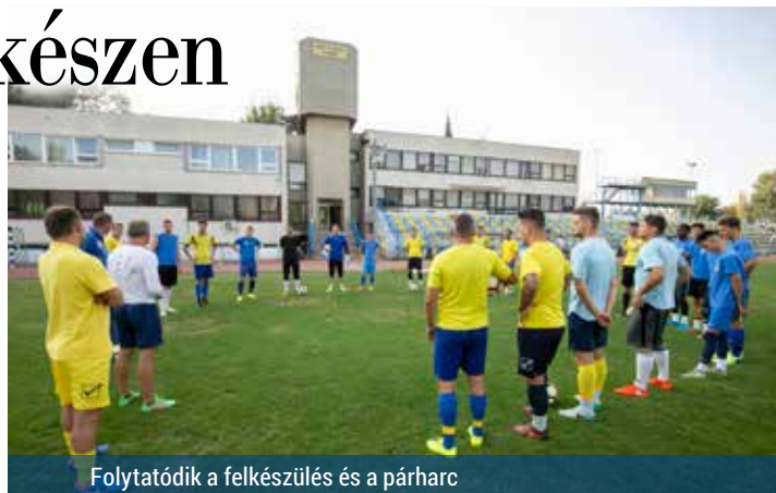
Folytatódik a felkészülés és a párharc