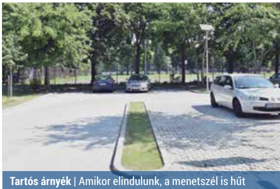
Tartós árnyék | Amikor elindulunk, a menetszél is hűt

Bár kifelé jövünk a nyárból, a hőség nem enyhül. Jól tudjuk, milyen érzés a forró autóra beülni, és várni arra az 1-2 percre, amíg elkezdjük érezni a légkondi áldásos hatását. Vannak azonban praktikák a klíma beindításán túl, amelyek megkönnyítik helyzetünket.