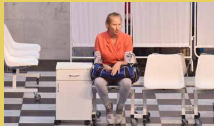
Egyasszony – színházi előadás Péterfy-Novák Éva regényéből