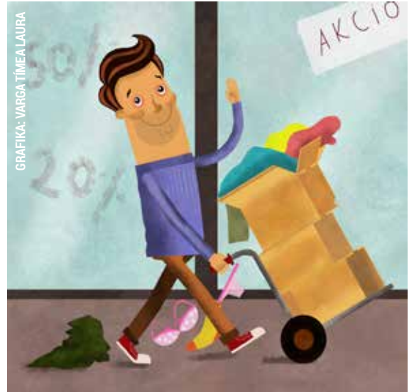
GRAFIKA: VARGA TIMEA LAURA

Azzal gyanúsítanak egy férfit a rendőrök, hogy az egyik kerületi bevásárlóközpontban az egyik üzlet előtt eltolta egy nagy mennyiségű ruhával megpakolt kézikocsit, aztán a ruhákat az épületen belüli tárolóba rejtette. A férfi tagadta a bűncselekményt, ennek ellenére eljárás indult ellene.