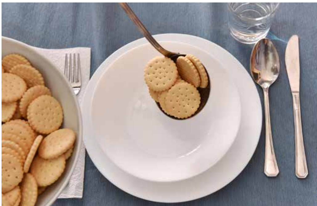
Ránk rontó baktériumok | Étrend lépésről lépésre

A tünetek enyhülésével érdemes fokozatosan felépíteni a diétát. Az első szilárd falatok egyszerű szénhidrátokat (háztartási keksz, kétszersült, pászka,