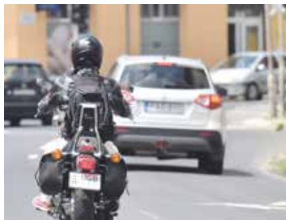
Villámgyors baleset | Száguldó kétkerekűek

kereszteződésben a belátható távolság sokszor csupán 20-30 méter, amit egy gyorsan hajtó motoros alig 1 másodperc alatt tesz meg.