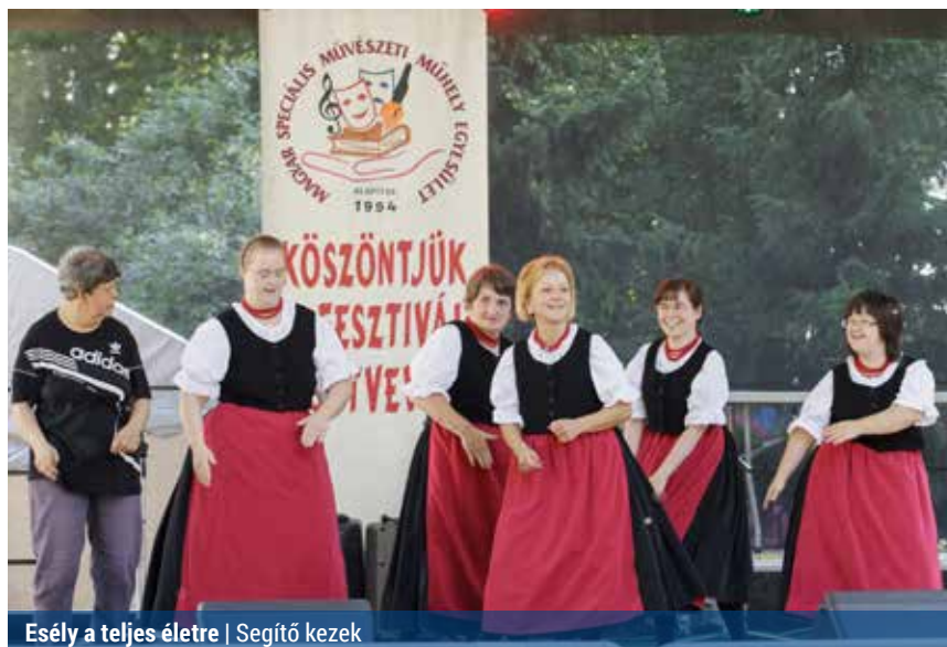
Esély a teljes életre | Segítő kezek

Magyarországon ezer terhességre jut egy Down-szindrómás baba, azonban az anya életkora meghatározó, ugyanis 45 éves kor fölött már 6 százalék a rendellenesség kockázata. Ahhoz pedig, hogy megértsük a Down-kór genetikai lényegét, érdemes felidézni néhány alapvető dolgot sejtjeinkről. Az embernek 23 kromoszómapárja van, összesen 46, melyből 23 anyai, 23 apai