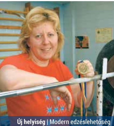
Új helyiség | Modern edzéslehetőség

A Magyar Súlyemelő Szövetség az Emberi Erőforrások Minisztériuma által biztosított sportágfejlesztési támogatásból budapesti súlyemelőközpontot épít Rákospalotán. A Budai II. László Stadion alagsorában kialakítandó helyiség 200 négyzetméteres lesz, és 14 munkahelyet biztosít majd a sportolónak.