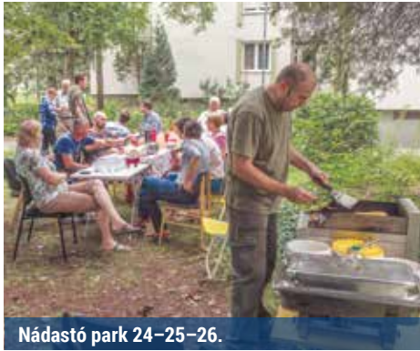
Nádastó park 24-25-26.