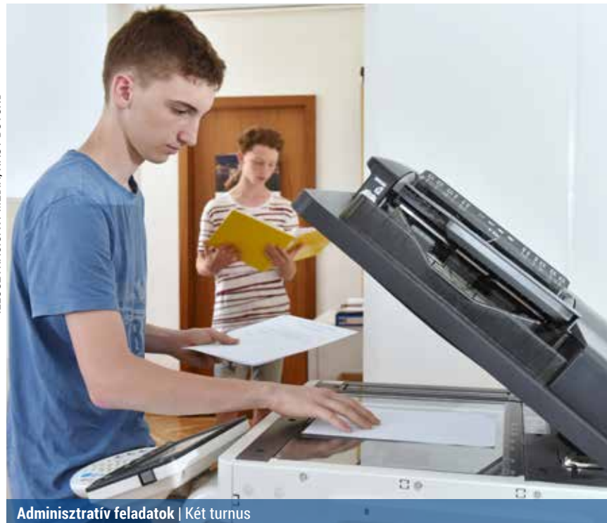
Adminisztratív feladatok | Két turnus

Az eddigi jelentkezések alapján júliusban tíz főt fogad a polgármesteri hivatal. A diákokat a hatósági főosztályon, a jegyzői irodán, a polgármesteri kabinetben, a városgazdálkodási főosztályon, valamint a humánpolitikai osztályon helyezik el.