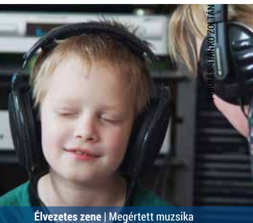
Élvezetes zene | Megértett muzsika

Van kapcsolat az emberi szokások változásában és a technikai fejlődés között? A válasz határozott igen, ezt a zenehallgatási szokások változása is szemlélteti.