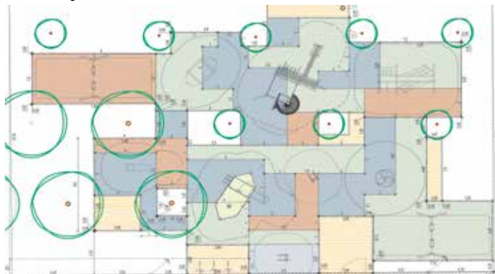
Ivókutak, napvitorlák | Barátságos játszóhelyek

Elkészültek a kerület első integrált játszótérének tervei, ahol fogyatékkal élő és egészséges gyerekek együtt játszhatnak majd. A tervek szerint nyár végén, iskolakezdésre birtokba vehetik a gyerekek az új játszóhelyet.