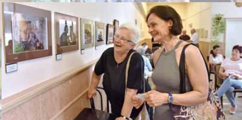
A szerelmes ember | Fotópályázat