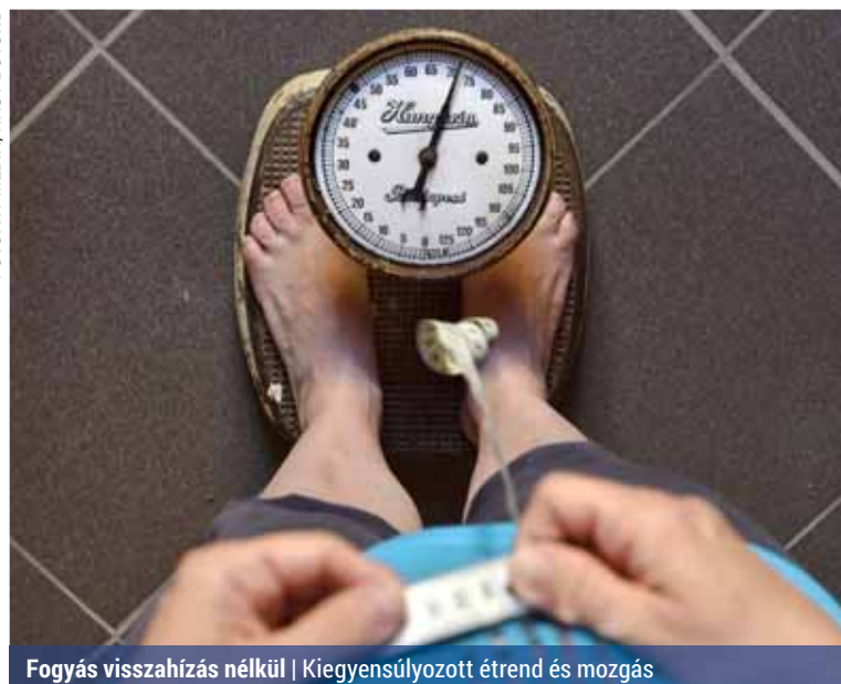
Fogyás visszahízás nélkül | Kiegyensúlyozott étrend és mozgás

Energiaszükségletünket az alapanyagcsere, valamint a fizikai és a szellemi aktivitás mértéke határozza meg. Egy 165 cm magas, normál testsúlyú ember energiaszükséglete 1800 és 2100 kalória között mozog. Aki tehát fogyni szeretne, az energiabevitelét nagyjából 1200 és 1500 kalória közé kell beállítani. Ha van 10