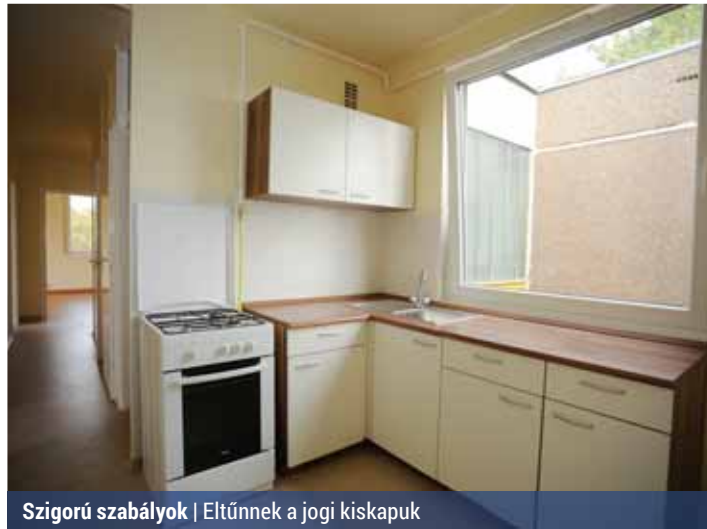
Szigorú szabályok | Eltűnnek a jogi kiskapuk

Módosítja a szerződés megkötésére, újrakötésére, a jövedelmváltozás bejelentésére és az ezen alapuló új lakbér megállapítására vonatkozó szabályokat. Pontosítja a piaci alapú lakások bérleti díjára