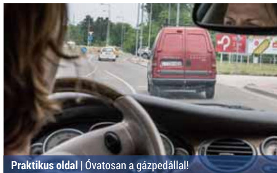
Praktikus oldal | Óvatosan a gázpedállal!