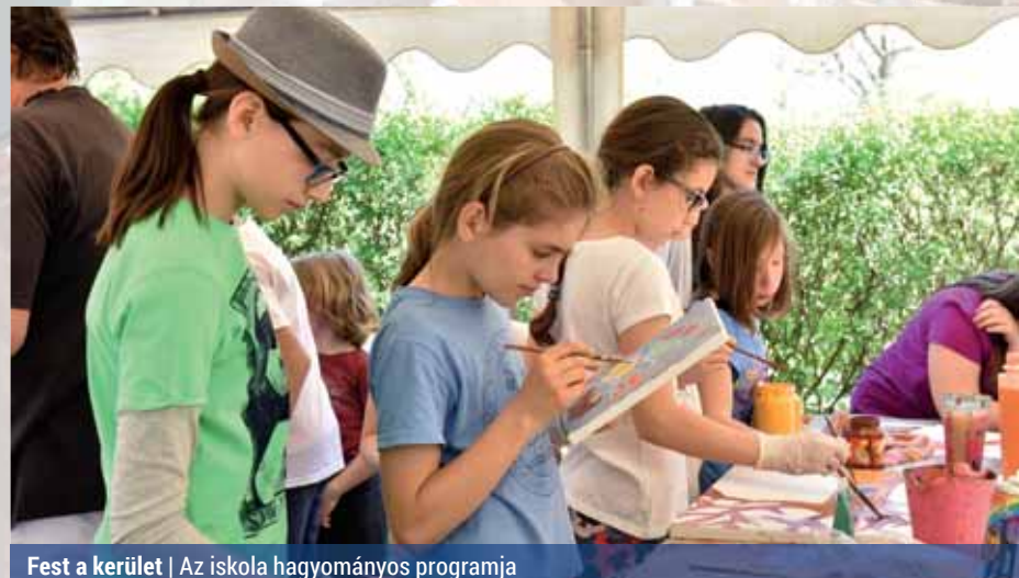
Fest a kerület | Az iskola hagyományos programja