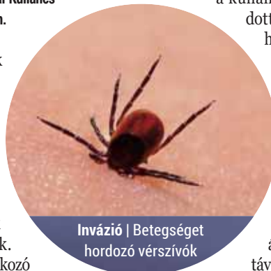
Invázió | Betegséget hordozó vérszívó