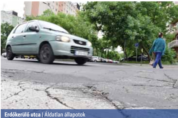
Erdőkerülő utca | Áldatlan állapotok

Kerületünk az elmúlt években számos alkalommal kezdeményezte a fővárosi kezelésben lévő Zsókvár utca és az Erdőkerülő utca felújítását a Fővárosi Önkormányzatnál. Azonban eddig mindössze annyi történt, hogy a BKK Zrt. 2014-ben tervet készítettett a rekonstrukció, a forgalomtechnikai átalakítás előkészítéseként, bár ennek az engedélyeztetése is csak idén kezdődött el.