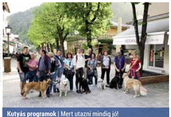
Kutyás programok | Mert utazni mindig jó!

pincsi), a gazdáik sem egyformák. Van köztük diák, nyugdíjas, a divatszakmában, az egészségügyben, a vendéglátásban dolgozó, gyerekekkel foglalkozó más autószerelő gazda is. A Palotafalka útja nagyon jól sikerült, bejárták Tirolt, túráztak a Krimml-vízesés-