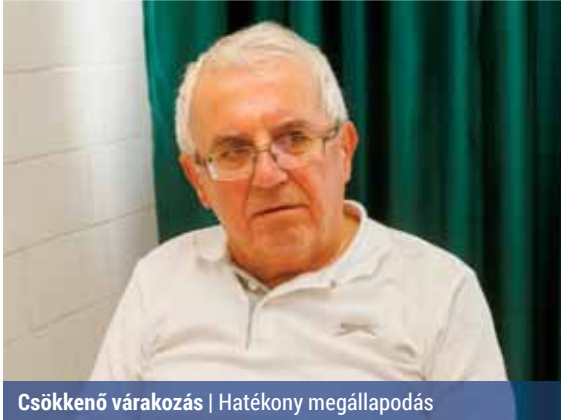
Csökkenő várakozás | Hatékony megállapodás