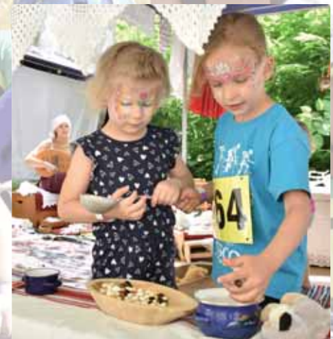
Családi nap | Változatos programok