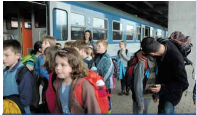
Önálló nyaralás | Megnyugtató kedvencekkel

telefonálni, és ezzel kiszakítani a gyermeket a programok kavalkádjából.