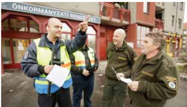
Ellenőrzött szabályok | A kutyásokra panaszkodnak

– A hozzánk beérkező jelzésekből az derült ki, hogy az állampolgárok még több egyenruhást szeretnének látni a közterületeken, ezért volt szükség erre az összefogásra – mondta a referens.