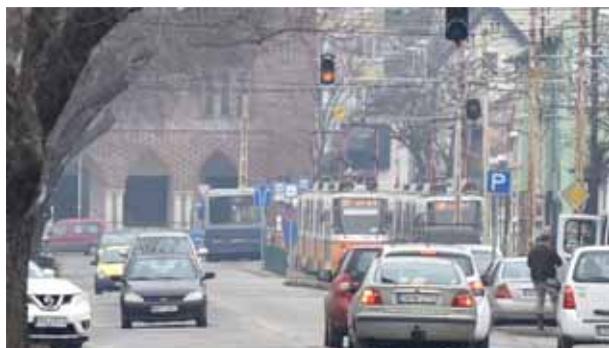
Fényszórók | Városban nem kötelező, de ajánlott!

Bár év- és napszaktól függetlenül tanácsos használni az autó világítását, a téli borús, szürke napokban még fontosabb, hogy járművünket jól lássák. Nem mindegy azonban, mikor melyik fényszórót használjuk.