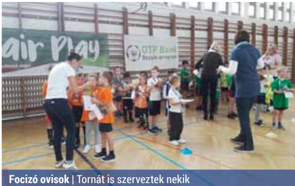
Focizó ovisok | Tornát is szerveztek nekik

A program lényege, hogy a REAC SISE évente négy