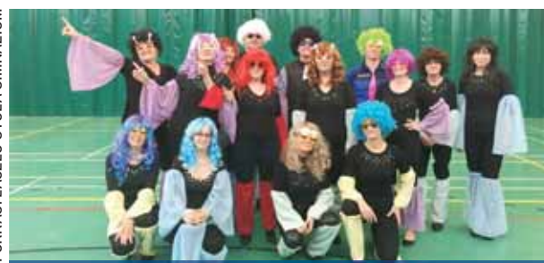
Évi három produkció | Tanári segítség

nos Angyalok és ördögök című dalára készített koreográfiát. Idén, a decemberi szalagavató bálon az ABBA és a Boney M voltak a slágerek.