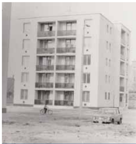
Az Énekes utcai házsor

Az objektív adatokat levéltári kutatás biztosította, a szubjektív pedig az, hogy a szerző (aki maga is itt lakott) saját és családja emlékeit is bemutatta. Hivatalosan az Énekes utcai lakótelep első ütemeként szokták emlegetni ezeket a házakat, de ez nem egységes lakótelep. Nagyjából tíz év alatt több szakaszban, három helyszínen háromféle technológiával épült. Idetartoznak a Lóvasút köz hat háza, a Kert köz hat épülete és az Énekes utca három panelja is. Minden épület négy- vagy ötszintes.