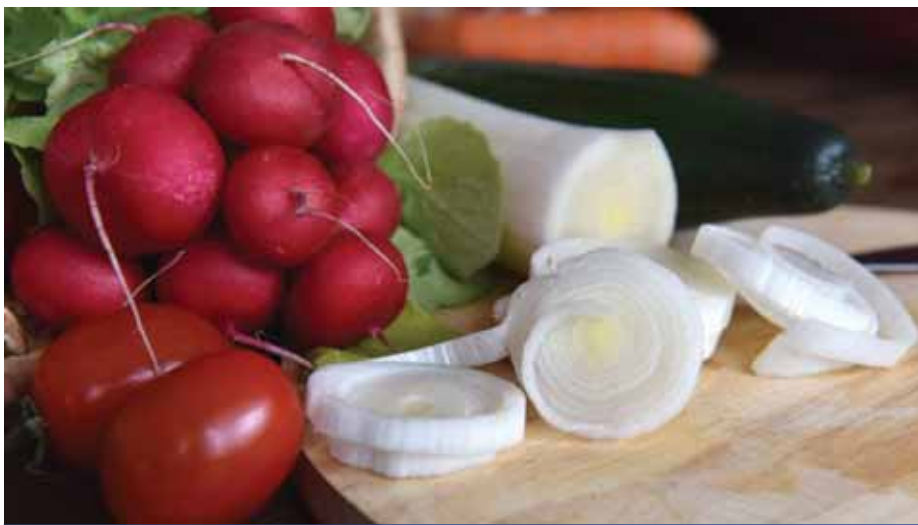
Kaja és sport | A D-vitamint pótoljuk!

– Ha kiegyensúlyozottan és változatosan táplálkozunk, valamint megfelelő mennyiségben eszünk zöldséget és gyümölcsöt, naponta legalább 500 grammnyi, a téli hónapokban sincs szükségünk multivitamin-készítményekre. Táplálékunk ké-