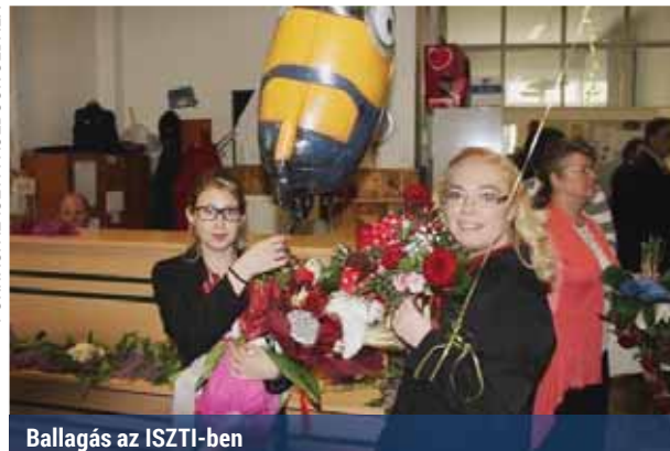
Ballagás az ISZTI-ben