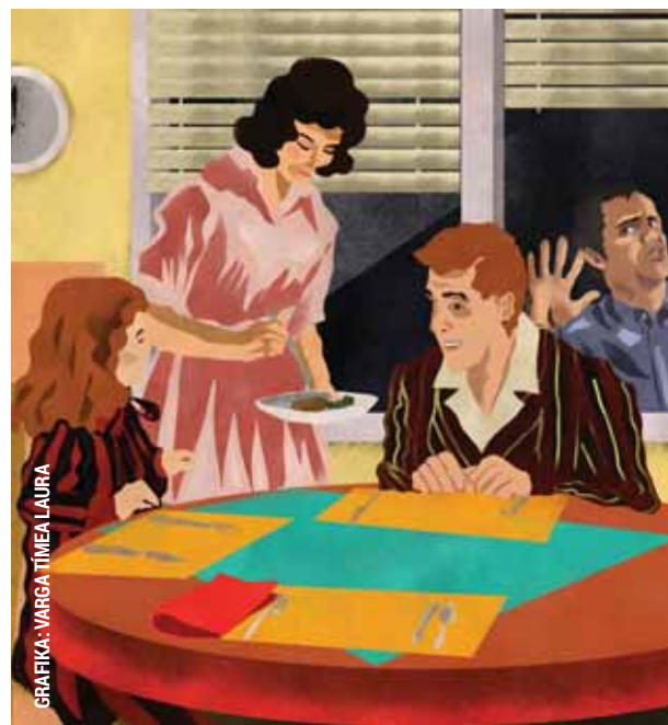
GRAFIKA: VARGA TÍMEA LAURA

A körzeti megbízottak járőrözés közben figyeltek fel egy férfira, aki több alkalommal is benézett egy társasház földszinti lakásának ablakán.