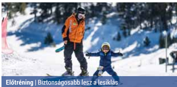
Előtréning | Biztonságosabb lesz a lesiklás

A pályán még a lesiklás előtt sem érdemes a néhány perces bemelegítést elbliccelni, ugyanis megóvhat minket az izom- és