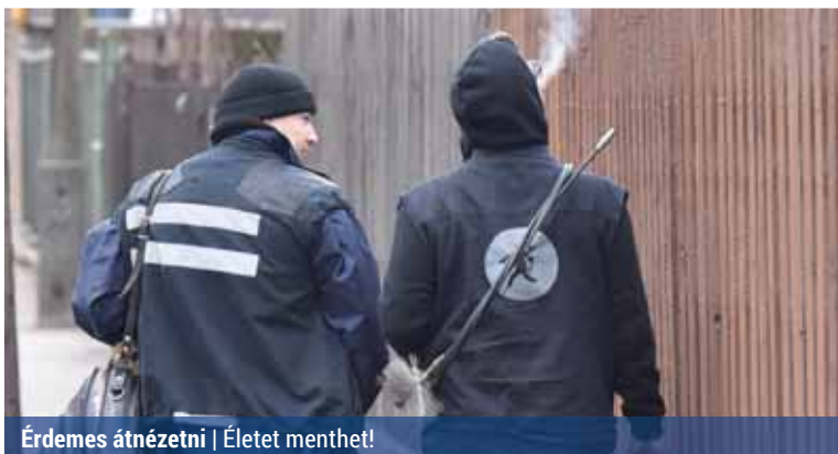
Érdeemes átnézni | Életet menthet!

A korábbi évekhez hasonlóan a Főkéktűsz továbbra is minden ingatlan-tulajdonosnak felajánl egy vagy két időpontban négyórás intervallumot, amikor kimennek ingyenes kéményellenőrzésre.