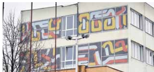
Örök festmény | Diszító kortársak

A családi történetből pedig megtudható, hogyan lehetett a hetvenes-nyolcvanas években vállalati lakáshoz jutni. Érdekes kordokumentumot jelentenek az akkori lakásárak: 1985-ben egy hétéves Kertköz utcai lakást 561 800 forintért lehetett eladni, és az Énekes utcában a legnagyobb, 74 négyzetméteres új panellakásért 919 000 forintot kértek. Ma már szinte hihetetlen, hogy az Énekes utca 1–11. szám alatti 48 lakásos társasház összértéke 39 millió forint volt 1984-ben. Cs. O.