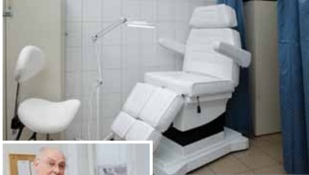
Cél az amputáció elkerülése