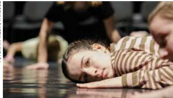
Táncos színdarab | Arany János-ballada