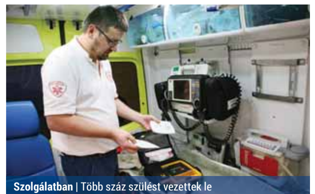
Szolgálatban | Több száz szülést vezettek le