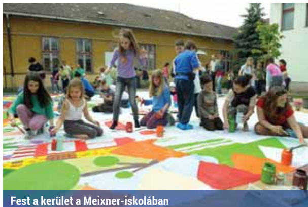
Fest a kerület a Meixner-iskolában