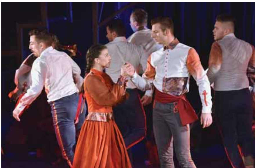
Irgalom táncjáték Arany János balladái nyomán a Fitos Dezső Társulat előadásában