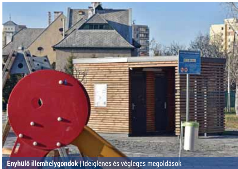
Enyhülő illemhelygondok | Ideiglenes és végleges megoldások

Ahogy arról korábban az Életképekben is beszámoltunk, az Újpalotai Vásárcsarnok és Piac területén új, 0–24 órában nyitva tartó nyilvános illemhely létesítését határozta el a képviselő-testület. Mivel az új épület kialakításához az építési szabályzatot módosítani kell – ami várhatóan hónapokat vesz igénybe –, ezért a képviselők úgy döntöttek, hogy a végleges megoldás elkészültéig ideiglenes, konténeres vizesblokkot alakítanak ki a piac területén. Ennek részeként egy utca felé nyíló konténeres WC-t helyeznek el, ami