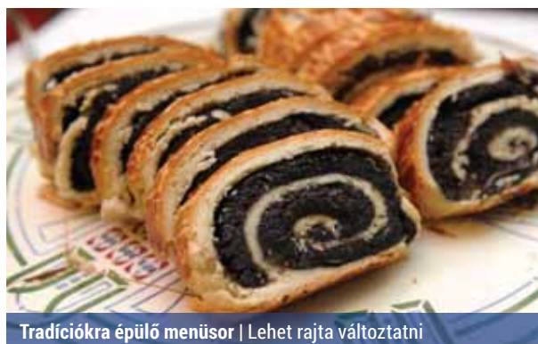
Tradíciókra épülő menüsor | Lehet rajta változtatni

Az egészséges táplálkozás irányelveit követőknek sem kell elhagyni a tradicionális karácsonyi menüt, elég, ha némileg változtatnak azon. A töltött káposzta például zöldségtartalma miatt remek választás, de kevésbé zsíros és magasabb