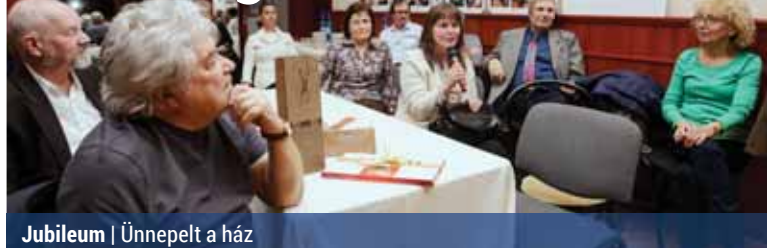
Jubileum | Ünneptelt a ház

Idén 25 éve, hogy megnyitották a Pestújhe-lyi Közösségi Házat. A november 24-i jubileumi ünnepségen nem is volt hiány anekdotákból.