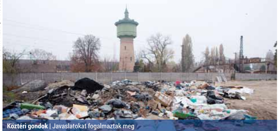
Köztéri gondok | Javaslatokat fogalmaztak meg

napelemes kandelábert telepít a közterekre.