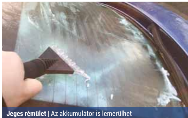
Jeges rémület | Az akkumulátor is lemerülhet