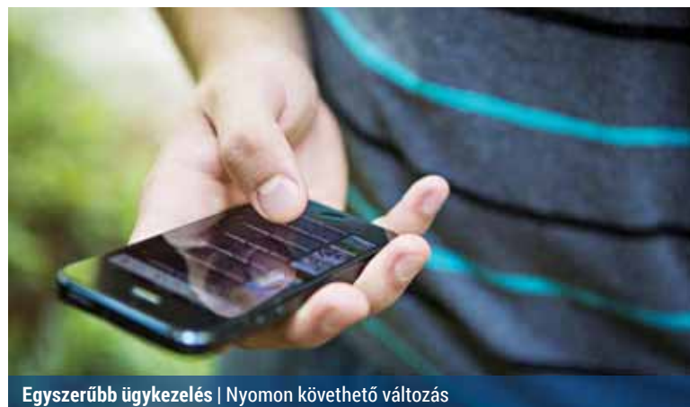
Egyszerűbb ügykezelés | Nyomon követhető változás

Az önkormányzat legújabb fejlesztése a panaszbejelentő rendszer, egy okostelefonon, tableteken használható ingyenes alkalmazás. Ennek segítségével bejelenthetők az önkormányzati fenntartású közterületeken fellelhető hibák.