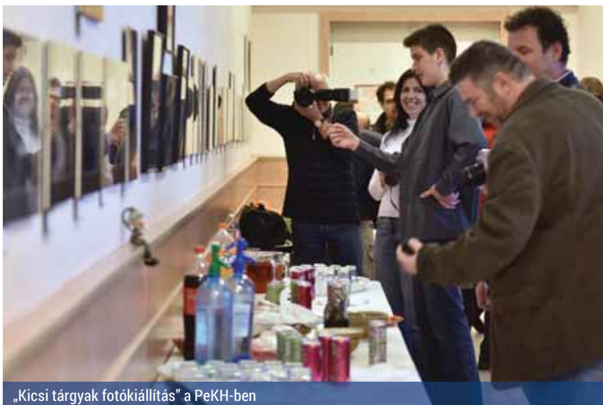
„Kicsi tárgyak fotókiállítás” a PeKH-ben