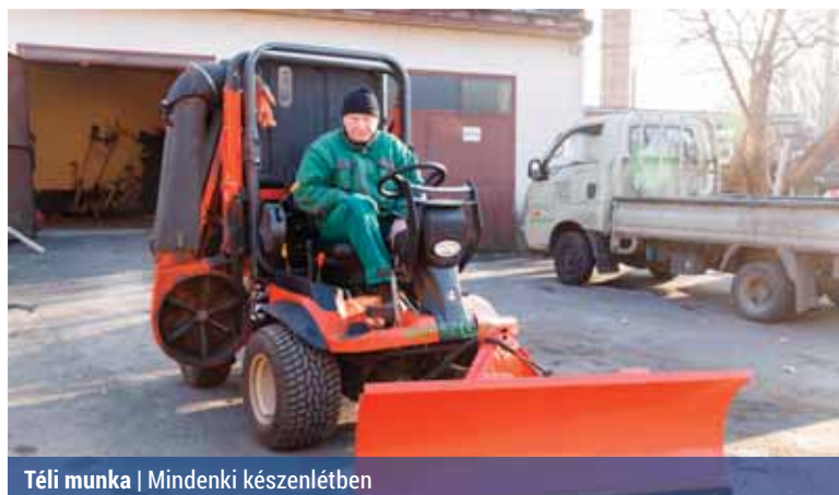
Téli munka | Mindenki készenlétben

Felkészült a téli időjárásra az önkormányzat városüzemeltető cége, a Répszolg. Mind a munkások, mind a gépek készenlétben várják, hogy ha szükséges, megtisztítsák a kerületi kezelésbe tartozó utakat, járdákat, sétányokat a hótól, jégtől.