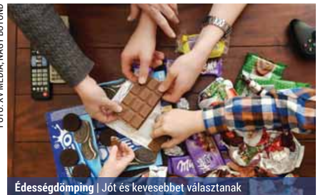
Édességdömping | Jót és kevesebbet választanak

A szaloncukrok tekintetében a zselés a legkapósabb, mellette a marcipános, az alkoholos, a rumos-diós és a csoko-