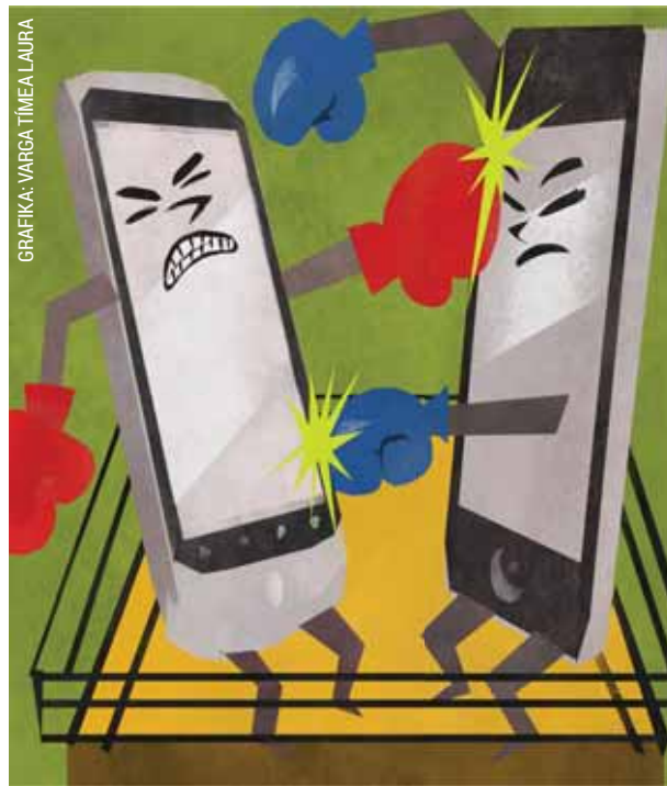
GRAFIKA: VARGA TÍMEA LAJRA

Telefonáló utashoz lépett oda egy férfi az egyik buszon, és egy másik busz iránt próbált érdeklődni.