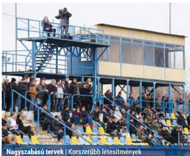
Nagyszabású tervek | Korszerűbb létesítmények

Az I. ütemben a főépület felújítása, a lelátó újraépítése és befedése valósulna meg. A tervek szerint így körülbelül ezerkilencszáz fő befogadására alkalmas korszerű, fedett