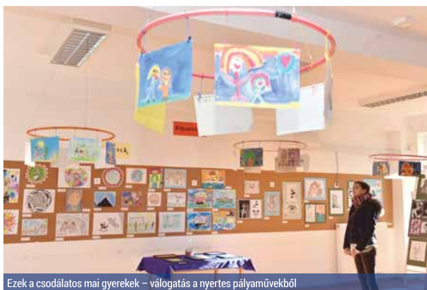
Ezek a csodálatos mai gyerekek – válogatás a nyertes pályaművekből