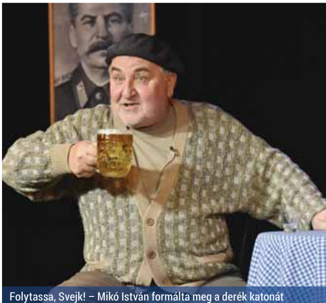
Folytassa, Svejki! – Mikó István formálta meg a derék katonát