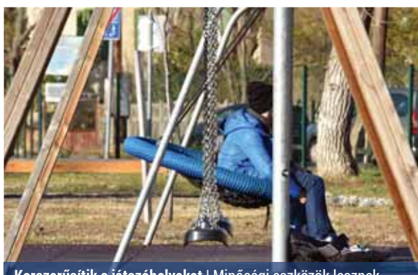
Korszerűsítik a játszóhelyeket | Minőségi eszközök lesznek

Az előterjesztésben azt határozták meg, hogy a kerületben ne legyenek elszórtan korszerűtlen, kihasználatlan játszóeszközök, hanem jó minőségű játszóterek biztosítsák a gyerekek szórakozását. Ezért a rossz állapotban lévő, elhasznált, csak gazdaságtalanul felújítható és kihasználatlan