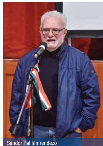
Sándor Pál filmrendező