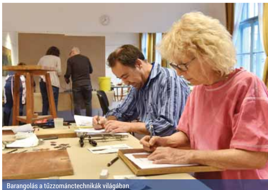
Barongolás a tűzománcteknikák világában