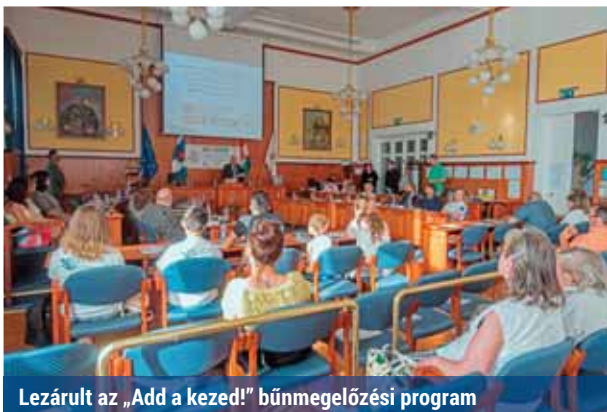
Lezárult az „Add a kezed!” bűnmegelőzési program

– A program részeként egy közvélemény-kutatást is végeztünk, amelyet akár reprezentatívnak is tekinthetünk