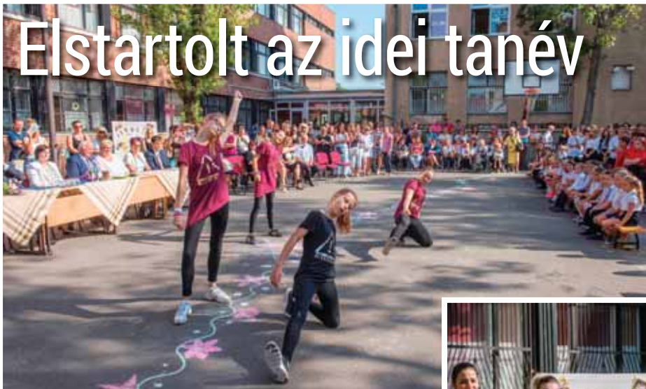
FOTÓK: XV MÉDIA, NAGY BOTOND