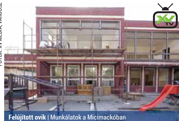
Felújított ovik | Munkálatok a Micimackóban