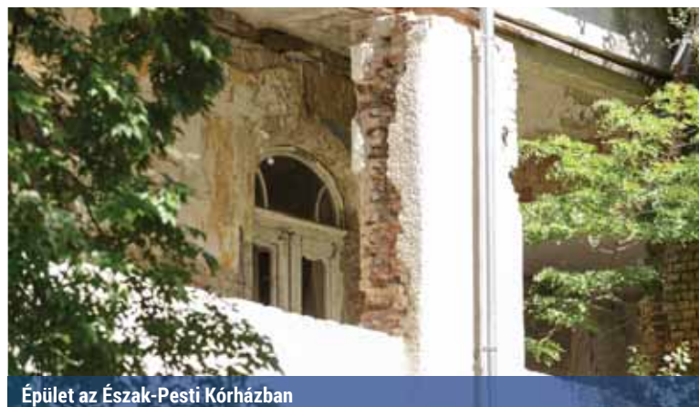
Épület az Észak-Pesti Kórházban