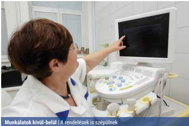
Munkálatok kívül-belül | A rendelések is szépülnek