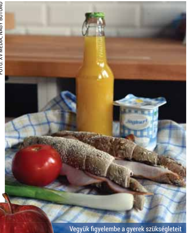
Vegyük figyelembe a gyerek szükségleteit

Éppen ezért nem mindegy, mit és mennyit esznek a kicsik. Ha a gyermek menzán ebédel, az iskolai étkezések közül csak a tízóraitól és az