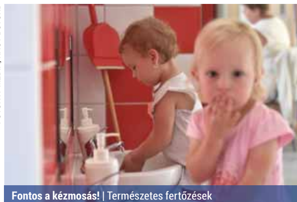
Fontos a kézmosás! | Természetes fertőzések

A szülőknek gyakran kell orvosolniuk a fejtetvésséget is, amit legkönnyebben a közösségekben szerezhet meg a gyerek. A járvány főként kicsiknél fordulhat elő, de egyre gyakoribb az iskolák felsőbb osztályai-