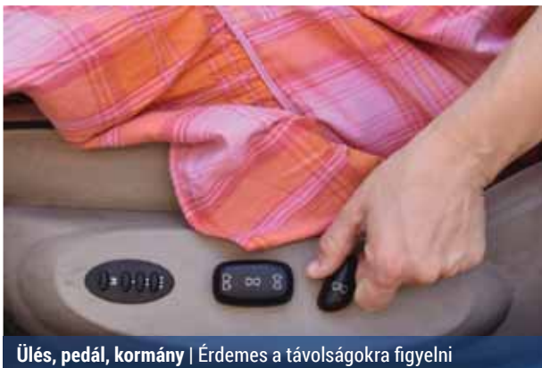
Ülés, pedál, kormány | Érdemes a távolságokra figyelni

Az ülés magasságát úgy célszerű beállítani, hogy a benyomott kuplungpedálnál a comb alsó felülete ne feszüljön hozzá, középük kényelmesen elférjen a nyitott tenyerünk. Ilyen módon szabadon áramolhat a vér a lábunkban, nem kezd zsibbadni és nehezebben fárad el.