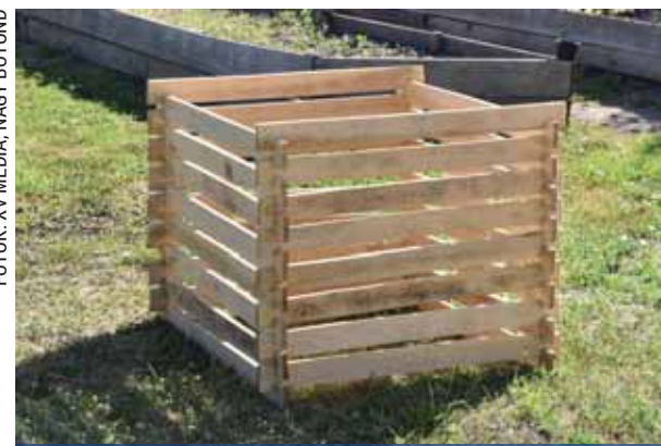
Az önkormányzat által biztosított komposztláda

Apró lépésenként tudjuk helyrehozni, amit elrontunk, a komposztálás pedig egy egyszerű és hatékony módja a talaj megújításának. A SZIKE Egyesület támogatásával kezdődött