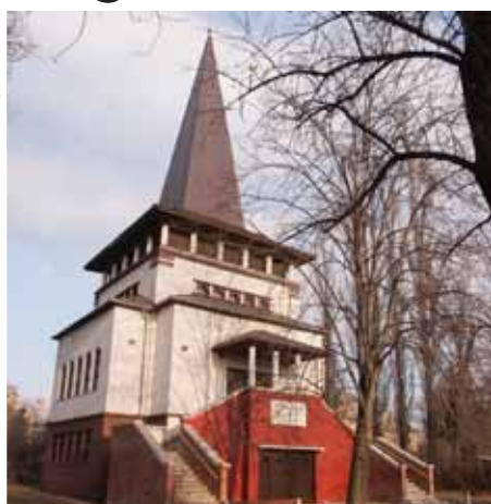
Kerületi értékek | Játékos művészet mindenkinek

gyűjteményéből kölcsönöztek a kiállításra. A Kulturális Örökség Napjai alkalmából szeptember 16-án, szombaton 10 és délután 6 óra között a kiállításhoz kapcsolódó játékokat szerveznek minden korosztálynak. A nap különlegessége még, hogy a közönség számára nem látogatható látványraktárt is megnyitják a vendégek előtt.