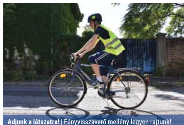
Adjunk a látszatra! | Fényvisszaverő mellény legyen rajtunk!

A megfelelő ruházat kiválasztása is fontos, hiszen az sem jó, ha túl-, de az sem,