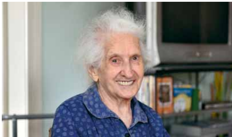
FOTÓK: XV MÉDIA, NAGY BOTOND