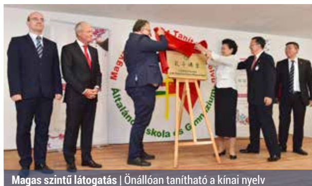
Magas szintű látogatás | Önállóan tanítható a kínai nyelv

A Magyar–Kínai Két Tannyelvű Általános Iskola életében megszokott dolog, hogy magas rangú vendéget fogadnak. A Kínai Népköztársaság ugyanis az elmúlt 13 évben folyamatosan odafigyelt az Európában is egyedülállóan számító két tannyelvű intézményre.