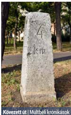
Kövezett út | Múltbéli krónikások

Már több mint három éve működik a XV. kerületi Értéktár, és a közelmúltban az Értéktár Bizottság döntése alapján új elemekkel bővült. Múltunk értékei közül most több különleges, nem szokványos elemre hívják fel a helyiek figyelmét, például a 201-es út hármas és a négyes kilométerkövére.