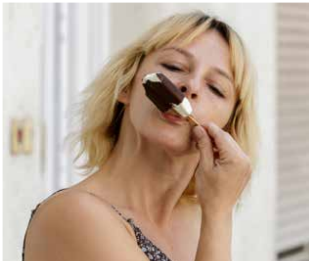
Topjégkrémek | Időjárásfüggő fogyasztás

A hazai jégkrémfogyasztás időjárásfüggő, ezért nem véletlen, hogy a melegebb nyarakon nagyobb a jégkrém iránti kereslet. A hideg nyalánságokkal érdemes otthon is kísérletezni, a vaníliával nem tudunk melléfogni.