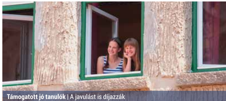
Támogatott jó tanulók | A javulást is díjazzzák

A kerületben lakó vagy tanuló diákok önkormányzati támogatásának módosításáról, új ösztöndíjrendszer bevezetéséről határozott a képviselő-testület.