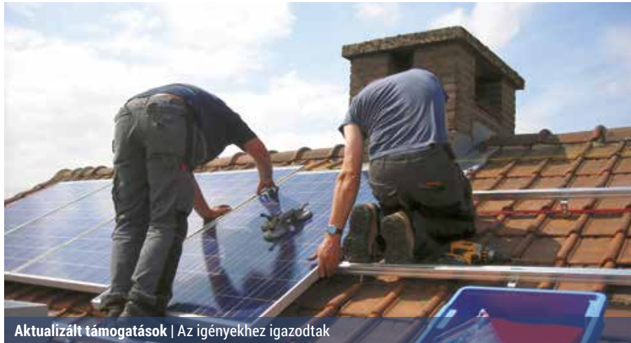
Aktualizált támogatások | Az igényekhez igazodtak

Az így nyert információk alapján a képviselő-testület módosította a helyi támogatásról és a fiatal házaspár első