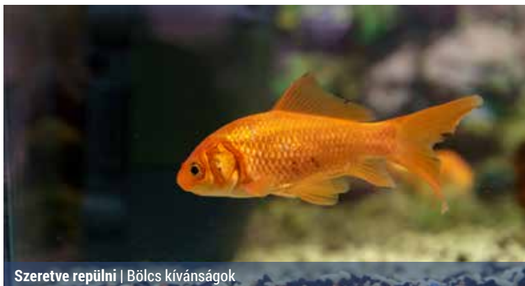
Szeretve repülni | Bölcs kívánságok

haltól, volt, aki egyenesen a világ leggazdagabb embere szeretne lenni. Volt, aki repülni szeretne, és olyan is, aki sohasem akar elfáradni, de emellett azért tudjon aludni, „csak úgy, az időtöltés végett”.