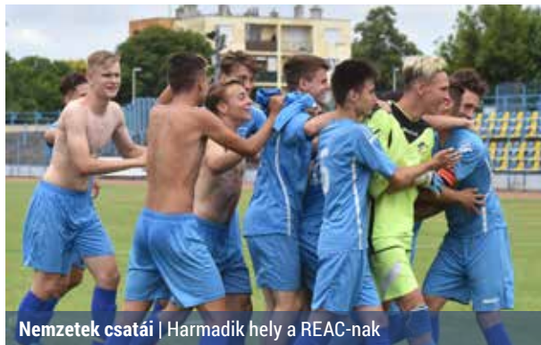
Nemzetek csatái | Harmadik hely a REAC-nak

Előtte azonban az angol akadémia 17 éves csapata látogatott Rákospalotára, a fent említett labdarúgóturnára, ahol a házigazdákon kívül a St. Pölten Akadémia, az UTE, a Mezőkövesd és a Kecskemét növendékeivel találkozhattak. A kétnapos U17-es torna csúcspontja a június 18-i helyosztók voltak, amire kötele-