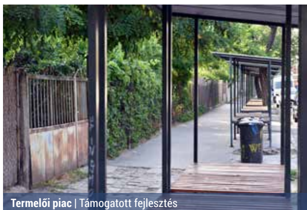
Termelői piac | Támogatott fejlesztés

A kerületi képviselőknek arról kellett döntenie, hogy a megítélt pályázati forrás ismeretében milyen mértékű fejlesztést valósítsanak meg.