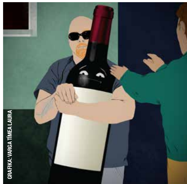
GRAFIKA: VARGA TÍMEA LAURA

Egy férfi üldögélt a Csobogós utcai lakótelepen, amikor odalépett hozzá két ismerőse, és váratlanul ütni, rugdosni kezdték őt. Majd ezt követően elvették a pénzt és a nála levő üveg bort is. A sértett fel-