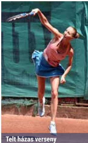
Telt házú verseny

A versenyek célja a sport és az egészségmegőrzés, ezért