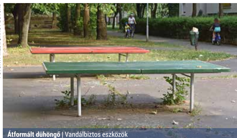
Átformált dühöngő | Vandálbiztos eszközök

Egy új beruházásról is beszámolt az ügyvezető. A Kossuth-lakótelep Csobogós utca felőli részén épül meg heteken belül egy fitnesspark. A meglévő zöldfelület 10x15 méteres terü-