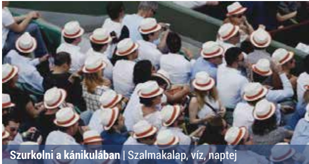
Szurkolni a kánikulában | Szalmakalap, víz, naptej

Hamarosan itt a vizes világbajnokság, majd a Forma-1. Mindkét sporteseményen jó esélyünk van arra, hogy órákon át a tűző napon, kánikulában izguljunk kedvenceinkért. Őszgyűjtöttünk néhány tippet, amelyekkel elkerülhetjük a napszúrást vagy a hőgutát.