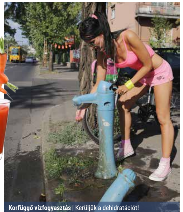
Korfüggő vízfogyasztás | Kerüljük a dehidratációt!

Az emberek szerint a kiegyensúlyozott étrendbe az italok közül leginkább a 100 százalékos gyümölcslevek és a szénsavmentes ásványvizek illenek, a szénsavas vizet pedig a cukormentes tea,