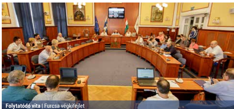
Folytatódó vita | Furcsa végkifejlet