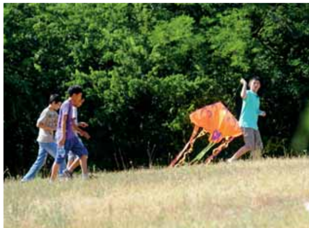
Önállóság fokmérője | Ne erőltessük, ha nem akar menni!