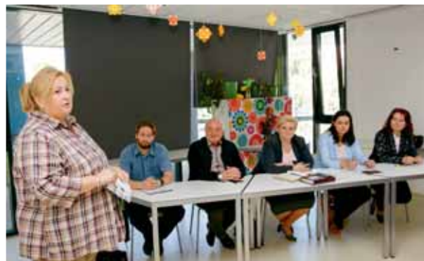
Kézzelfogható segítség | Mindenre van megoldásuk

A meghívott előadók alaposan körbejárták a témát, a jogi szabályozástól a támogatási lehetőségektől, a probléma kialakulásától annak lehetséges megoldásáig sokféle adat és tény hangzott el. Mindenképpen érezhető volt, hogy az ember áll az adósságkezelés középpontjában. Nemcsak a pénzügyi tudatosság megtanításával és a sokszor bonyolult ügyintézésben segítésével az itt dolgozók, hanem tudják, hogy milyen lelki nyomás nehezedik ebben az élethelyzetben az adósról.