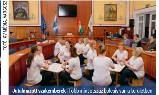
Jutalmazott szakemberek | Több mint ötszáz bölcsis van a kerületben

Hazánkban az első bölcsődét 165 évvel ezelőtt, április 21-én nyitották meg, így ennek tiszteletére 2010-ben hivatalosan is a bölcsődék napjává nyilvánították ezt a napot. Négy éve április 21-e nevelés és gondozás nélküli nap a bölcsődei dolgozóknak.