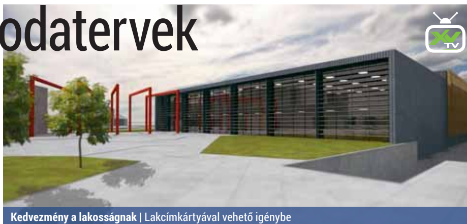
Kedvezmény a lakosságnak | Lakcímkártyával vehető igénybe

Az új tervek alapján az uszodában egy 33×25 méteres versenymedence, egy 25×21 méteres kültéri medence (ami télen sátorral lefedhető) és egy 7×14 méteres tanmeden-