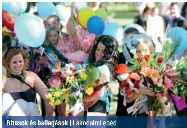
Rítusok és ballagások | Lakodalmi ebéd

Már csak néhány napig kell iskolába járniuk a végzős gimnazistáknak és szakgimnazistáknak, az érettségi előtt pár nappal mindenhol megtartják a ballagási ünnepségeket. A legtöbb középiskolában május 5-én, pénteken búcsúznak el tanáraiktól és diák társaiktól a végzős tanulók, ám sok intézmény május 6-ra, szombatra szervezi az ünnepséget.