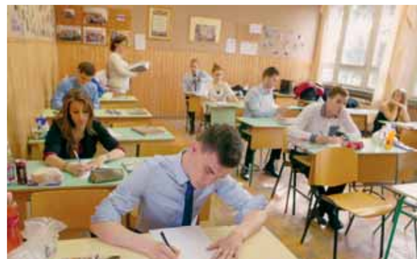
Év végi nagy hajrá | Kezdetét veszi a pontszámolgatás

A középiskolákban – valamint a 20 fővárosi és a megyei kormányhivatal szervezésében – 1170 vizsgahelyszínen szervezik meg az érettségiket május 5. és június 30. között. Az érettségizők közül mintegy hetvenháromezer végzős középiskolás az, aki várhatóan ebben a vizsgaidőszakban tesz le rendes érettségét, azaz szerezhethet érettségi bizonyítványt. Rajtuk kívül még az érettségi rendszer által nyújtott lehetőségekkel élve mintegy harmincötezen