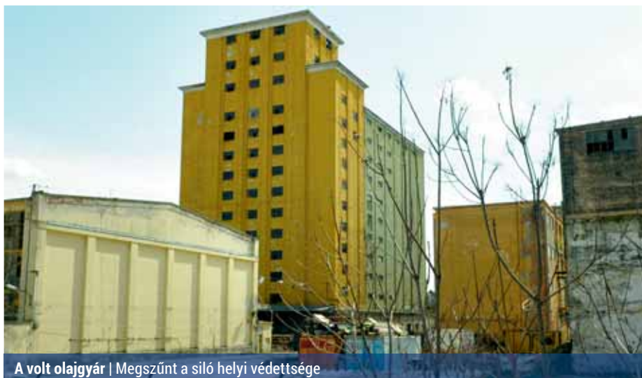
A volt olajgyár | Megszűnt a siló helyi védettsége

Az előző testületi ülésen elfogadott, a Drégelyvár utca – Molnár Viktor utca Városkapu környezetének átfogó rendezéséről szóló határozatokat visszavonták, mivel erre a célra már korábban ötmillió forintot szavazott meg idénre a testület. Arról is döntöttek, hogy a terület