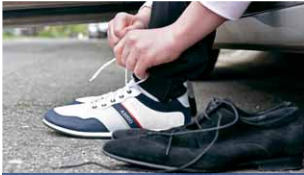
Kreatív megoldások | Sportos bevásárlás

túlórak, pluszfoglaltságok lesznek az életünkben, amik valóban beszűkítik edzési lehetőségeinket. Ha meg tudjuk oldani, keljünk fel a szokásosnál egy órával korábban, és tudjuk le a testmozgást alvásidőben.