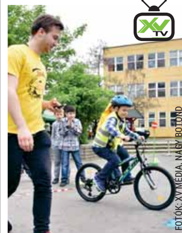
Figyelemfelhívás | Játékok és bemutatók

Nagy fába vágta a fejszéjét az önkormányzat, amikor az „Add a kezed!” projektjével pályázott a Nemzeti Bűnmegelőzési Tanácsnál. A benyújtott tervüket ugyanis jónak találták és 6,5 millió forinttal támogatták, amit az önkormányzat még 1,5 millió forinttal egészített ki. Egyetlen kritériuma volt a támogatásnak, hogy a tervben szereplő elképzelések mindegyike valósuljon meg. Márpedig a tervben nagyon sok ötlet és programterv szerepelt.