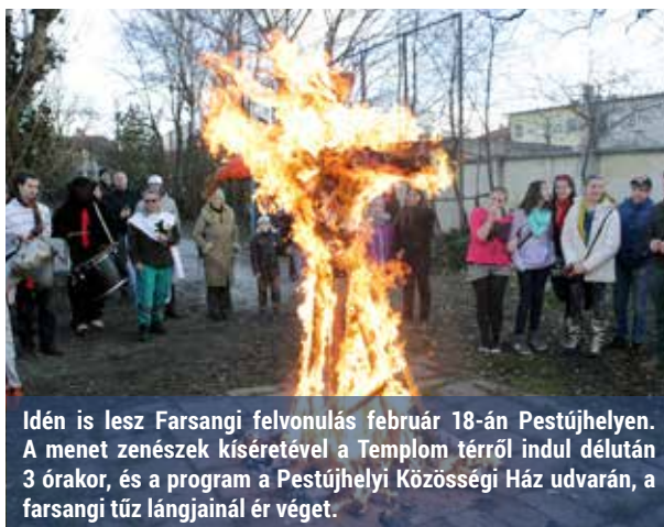
Idén is lesz Farsangi felvonulás február 18-án Pestújhelyen. A menet zenészek kíséretével a Templom térről indul délután 3 órakor, és a program a Pestújhelyi Közösségi Ház udvarán, a farsangi tűz lángjainál ér véget.

A régi báli elegancia nyomai pedig a velencei karneválon tűnnek fel, ami sok-sok részletet megőrzött a múltból. A lagúnák városában idén február 14-e és 28-a között tart a karnevál, csúcspontja pedig az utolsó napon van, amikor a mulatozók elbúcsúznak a Karnevál Hercegetől. Ahogy az első nap mindent odaadtak neki, így heteken keresztül tobzódtatott, a végén mindent – még az életét is – elveszik tőle azért, hogy elűzzék a tél rossz szellemét, és hogy valójában véget érjen a mulatozás – olvashatjuk a Wikipédián . -y -a