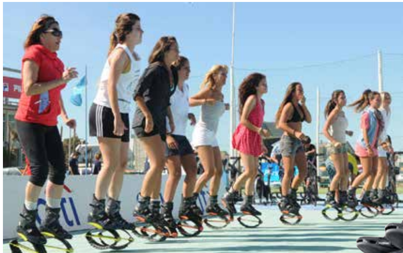
Segít a fogyásban | Hatékony mozgásforma

Nem annyira új keletű, ám a mai napig népszerű a kangoo jumps, azaz egy speciális, rugós cipőben, zenére végzett mozgásforma. Töretlen sikere nem véletlen, hiszen kíméli az ízületeket, látványosan formálja az alakot és még jó kedvet is csinál.