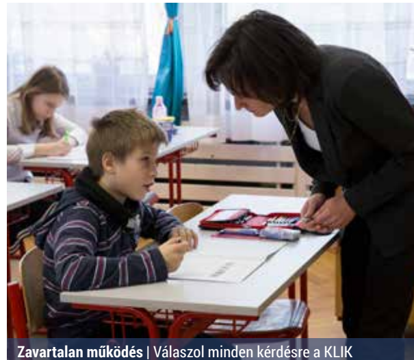
Zavartalan működés | Válaszol minden kérdésre a KLIK

Megtudtuk, hogy a családoknak elsősorban úgy kívánunk segítséget nyújtani, hogy biztosítják a megfelelő feltételeket az intézmények zavartalan működéséhez, valamint a tanuláshoz és munkához. A titkárság a +36 1 795 8181-es telefonszámon érhető el, ahol a felvetett kérdésnek megfelelően szakemberekhez irányítják az érdeklődőket.