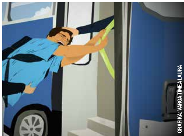
GRÁFIKA: VARGA TÍMEA LAURA

Az újpalotai buszvégállomáson egy utas nem volt hajlandó elhagyni a járművet a sofőr többszöri felszólítása ellenére sem. A férfi előbb meglökte, majd megütötte a vezetőt, illetve egy üres pezsgősüveggel megpró-