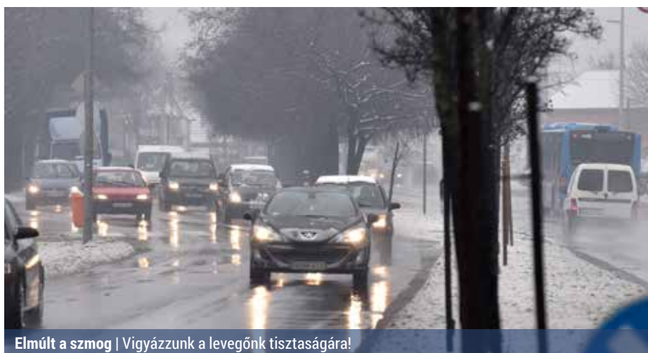
Elmúlt a szmog | Vigyázzunk a levegőnk tisztaságára!

Szemkőnyvezés, orrfolyás, torokkaparás, köhögés, tüszőszentés, ezek azok a jelek, amikből arra következtethetünk, hogy szervezetünket