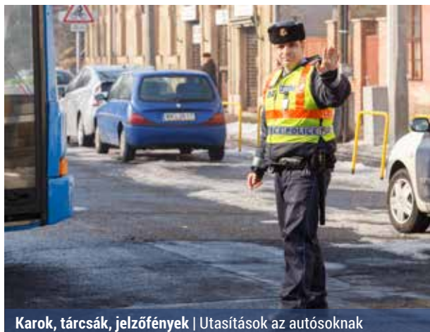
Karok, tárcsák, jelzőfények | Utasítások az autósoknak

Bár a rendőri irányítás nem mindnapos egy kereszteződésben, érdemes tisztában lenni a jelzésekkel, hiszen bármikor előfordulhat olyan helyzet, amikor tudnunk kell értelmeznünk azokat.