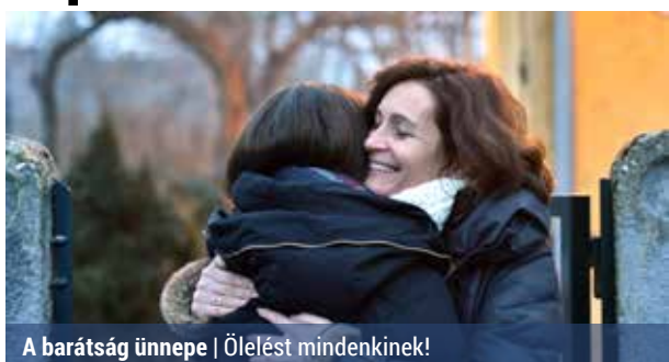
A barátság ünnepe | Ölelést mindenkinek!

Hogy miért? Ehhez ismerni kell az ünnep, illetve az ehhez fűződő legenda történetét. Szent Bálint az ókori Rómában volt pap, és titokban esketett katonákat, ezért Claudius császár ki akarta végeztetni. A fogságban visszaadta a börtön-