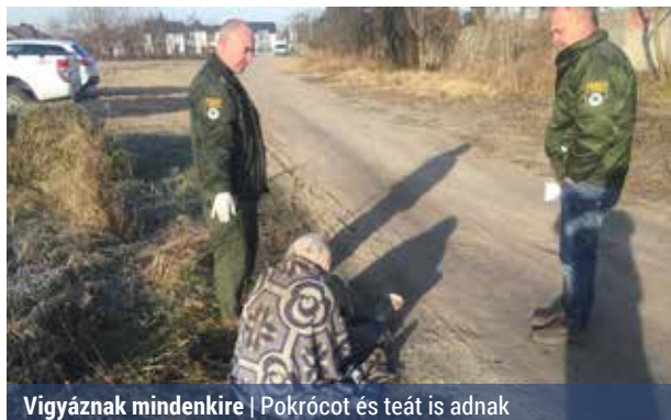
Vigyáznak mindenkire | Pokrócot és teát is adnak

Minden télen probléma a falopás, ám az állandó jelenlétünk miatt az esetek száma