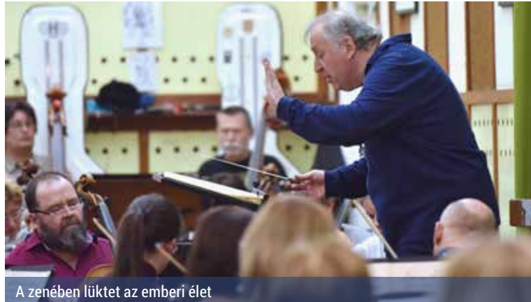
A zenében lüktet az emberi élet

– A francia kultúra és zeneművészet terjesztéséért a Művészetek és Irodalom Lovagja lett. Mit jelent önnek ez a kitüntetés?