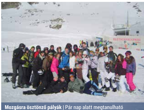
Mozgásra ösztönző pályák | Pár nap alatt megtanulható

– A sítábornak számos előnye van. Egyrészt kiszakítja a gyereket a megszokott közegéből és segít neki feltöltődni, továbbá ilyenkor a pedagógusok is lehetőséget kapnak, hogy jobban megismerjék a növendékeiket. Ki mit enged meg magának, mennyire kitartó, milyen a komfortérzete, mennyire tanulékony, illetve a közösségi szerepéről is pontosabb képet lehet kapni. A tapasztalatokat aztán a napi munkában is hasznosítani lehet – mondta a tanár.