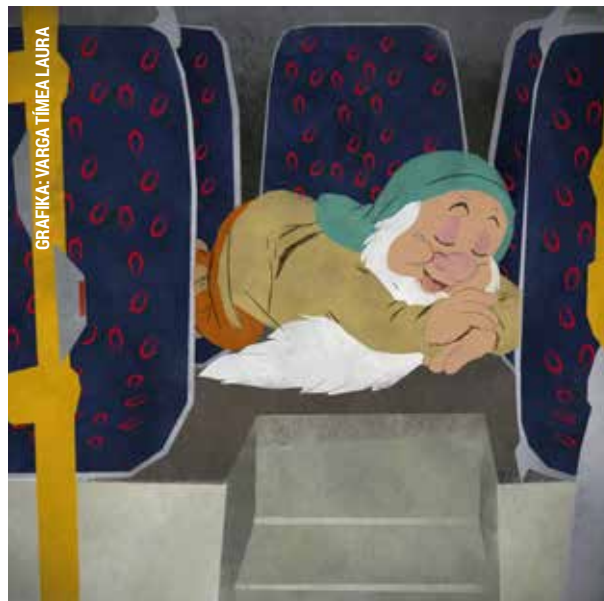
GRAFIKA: VARGA Tímea LAURA

Egy alvó férfit felébresztett egy buszsofőr a végállomáson. Arra is felszólította, hogy szálljon le, aminek a férfi eleget is tett, ám leszállva előbb dühöngeni kezdett, majd bele-rúgott a busz oldalába, illetve