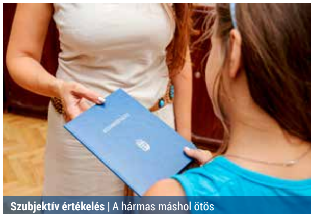
Szubjektív értékelés | A hármas másol ötös

Az iskolások az évvázrón megkapják a bizonyítványukat, és a sok büszke szülő azonnal feltölti a közösségi oldalakra a fényképet a jeles eredményről. Mások inkább elterelik a szót, ha a gyerek érdemjegyei kerülnek szóba, és akár komplett összeesküvés-elméleteket szőnek arról, hogy miért nem lett kitűnő a csemete.