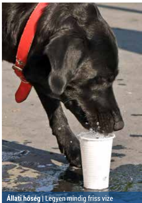
Állati hőség | Legyen mindig friss vize