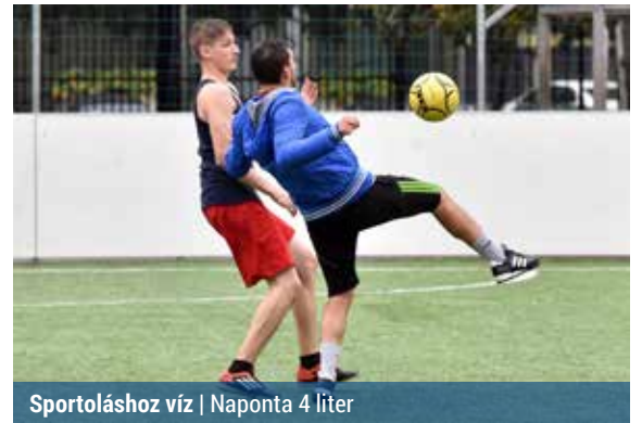
Sportoláshoz víz | Naponta 4 liter

A rendszeresen sportolókat a nagy meleg sem tarthatja vissza az edzéstől, hiszen a kihagyás visszaesést okozhat vagy bekavarhat a felkészülésbe. Hőségben azonban különösen oda kell figyelniük testünk jelzéseire, illetve néhány alapszabályt be kell tartanunk ahhoz, hogy elkerüljük a rosszullétet.