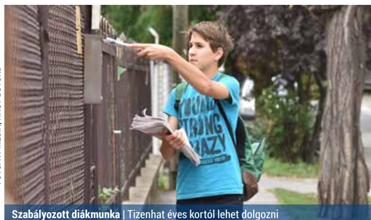
Szabályozott diákmunka | Tizenhat éves kortól lehet dolgozni

A munkavégzés korlátai között pedig kiemelték, hogy a fiatal éjszakai munkára, rendkívüli munkavégzésre, ügyeletre és készenlétre nem kötelezhető. Továbbá