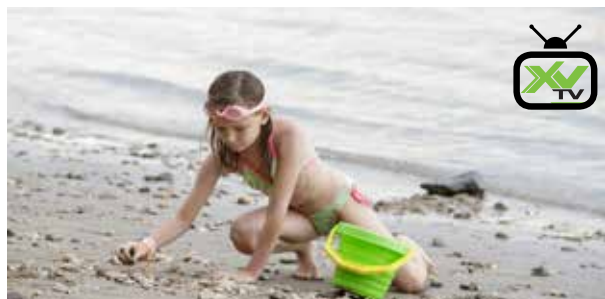
Gyorsan változó vizek | Egyedül ne mártózzunk a folyóban!

A forráságban sokan mennek ki a Dunaparra, nyílt víz közelébe. Azonban többen életüket veszítik a hazai folyókban, tavakban, mert nem tartják be a fürdőzésre vonatkozó szabályokat. Hogy a nyári szabadság ne végződjön tragédiával, érdemes megfogadni a Dunai Vízrendészeti Rendőrkapitányság tanácsait.