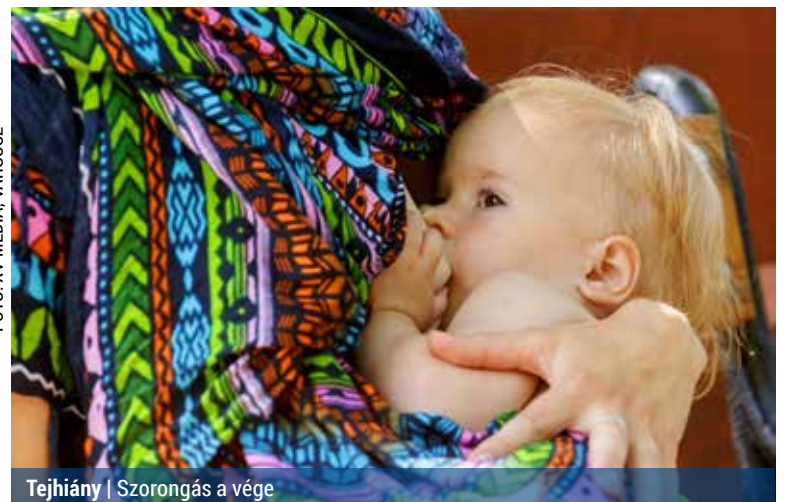
Tejhiány | Szorongás a vége

Nos, az a rossz hírem van, hogy nem. Van, aki hiába akar és vet be minden praktikát, semmi. Pontosabban 20-30, maximum 40 milli alkalmanként, ami már egy pár naposnak sem elég semmire. Miután pedig nem akarja, hogy szeme fénye éhen haljon, a tápszerhez nyúl. A netről kapott in-