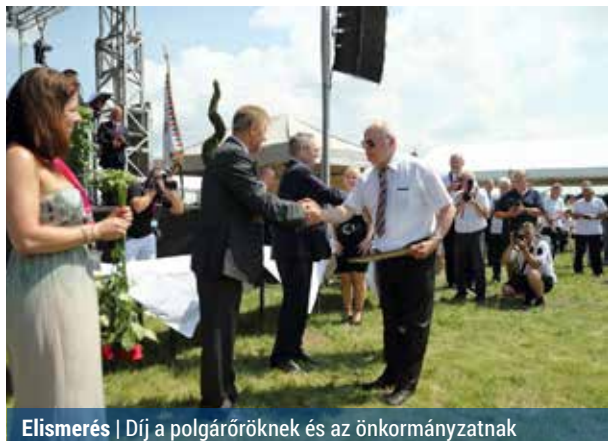
Elismerés | Díj a polgárőröknek és az önkormányzatnak

A nyíregyházi repülőtéren megrendezett országos polgárőrnapi ismét több ezren voltak kíváncsiak. Az eseményen a XV. kerület komoly elismerésben részesült.