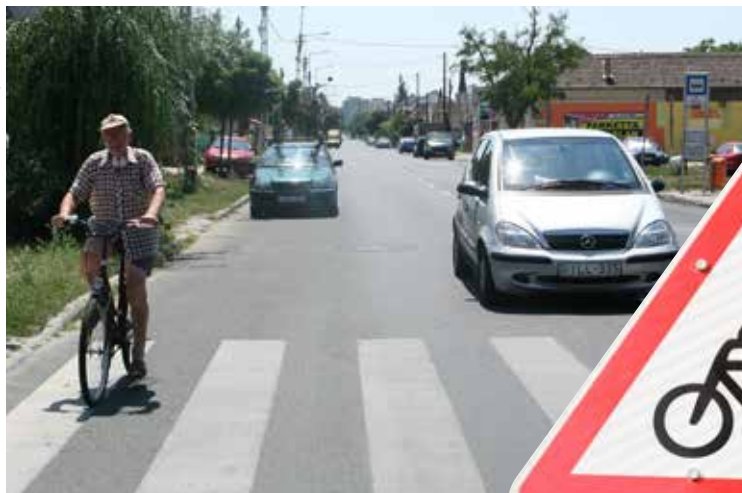
Áthelyezett hangsúlyok | Cél a belváros

Az eredeti elképzelések szerint a pályázat keretében a Külső Főti út mentén egyoldali, kétirányú kerékpárút épült volna a Szilas-patak és a városhatár között, de cél volt az is, hogy Budapest centruma felé a XIV. kerület irányába, a meglévő, vegyes használatú utakon is biztonságosan lehessen kerékpárral közlekedni. A kerékpárút