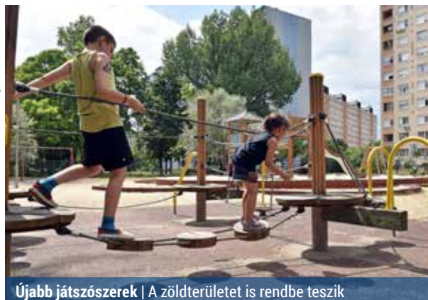
Újabb játszószerkek | A zöldterületet is rendbe teszik

Teljesen felújítja, átépíti a Répszolg az Erdőkerülő utcai játszótér.