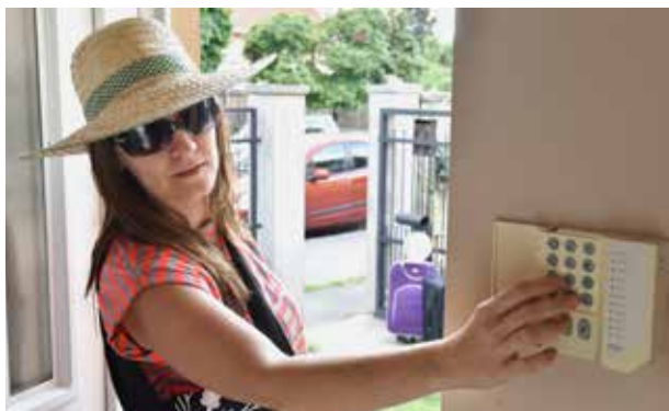
Riasztó a lakásban | Legyünk körültekintőek!

az épületen belül van a betörő, akkor rögtön jelezzen a riasztó. A belső védelmet biztosíthatjuk például ablakráccsal, több ajtózárral, széf beépítésével vagy elektronikai rendszerrel. Szakértők szerint egy jól kivitelezett, kamerás rendszer kiépítése már azért is megéri, mert a bűnözők a külső szemrevételezés után meg sem próbálnak bemenni.