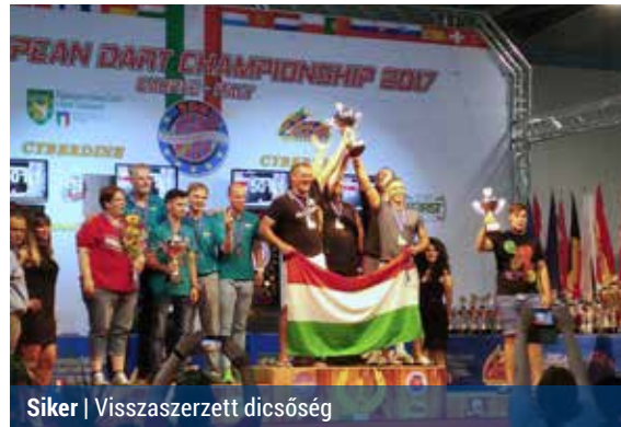
Siker | Visszaszerzett dicsőség

Nemrég rendezték az olaszországi üdülőhelyen, Caorléban a klubcsapatok soft darts Európa-bajnokságát. Az eseményen a magyar színeket többek között a bajnoki címvédő, illetve az idei kiírásban a rájátszásba ismét bejutó Pestújhely Sport Club képviselte.