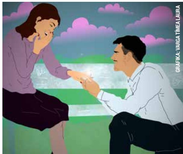
GRAFIKA: VARGA TÍMEA LAURA

Egy férfi udvarolni kezdett egy nőnek, és így férközött a bizalmába. A hölgy kezéről valamilyen ürüggyel leügyeskedte a gyűrűt, majd a nyakláncát letépvé elfutott a helyszínről. A rendőrség a szeméyleírás alapján azonosított egy férfit, aki megpróbált