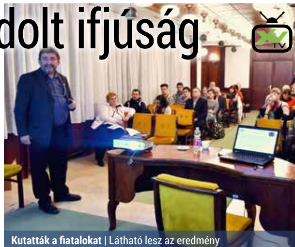
Kutatták a fiatalokat | Látható lesz az eredmény

A helyi képviselő-testület által korábban elfogadott Gyermekek és Ifjúsági Koncepciót felrészítették, amit megelőzött egy kutatás a kerületben 2016. május 1. és október 31. között. A felmérés célja az volt, hogy megvizsgálja, hogyan viszonyulnak a városrészekben élő, illetve az itt tanuló fiatalok a kerületi ifjúsági munkához. Többek között erről is szó volt december 7-én az Ifjúsági Kerekasztal megbeszélésén.