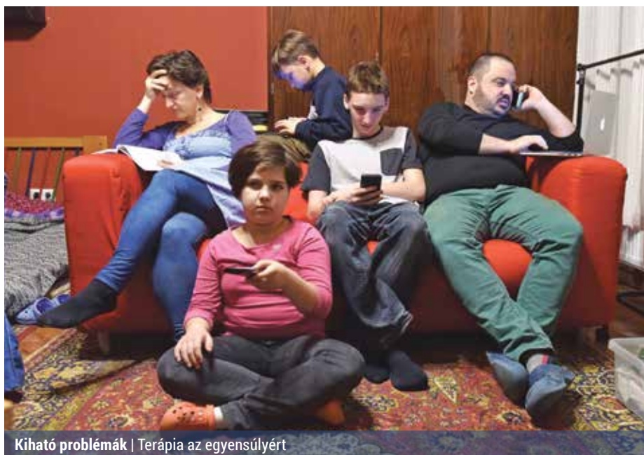
Kiható problémák | Terápia az egyensúlyért