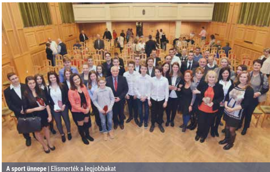
A sport ünnepe | Elismerték a legjobbakat

Elsősorban azért, mert ekkor a teljesítményt és munkát jutalmazzák, és a sportolók mellett az edzők és a pedagógusok szakmai munkáját is elismerik. Az idei ünnepen huszonegy fiatal sportoló vehette át a „Kerület Kiváló Sportolója” elismerést. A díjazottak az országos és nemzetközi versenyeken, illetve a világversenyeken produkáltak kimagasló eredményeket. Majd a „Kiváló testnevelő tanár”-díjakat osztották ki idén