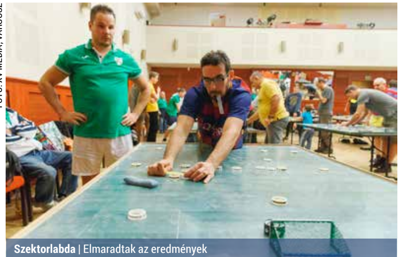
Szektorlabda | Elmaradtak az eredmények