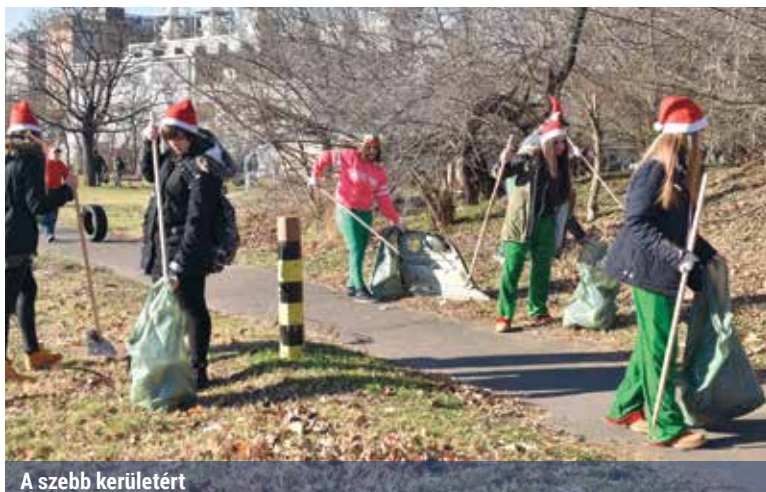
A szebb kerületért