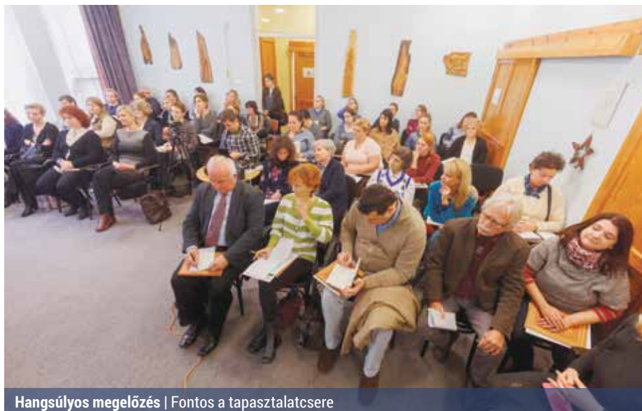
Hangsúlyos megelőzés | Fontos a tapasztalatcsere

A gyermeklélektani kutatók sokszor bizonyították, hogy az emberi fejlődés üteme az élet első éveiben a leggyorsabb. Ez az időszak különösen fontos azoknak a gyermekeknek, akik valamilyen ok miatt az átlagostól eltérő módon és ütemben fejlődnek. Ha ezt a legfogékonyabb időszakot nem használjuk ki, a gyermek sokkal nehezebben fog bizonyos képességeket megszerezni a későbbi időszakban, és esetleg soha nem jut el arra