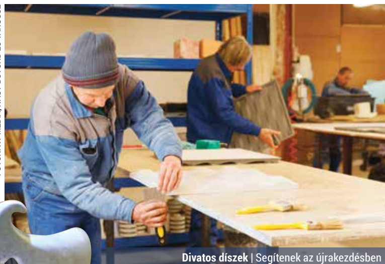
Divatos díszek | Segítenek az újrakezdésben