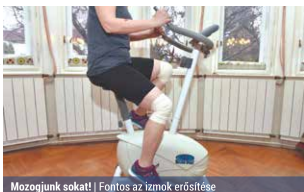
Mozogjunk sokat! | Fontos az izmok erősítése

Az egyik gyakoribb térdprobléma, az osteoarthritis, ami lényegében egy gyulladással megbetegedés. A pihenés helyett ilyen esetben érdemes a testmozgást választani, mivel a térd köré felépülő izmok lassítják az ízületek romlását. – Természetesen térdprobléma esetén először az orvossal konzultáljunk, hallgassuk meg, mit javasol. Sokszor ugyanis először a gyógytorna a jó megoldás, és csak azu-