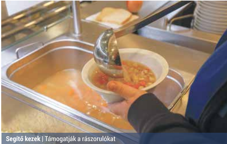
Segítő kezek | Támogatják a rászorulókat