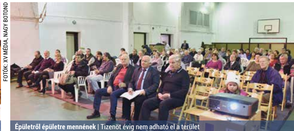
Épületről épületre mennének | Tizenöt évig nem adható el a terület