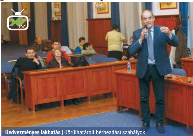
Kedvezményes lakhatás | Körülhatárolt bérbeadási szabályok

A XV. kerületben található több mint 37 ezer lakásból körülbelül 2100 önkormányzati tulajdonú. Ebből mintegy 1820 lakást már bérbé vettek. Ezek közül 1300 összkomfortos, 344 komfortos, 183 pedig fél- vagy komfort nélküli. A legmagasabb lakbér a