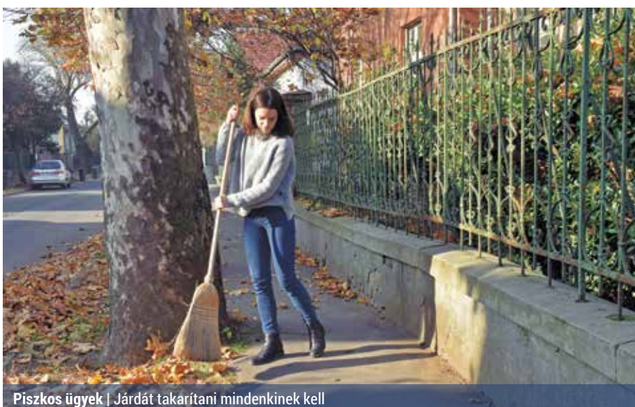
Piszkos ügyek | Járdát takarítani mindenkinek kell

A kötelezettségnek azonban nem mindenki tesz eleget, pedig az avart, a szemetet vagy havat a tulajdonosnak el kell takarítania az ingatlanja előtti járdaszakaszról, vagy gondos-