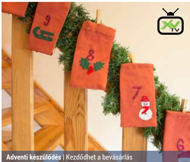
Adventi készülődés | Kezdődhet a bevásárlás

Az adventi időszak a karácsonyt megelőző 4. vasárnaptól – idén november 27-étől december 25-éig tart. Az advent szó jelentése: eljövétel, a négyhetes időszak pedig a Jézus születésére való várakozás időszaka.