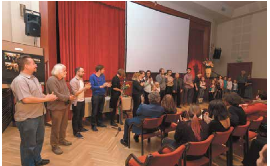
Idén is volt Rövidfilmszemle (RöFi) a művészeti hét első két napján, szám szerint már a hetedik