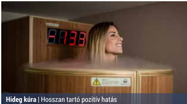
Hideg kúra | Hosszan tartó pozitív hatás

Az 1970-es években egy japán tudós, Dr. Yamauchi kifejlesztett egy új módszert, amiben szokatlanul hideg hőmérséklettel gyógyított. A hidegterápia (krioterápia) lényege, hogy a szervezetet nagyon rövid időre (2-3 percre) mínusz 120 és 170 Celsius-fok közötti hőmérsékletnek teszik ki egy erre a célra speciálisan kialakított kabinban.