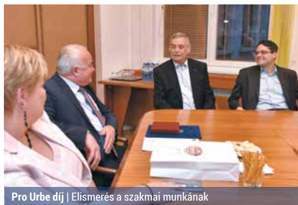
Pro Urbe díj | Elismerés a szakmai munkának

Pro Urbe díjat vehetett át a kerületünkben élő mesteredző, Kulcsár Győző. Hajdu László polgármester szerint a négyszeres párbajtőr olimpiai bajnok, edző, a Nemzet Sportolója kapta az egyik legnagyobb tapsot a Fővárosi Önkormányzat november 17-i ünnepi közgyűlésén. A Pest, Buda, Óbuda egyesítésének 143. évfordulója alkalmából rendezett ünnepségen adták át a főváros legmagasabb rangú kitüntetését.