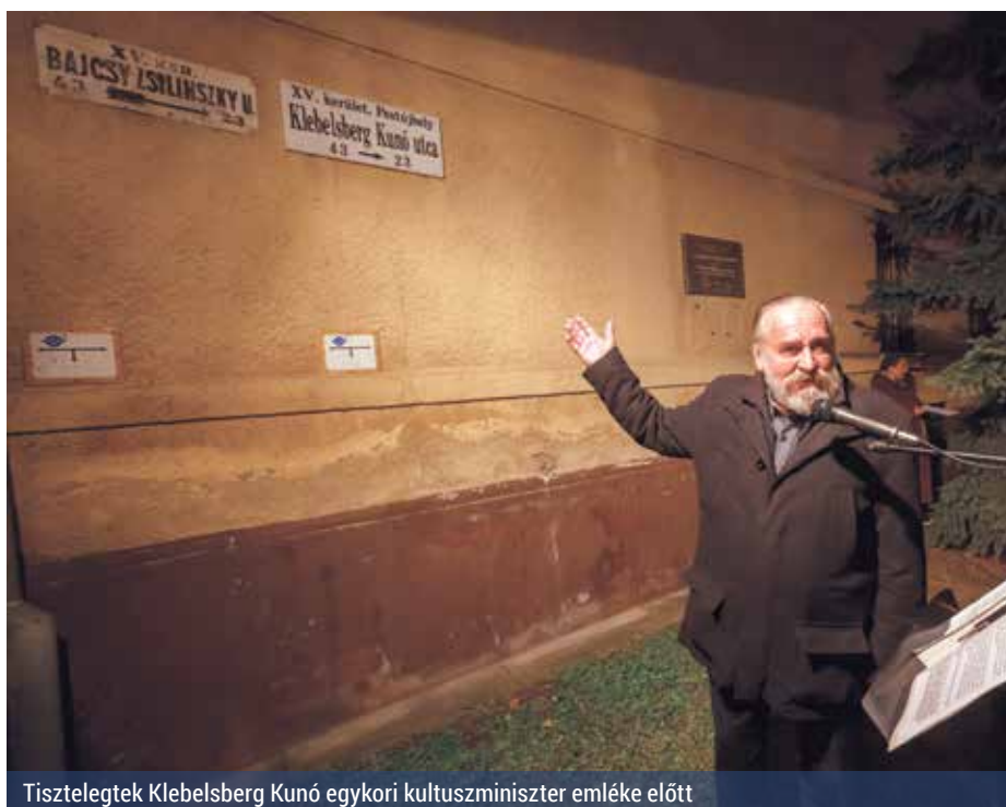
Tisztelegtek Klebelsberg Kunó egykori kultuszminiszter emléke előtt