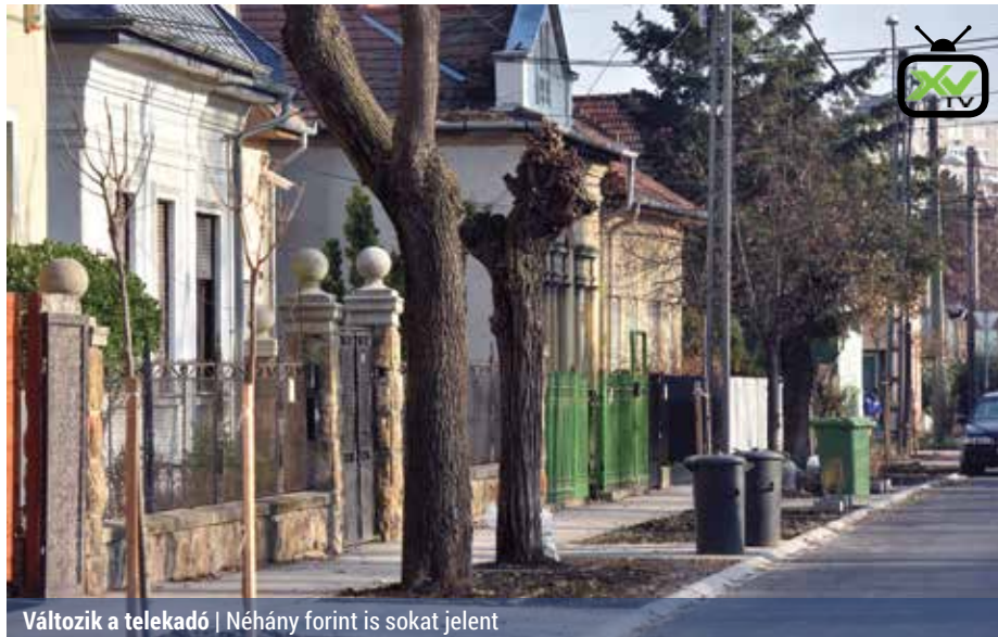
Változik a telekadó | Néhány forint is sokat jelent

A rendeletmódosítást követően 2017. január 1-jétől az építményadó mértéke a 100 négyzetméter hasznos alapterületet meghaladó épít-