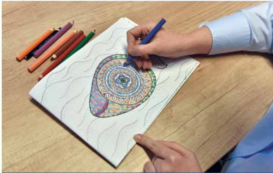
Megmozgatja a kreativitást | Kizökkent a mindennapokból

Számos felnőttet ért kudarc az iskolában a rajzórán, az ott szerzett negatív tapasztalatokat is segíti feloldani a színezés. Van olyan fejlesztőpedagógus, aki szerint a színezők tekinthetők első lépcsőfoknak a szabadkézi rajzolás felé, amikor teret engedünk a saját érzelmeinknek, és mind a formákat, mind a színeket pil-