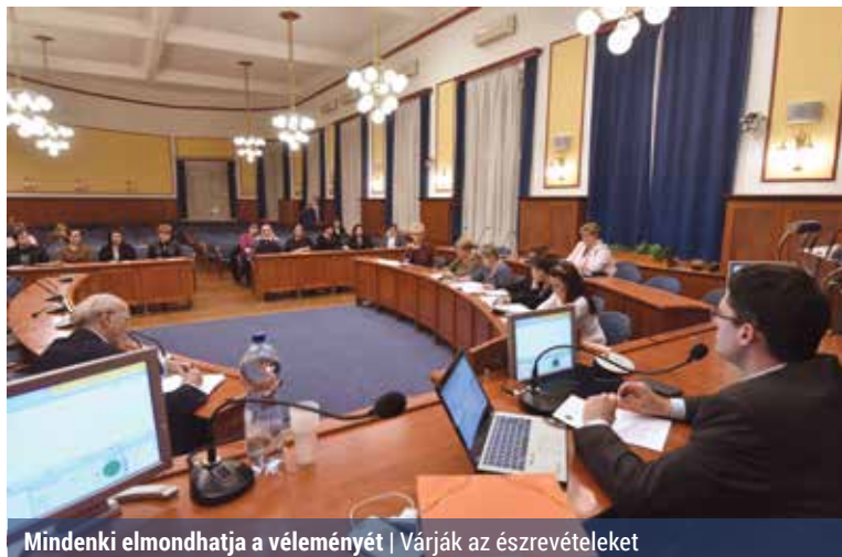
Mindenki elmondhatja a véleményét | Várják az észrevételeket