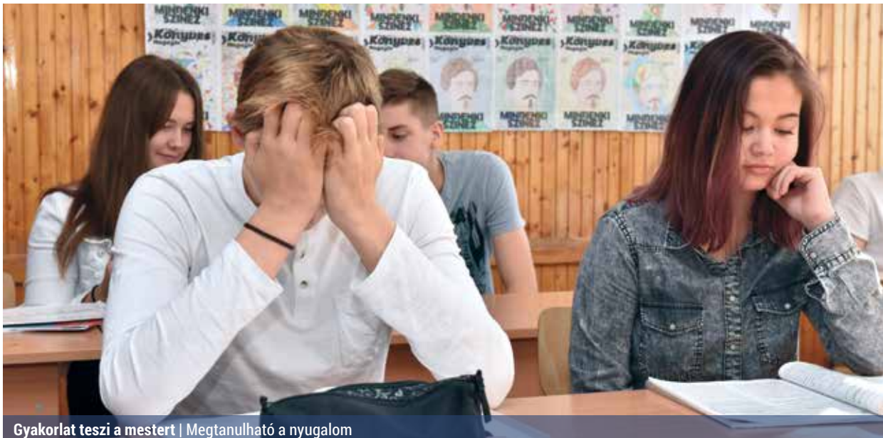
Gyakorlat teszi a mestert | Megtanulható a nyugalom

A felhalmozódott stressz és a különböző feszültségek összeadódnak, de gyakorlatot lehet szerezni abban, hogy a gyerek saját magát ellazítsa, oldja a benne levő feszültségét. A kisebb gyerekeknél játékos, ritmikus, jó hangulatú mozgásos gyakorlatokkal lehet ezt elérni, a nagyobbaknál fokozatosan a befelé figyelés, elmélyedés, a passzív relaxációs módszerek lehetnek eredményesek.