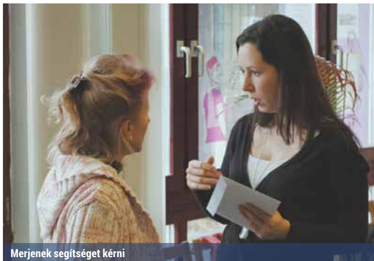
Merjenek segítséget kérni

A Vakok és Gyengénlátók Közép-Magyarországi Regionális Egyesülete (VGYKE) fontos feladatának tartja, hogy segítse és támogassa a látássérült szülőket és a látássérült gyereket nevelő családokat. Ennek jegyében szülői klubba is invitálta az érintetteket.