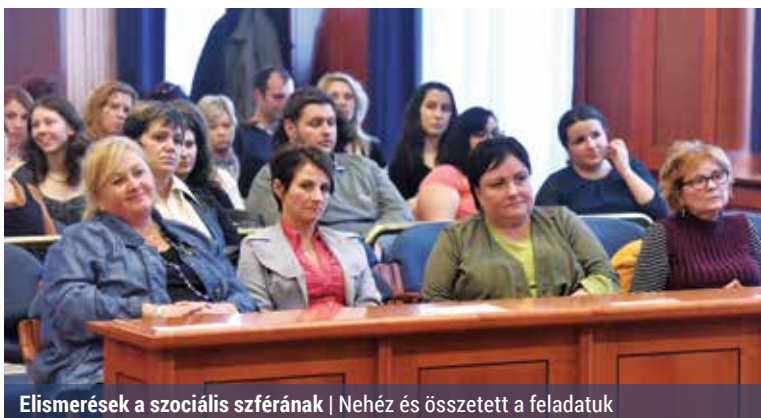
Elismerések a szociális szférának | Nehéz és összetett a feladatuk

Elismeréseket adtak át november 17-én, a szociális munka napja alkalmából a hivatalban. Az önkormányzat minden évben köszönetet mond a támogatásra és segítségre szorulóknak dolgozó szakembereknek.