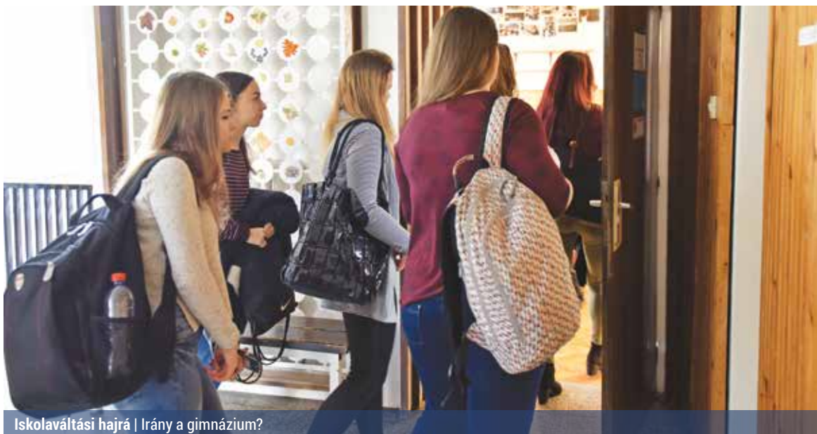
Iskolaváltási hajrá | Irány a gimnázium?

ben kell jelentkezni, ahol a tanuló a felvételit szeretné írni, ha a gyermek több helyre jelentkezik, akkor ő maga dönti el, melyikben írja meg központi dolgozatát. A sikeres írásbeli után