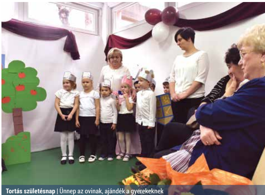
Tortás születésnap | Ünnepe az ovinak, ajándék a gyerekeknek

A telken már 1924-ben óvoda állt, de a kerület lakosainak száma olyan ütemben növekedett, hogy a régi két-csoportszobás épület helyére újat kellett felhúzni 1976-ban. A társadalmi összefogásban megépült óvoda életében az évek alatt számos változás volt, az utolsó nagyobb átszervezés 2011-re esett, amikor két másik óvodával összevonták, és így