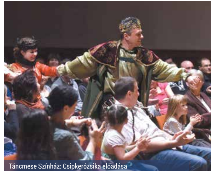
Táncmese Színház: Csipkerózsika előadása