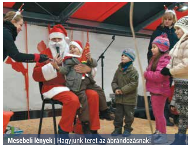
Mesebeli lények | Hagyjunk teret az ábrándozásnak!

Öt- és hét éves kor között egyre többet kételkedik már a gyermek a csodákban, de engedjük meg, hogy maga fedezze fel az összefüggéseket. Ha rákérdez: létezik-e a Mikulás, Jézuska, a legjobb, ha átgondoljuk a választ, mielőtt bármit mondanánk. Ugyanis, ha idejekorán mondjuk el az igazat, nem biztos, hogy készen áll rá a gyermekünk. Inkább igyekezzünk kipihatólni, miként vélekedik ő. Mi-