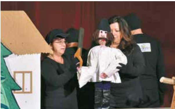
Országos Pedagógus Bábtalálkozó