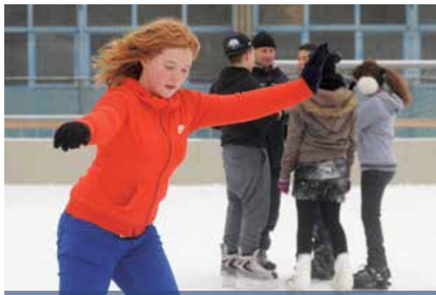
Kezdődik a kerületi koriszezon | Február végéig tart

Az üzletközpontnál levő pálya a tervek szerint december 2-ától üzemel. A délelőtti órákban reggel 8-tól délután 2 órá-