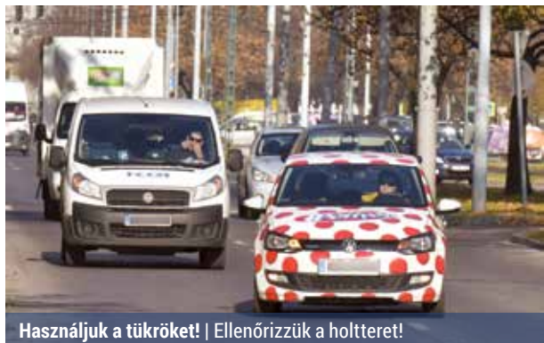
Használjuk a tükröket! | Ellenőrizzük a holtteret!

– A mai autókra szerelt aszférikus tükrök biztonságo-