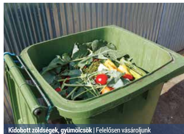
Kidobott zöldségek, gyümölcsök | Felelősen vásároljunk

Sőt, a probléma hazánkat sem kerüli el. A legutóbbi táplálkozás felmérés adatai szerint ugyan a felnőtt lakosság több mint 60 százaléka túlsúlyos vagy elhízott, addig más felmérések arra is rámutatnak, hogy a gyerekek körében megjelenik az alultápláltság.