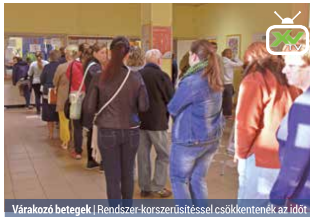
Várakozó betegek | Rendszer-korszerűsítéssel csökkentenék az időt

A nyári hónapokban sokaknak feltűnt, hogy a kora reggeli órákban rengetegen vártak a Rákos úti Szakrendelő előtt a laborvizsgálatra.