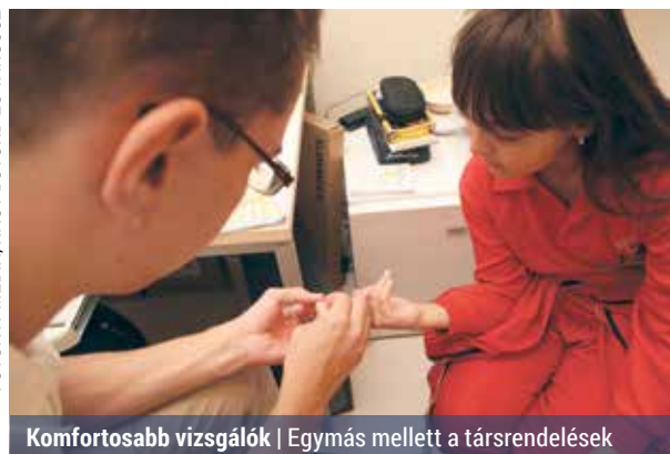
Komfortosabb vizsgálok | Egymás mellett a társrendelések

A már említett diabetológia október 10-től az Órjárat