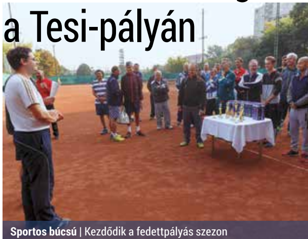
Sportos búcsú | Kezdődik a fedettpályás szezon

Az önkormányzat támogatásával szeptember 25-én rendezték meg a Palotai Testvériség Tenisz Egyesület teniszpályáin az egyesület évadzáró versenyét, melynek célja az amatőr és a tömegsport népszerűsítése volt. A verseny fővédnöki tisztét Dr. Pintér Gábor alpolgármester vállalta el.