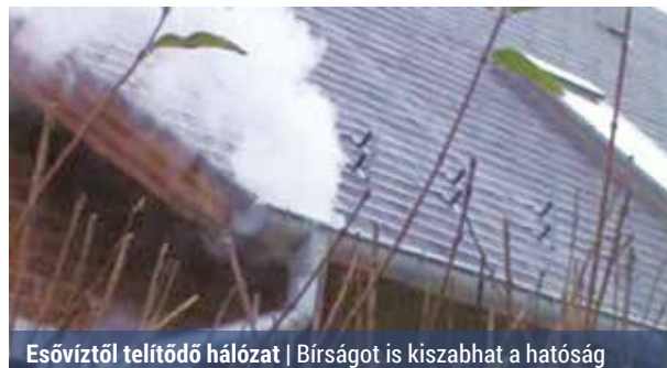
Esővíztől telítődő hálózat | Bíróságot is kiszabhat a hatóság

A külvárosi részekben, a peremkerületekben a csapadékvíz-elvezetés kiépítése még lemaradásban van a szennyvízcsatornához képest, ezért gyakori jelenség, hogy a lakosság – a jogszabályi tiltás ellenére – az esővizet az elválasztott rendszerű szennyvízcsatornába vezeti.