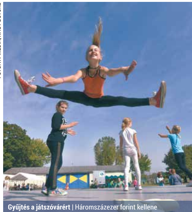
Gyűjtés a játszóvárért | Háromszázezer forint kellene

alapítványára számára is gyűjtöttek, az intézmény ugyanis egy duplatornyos játszóvárát szeretne az udvarán felállítani, amely nagyjából 300 ezer forintba kerül. Az iskolai ala-