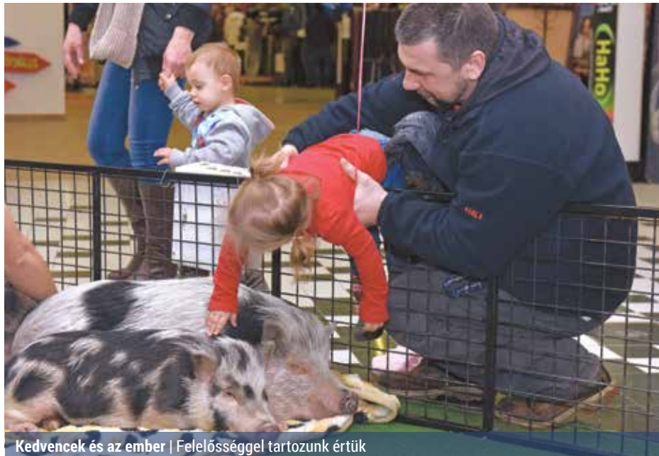
Kedvencek és az ember | Felelősséggel tartozunk értük

Az állatok világnapját 1931 óta ünneplik világszerte. Az eseményt Assisi Szent Ferenc, az állatok védőszentjének halála napján, október 4-én tartják. Hazánk a rendszerváltozás után csatlakozott a kezdeményezéshez.