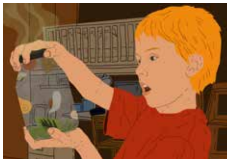
GRAFIKA: VARGA TÍMEA LAURA

Fejet hajtottam az érvek előtt, így egy homokozóvödörrel, benne hat csigával indultunk haza. Mi történhet? Elszaladni nem fog-