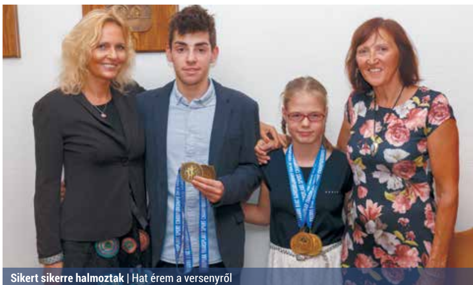
Sikert sikerre halmoztak | Hat érmet a versenyről