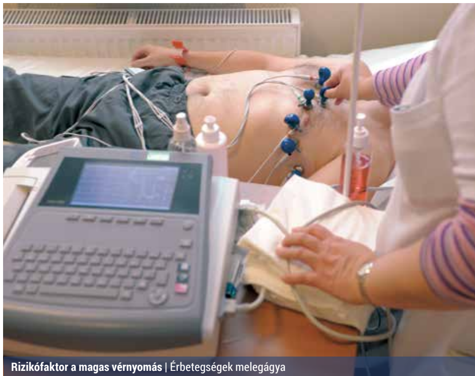
Rizikófaktor a magas vérnyomás | Érbetegségek melegágya