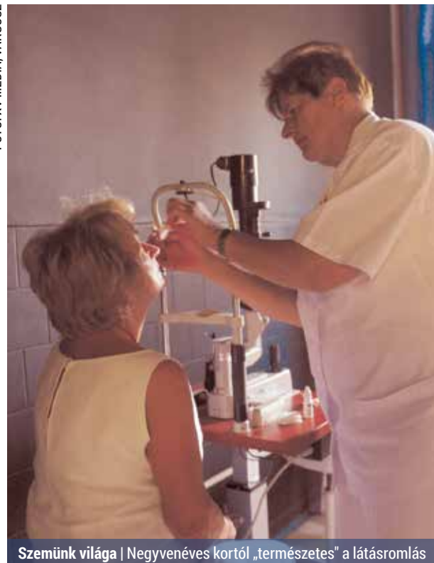
Szemünk világa | Negyvenéves kortól „természetes” a látásromlás

Negyvenéves kor körül természetesnek mondható a látásromlás, amely leggyakrabban az apró betűk öszszefolyásában mutatkozik meg. Ez könnyen korrigálható multifokális szemüveggel,