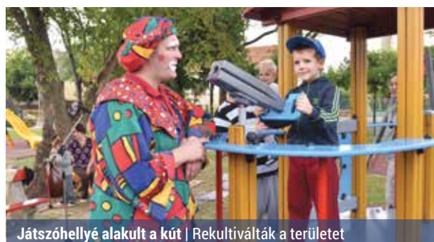
Játszóhely alakult a kút | Rekultiválták a területet