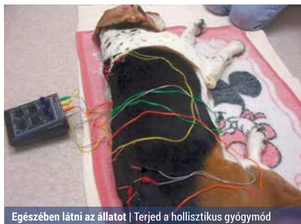
Egészségében látni az állatot | Terjed a holisztikus gyógymód

akupunktúrán kívül pedig Bach-cseppek, homeopátiás golyócskák vagy gyógytorna is segíthet az állatoknak fájdalmaik leküzdésében. A fizioterápia hazánkban az állatgyógyászat területén még ismeretlen gyógymód. Sokoldalúsága és nagy hatékonysága miatt számítani lehet a jövőbeni elterjedésére. Ráadásul néhány praktika könnyen elsajátítható, így a gazdi saját otthonában is segíthet kedvencén. Jó benyomást kelt továbbá, ha a kezelő állatorvos az általa végzett kezelésen és a gyógyszerfelíráson kívül egyéb, egyszerű tanácsokkal is tudja szolgálni az állat mielőbbi gyógyulását. (bi)