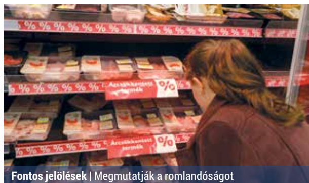
Fontos jelölések | Megmutatják a romlandóságot