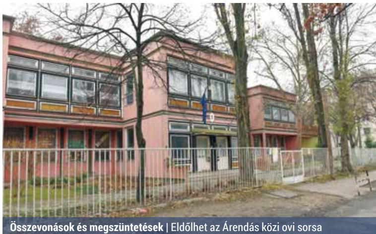
Összevonások és megszüntetések | Eldőlhet az Árendás közti ovi sorsa

Az átszervezés kapcsán határozhatnak városrészenkénti összevont óvodák létrehozásáról, az Árendás közti óvoda megszüntetéséről, a Régi Főti úti óvo-