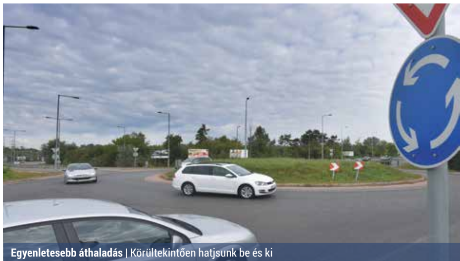
Egyenletesebb áthaladás | Körültekintően hatjunk be és ki

Főváros-, illetve országszerte találkozunk körforgalmakkal, amelyek – a forgalomhoz alkalmazkodva – nagyobb és egyenletesebb áteresztőképességet és biztonságos áthaladást biztosítanak a kereszteződésekben. Ha a szabályoknak megfelelően közlekedünk bennük, valóban biztonságosak.