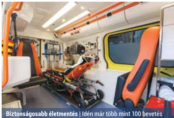
Biztonságosabb életmentés | Idén már több mint 100 bevetés

– Nagyon örültünk az új járműnek – mondta Glasz Richárd, a mentőállomás vezetője –, mert ezzel hatékonyabban tudunk dolgozni. Az új autótól rövid idő alatt 12 ezer kilométer tettünk meg, és több mint száz bevetésen vettünk részt.