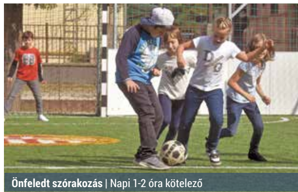
Önfelelt szórakozás | Napi 1-2 óra kötelező

A versenyről bővebb információt a Kovács Pál Baptista Gimnázium honlapján lehet megtudni. Ami biztos, idén a legjobb blogírók a nyereményük mellé blogórákat is kapnak majd, azaz a szakemberekből álló zsűri felkészítést fog tartani a számukra. R. T.