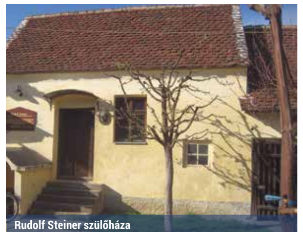
Rudolf Steiner szülőháza

A vasútépítésnek köszönheti Murakirály eddigi leghíresebb szülöttjét – Rudolf Steiner, a Waldorf-pedagógia megalapítója 1861-ben látta meg a napvilágot itt, mivel édesapja