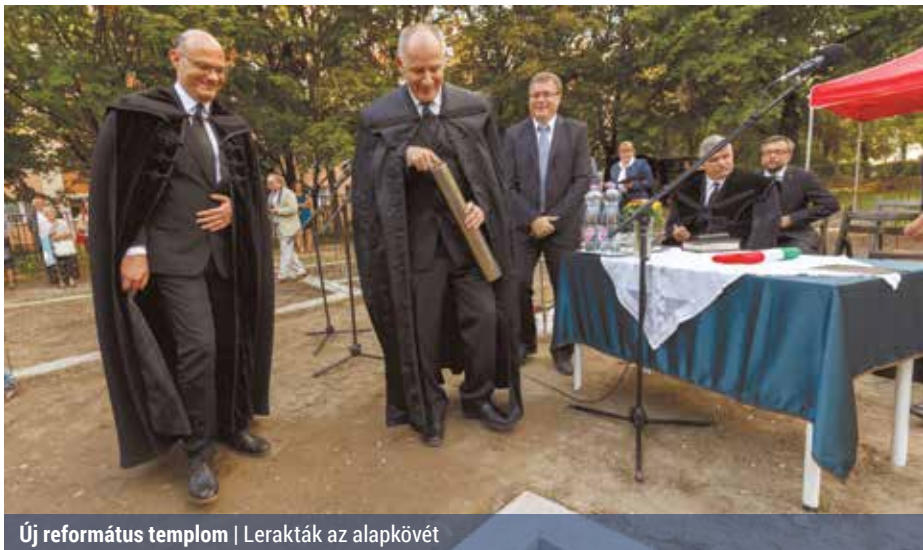
Új református templom | Lerakták az alapkövét