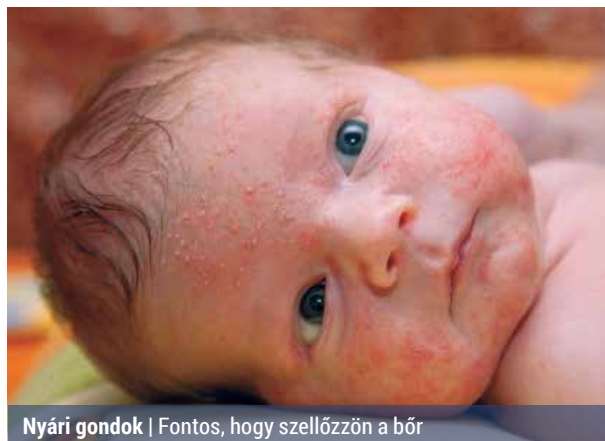
Nyári gondok | Fontos, hogy szellőzzön a bőr