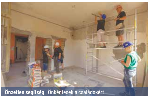
Önzetlen segítség | Önkéntesek a családokért