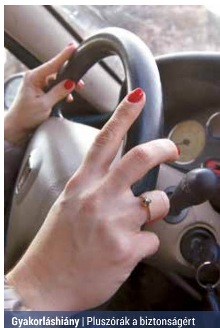
Gyakorlásiány | Pluszórák a biztonságért