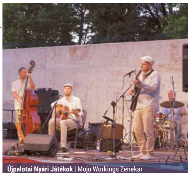
Újpalotai Nyári Játékok | Mojo Workings Zenekar

Egy közösségi háznak többnek kell lennie annál, hogy csak kultúrát közvetítsen. Az USZIK is így volt ezzel. A munkatársai a '80-as években részt vettek az Újpa-