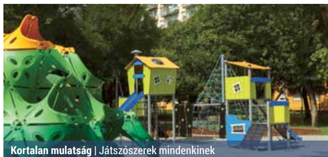
Kortalan mulatság | Játszószerek mindenkinek

Elkészült a kétkorosztályos játszótér a Kontyfa utcában, a gyerekek már birtokba is vehették a vadonatúj játszószerekkel felszerelt parkot. A téren mind a kicsik (6 éves korig), mind a nagobbacska (6–12 éves korig) gyerekek szórakozását biztosító játszószereket helyeztek ki.