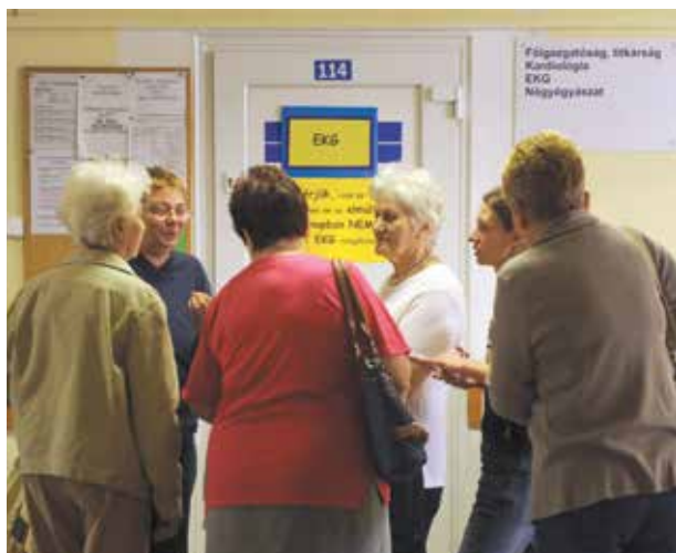
Ősszel kezdődnek a szűrések | Rávilágítanak a problémára

A demencia szűrésen nyolcvanheten vettek részt, közülük betegsége utaló tüneteket negyvenegy főnél diagnosztizáltak. Azaz majd minden második embernél felmerült a demencia gyanúja. Az emésztőszervi szűrés-