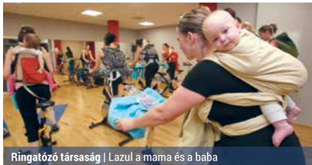
Ringatózó társaság | Lazul a mama és a baba

Mivel sok sportos anyukának okoz fejtörést, miként őrizheti meg, illetve szerezheti vissza fittségét, és mozoghat kisbabája mellett, pontosabban vele együtt, folyamatosan újabb és újabb irányzatok jönnek létre. A babával való közös torna, a hordozós tánc és a babakocsis futás után néhány éve megjelent a hordozós spinning is.