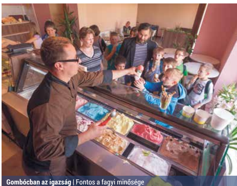
Gombócban az igazság | Fontos a fagyó minősége

A gombócós fagyaltok előállítását az olaszoktól származik, jégkrémet pedig Amerikában készítettek először, amikor a XIX. század második felében elkezdte termelését az első hivatalos jégkrémgyár. A fagyalt és a jégkrém szavakat gyakran szinonimaként használják, pedig előállításukat tekint-