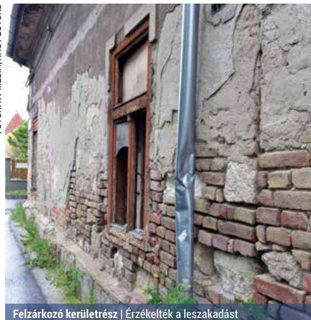
Felzárkozó kerületrész | Érzékelték a leszakadást