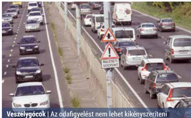
Veszélygócok | Az odafigyelést nem lehet kikényszeríteni

A napokban történt, hogy az M3-as autópálya kivezető szakaszán egy férfi elaludt a volán mellett, és nem vette észre, hogy a pályán munkagépek dolgoznak. Az utat javító munkások döbbenet konstataáltak, hogy az autó fékezés nélkül szaladt bele az egyik gépbe. Az eset nem végződött tragédiával, az autó vezetője túlélte az ütközést, de komoly fejsérülést szenvedett.