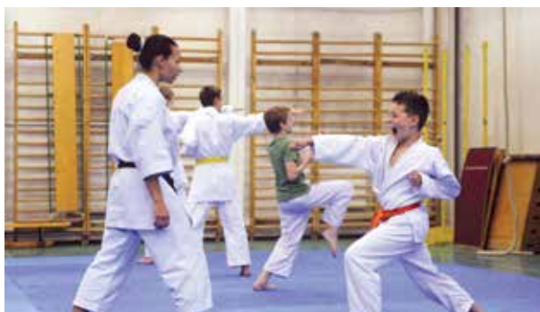
Áthidalták a teremhiányt | Ott folytatják, ahol abbahagyták

A Dynamic edzőinek per sze nem kis fejtörést okozott egy iskola tágas tornaterméhez