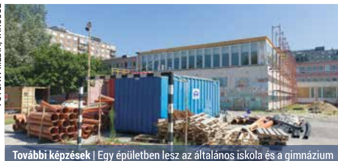
További képzések | Egy épületben lesz az általános iskola és a gimnázium

– Az iskolaépület felújítására, korszerűsítésére több mint 740 millió forintot állami támogatást szavazott meg a kormány. Ebből az összegből elvégzik a homlokzat és a födém hőszigetelését, a csapadékvíz elvezetését, 26 tanterem komplett felújítását, 10 csoportterem korszerűsítését, 8 szaktanterem, laboratórium, logopédiai és iskola pszichológusi szoba kialakítását. Az épületben lesz könyvtár, szakkönyvtár, kettéválasztható tornaterem és sportszertár is. Minden, az oktatáshoz szükséges helyiséget korszerűsít-