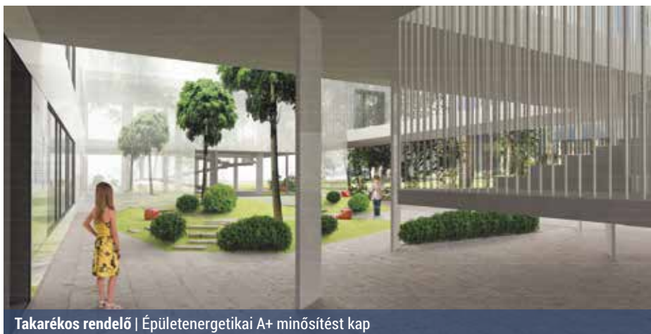
Takarékos rendelő | Épületenergetikai A+ minősítést kap

– A rendelőépület építési engedélyezése lezárult, jelenleg a kivitelező kiválasztására irányuló közbeszerzési eljárást végzik. Ennek eredményes lezárása után a munkaterület átadható, és kezdődhet a munka.