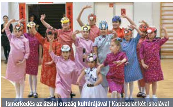
Ismerkedés az ázsiai ország kultúrájával | Kapcsolat két iskolával