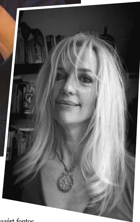
FORRÁS: TARI ANNAMÁRIA