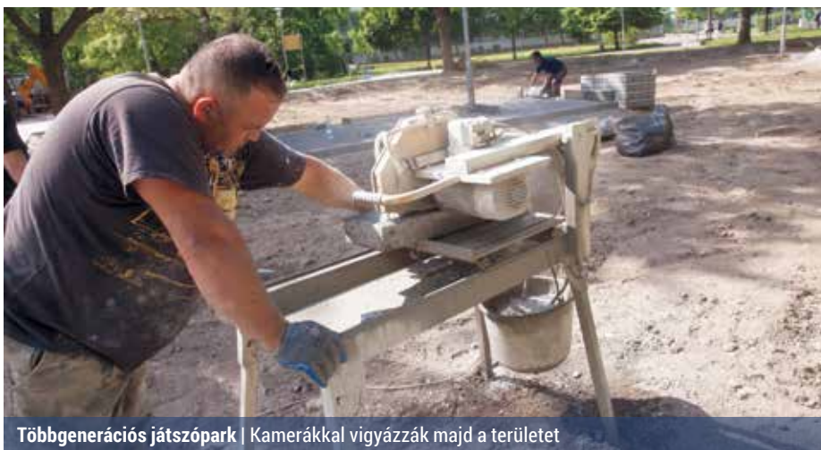
Többgenerációs játszópark | Kamerákkal vigyázzák majd a területet

A fejlesztést három ütemre bontották. Tavaly a lakótelepi konyhapark program keretében közösségi kertet alakítottak ki, ahol a környékbeli lakók idén tavasszal már elkezdhetik a parcellák művelését. Az első ütemben szerepelt egy futópálya megépítése is, ez azonban forrás hiányában nem valósult meg.