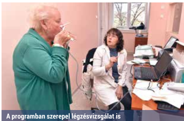
A programban szerepel légzésvizsgálat is

embereitől azt is megtudhatjuk, baj esetén mit tegyünk, kitől kérhetünk segítséget. A napi testedzést is népszerűsítik a flabelos-szal. A gerincnyújtó padot is bemutatják, illetve az is kiderül, hogy az eszköz mikor, hol és milyen problémák esetében vehető igénybe.