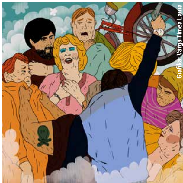
Grafika: Varga Tímea Laura

Egy férfi mosta motorkerékpárját a Szócs Bertalan utcában, amikor két nőből és három férfiből álló társaság arra ment. Ez utóbbiból az egyik odaszólt a férfinak, aki ezt zokon vette és viszsza szólt.