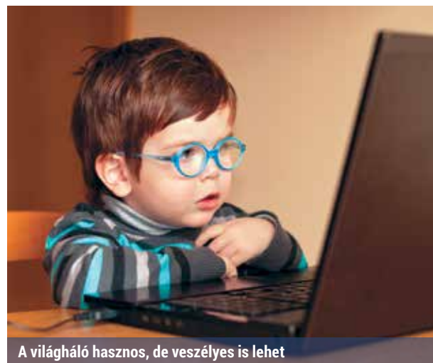
A világháló hasznos, de veszélyes is lehet

Míg még két évtizeddel ezelőtt csak kevesek kiváltsága volt, ma már – az okostelefonok terjedése révén – mindennapi életünk részévé vált. Kapcsolatokat tartunk fent általa, megtudjuk, hogy a közelünkben várható-e vihar, hol van traffipax, esetleg