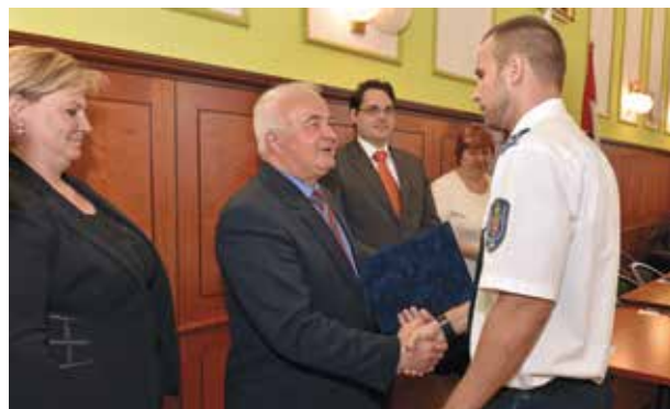
Megbecsült szakemberek | Tízen kaptak elismerést