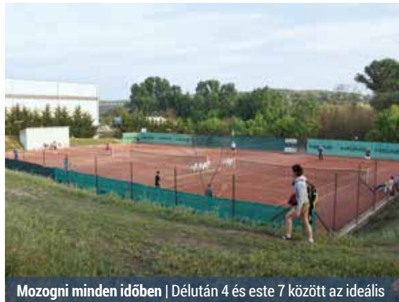
Mozgni minden időben | Délután 4 és este 7 között az ideális

Akár reggelre, akár a délutáni vagy esti órákra iktatjuk be az edzést, mindenképpen jobban járunk, mintha egyáltalán nem sportolnánk. Mégsem mindegy azonban, hogy melyik napszakot választjuk a mozgásra – állítják a kutatók.