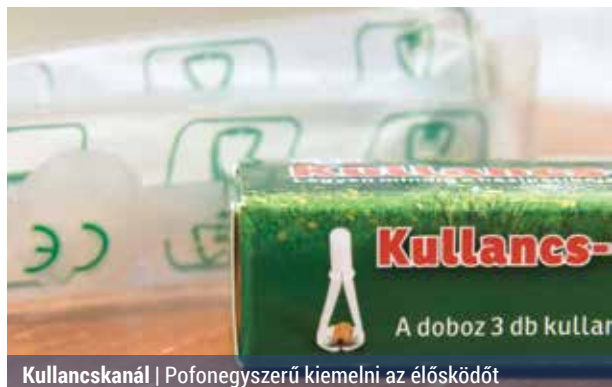
Kullancskanál | Pofonegyszerű kiemelni az élősködőt

Idén is megtartotta tavaszi sajtótájékoztatóját a Magyar Kullancs-szövetség. A kullancshelyzetet kívül szó esett a szúnyogok okozta fertőzésekről is.