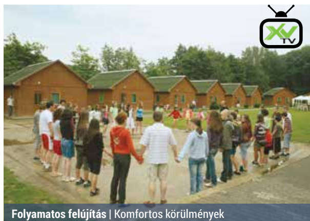
Folyamatos felújítás | Komfortos körülmények

Önkormányzatunk tavalyi és idei költségvetéséből is jelentős összeget fordított a Bernecebarátiban található gyermektábor felújítására.