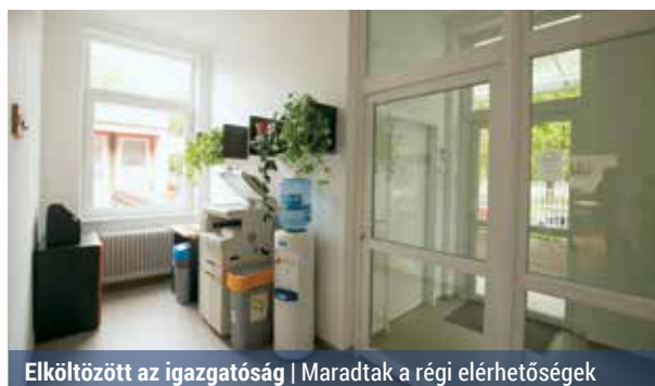
Elköltözött az igazgatóság | Maradtak a régi elérhetőségek

Az újpalotai lakótelepen 2012-ben kezdődött el a szociális városrehabilitáció harmadik része, melynek keretében közterületek, épületek, lakóházak újultak meg.