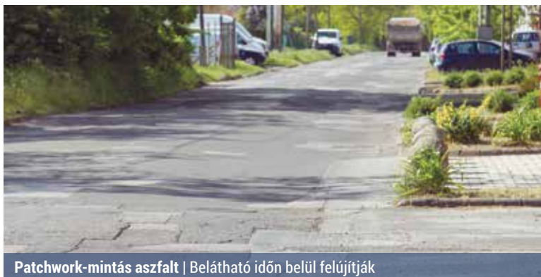
Patchwork-mintás aszfalt | Belátható időn belül felújítják

Mikor újítják fel a Mogyoród útja Régi Fóti út és Közvágóhíd utca közötti szakaszát, mert az út elkezett a lakossági kérdés Hajdu Lászlóhoz, az XV TV Megkérdezzük a polgármestert című adásában.