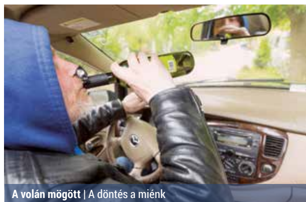
A volán mögött | A döntés a miénk

Az ittas sofőrök által okozott balesetek számának csökkentéséért indított online kampányt az Országos Balesetmegelőzési Bizottság egy alkoholforgalmazó céggel. A „Soha ne igyál, ha vezetsz!” elnevezésű kezdeményezés a felelős járművezetésre buzdítja az autósokat.