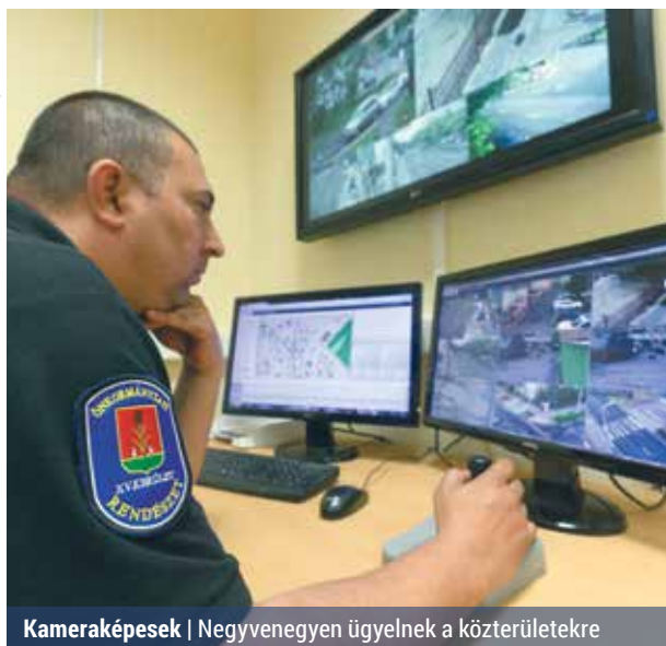
Kameraképek | Negyvenegyen ügyelnek a közterületekre

Az új irodában kapott helyet a kerület térfigyelő kamerarendszerének központja is, amelyet április 1-jétől a közterület-felügyelők és segéd-felügyelők már napi 24 órában működtetnek. A segéd-felügyelők a jövőben is felelték, a közterület-felügyelők pedig kék egyenruhát viselnek. Ez egyrészt figyelemfelhívó, másrészt azt is jelzi, hogy a két rendészeti munkakör közül csak a kék színű közterület-felügyelő számíthat hivatalos személynek, aki szabálysértés esetén igazolható, előállítását kezdeményezhet és korlátozhatja a személyi szabadságot.