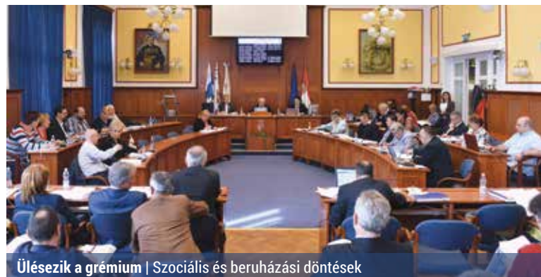
Ülésezik a grémium | Szociális és beruházási döntések

A soron következő ülést május 3-án délután 4 órától tartja a XV. kerületi képviselő-testület. A tervek szerint 20 napirendi pontot vitatnak meg a képviselők.