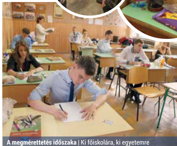
A megmérettetés időszaka | Ki főiskolára, ki egyetemre