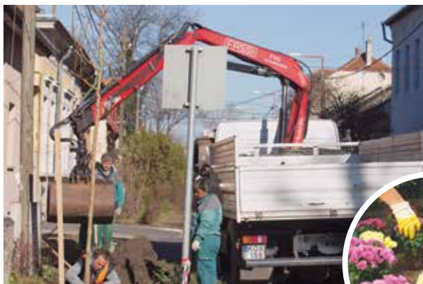
Négyszáz facsemétét telepítettek