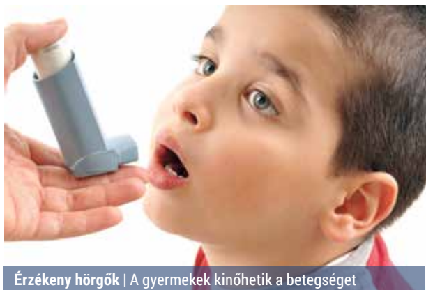
Érzékeny hörgők | A gyermekek kinöhetnek a betegséget

Az asztma jellemzője, hogy a hörgők nagyon érzékenyek különféle külső ingerekre, amelyek hatására beszűkülnek. A betegség kiváltó oka rejtély, az azonban biztos, hogy az asztmára való hajlam öröklődik, és a por-, valamint a légszennyezett-