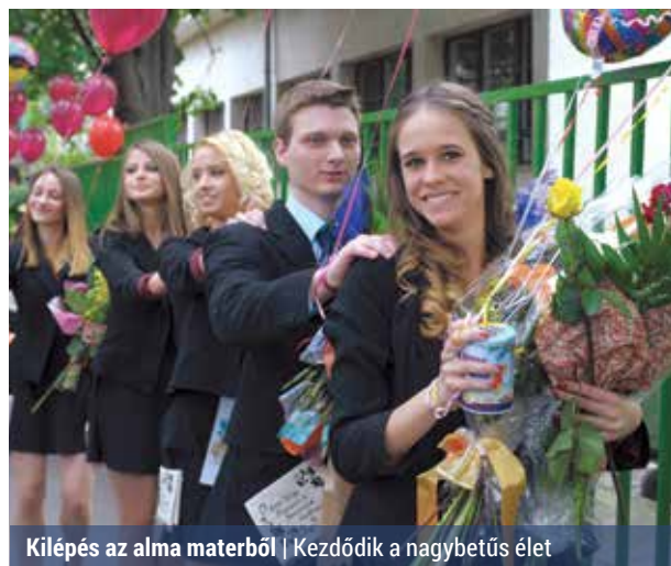
Kilépés az alma materből | Kezdődik a nagybetűs élet

Másfél évszázada még csak a bányászatanulók kiváltsága volt ballagással ünnepelni az utolsó diáknapot, ma azonban már minden családban emlékeztetés ez az esemény.