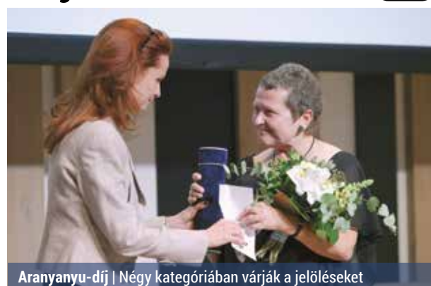
Aranyanyu-díj | Négy kategóriában várják a jelöléseket

Még jó, hogy akadnak olyanok, akik odafigyelnek a több fronton helytálló nőkre. Azokra a családayákra, akik a munka világában is helytállnak, és a „második műszakban” otthon még háztartást is vezetnek, s akik mindezt gyakran kevés vagy még annyi elismerést sem kapnak.