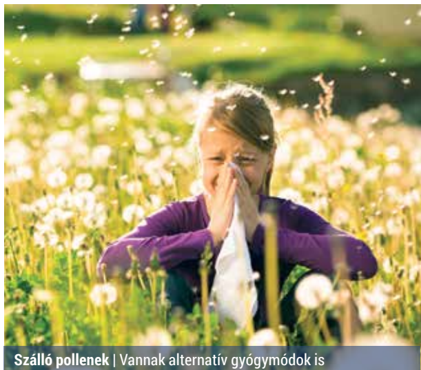
Szálló pollenek | Vannak alternatív gyógymódok is

A pollen okozta allergia tüneteinek enyhítésére alkalmas a csalán tea, a kamillatea, a fokhagy-