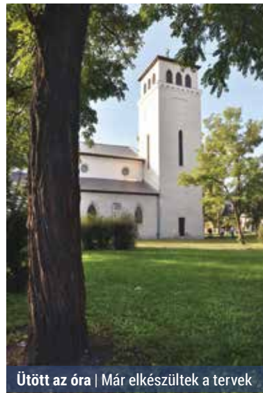
Útött az óra | Már elkészültek a tervek

szedtük az elképzeléseinket, és elkezdtük a párbeszédet a plébániával – mondta az érdemérmes.