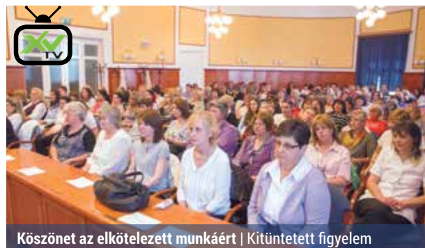
Köszönet az elkötelezett munkáért | Kítüntetett figyelem

Hogyan kerül a bölcsődébe Shakira? Bizonyára most sokan elcsodálkoznak, pedig semmi különös nincs benne, csupán a népszerű kolumbiai énekesnő Mindent kipróbálni című dalával nyitották meg azt a rendezvényt, melynek fő témája a bölcsődei gondozás fontossága volt. A XV. kerületi gondozók táncos produkciója pedig remek hangulatot teremtett ahhoz, hogy a kihívások mellett a szakma szépségeiről is beszéljenek a rendezvényen.