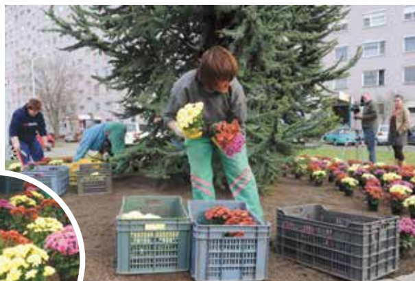
Hamarosan kezdik az egyényári virágok kiültetését

Befejeződtek azok a parkolófelújítási munkák, melynek során a Páskomliget és Száraznád utcában csaknem 1300 négy-