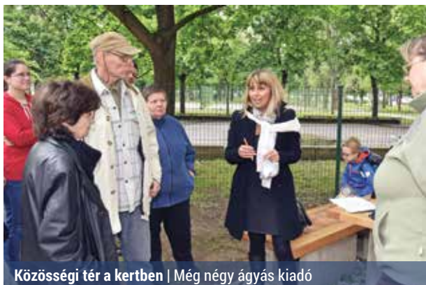
Közösségi tér a kertben | Még négy ágyás kiadó

mögött, valamint a Neptun utcában és a Kórákás parkban is nyitottak egy-egy kertet. Ezek a területek azóta is népszerűek, és az ágyások „gazdái” az elmúlt évben gondosan művelték a kertjeiket.