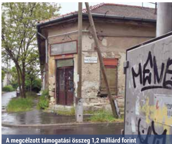
A megcélzott támogatási összeg 1,2 milliárd forint

lesztéseket kiegészítve „szoft” típusú tevékenységek (például társadalmi integrációt segítő, közbiztonsági