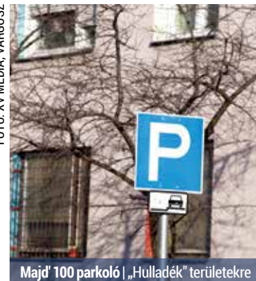
Majd 100 parkoló | „Hulladék” területekre

A Nyírpalota utca 1–21. mögött már meglévő parkoló bővítését is szeretnék