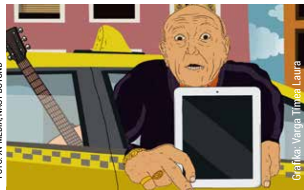
Grafika: Varga Tímea, Laura

Egy fiatal ember a taxiban felejtette a gitárját és a tabletjét. A taxis azonban ahelyett, hogy visszaadta volna ezeket neki, megpróbálta az eszközöket értékesíteni. Ehhez pedig az egyik közösségi portált használta. A sértett ezt meglátta, és