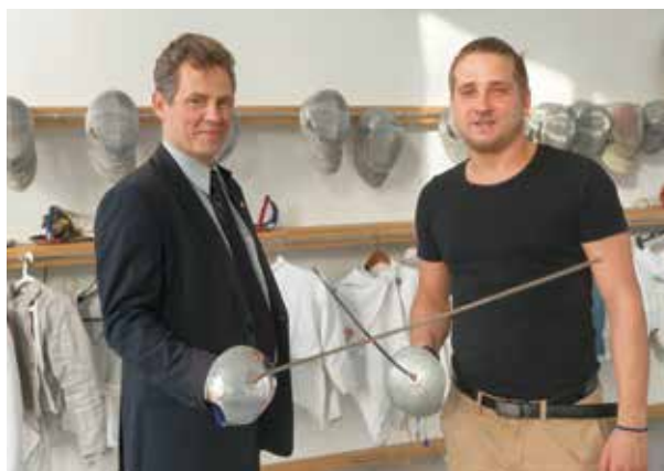
Szitt Zsolt és Decsi Tamás | Köszöntötték a kvótaszerezőt

A hatszoros olimpiai, kilencszeres világ- és egyszeres Európa-bajnok kardvívó, Kovács Pálról elnevezett rákospalotai sportiskolában – amely idén ünnepli fennállásának huszadik évfordulóját – mindig nagy várakozással tekintenek az olimpiára. Teszik ezt azért, mert az iskolában pallérozó diákok közül többen is el szoktak jutni az adott olimpiára.