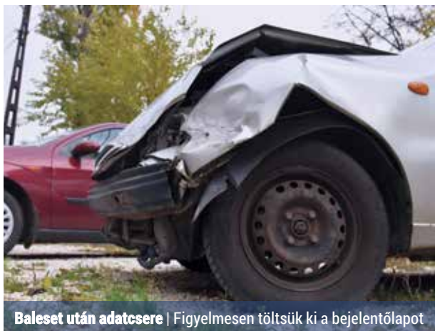
Baleset után adatcsere | Figyelmesen töltjük ki a bejelentőlapot

Gyakran előfordul, hogy két autó összeütközik. Nem kellene hozzá extrém időjárási körülmények, elég, ha mi vagy autóstársunk figyelmen kívül hagy egy jobbkezes utcát, vagy a rádió beállítása, esetleg telefonálás miatt rövid időre elveszi a tekintetét az útról, és máris megvan a baj.