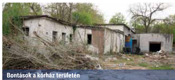
Bontások a kórház területén