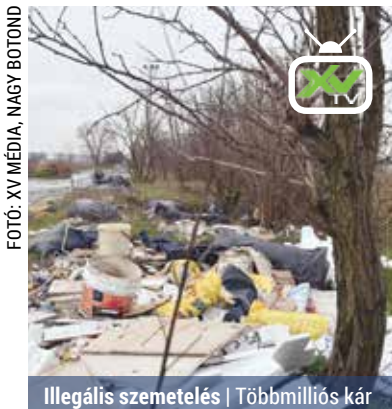
Illegális szemetelés | Többmillió kár

Négy szervezet, a mezőőrök, a polgárőrség, a közterület-felügyelet és a rendőrség is ellenőrzi a területet, mégis alig tudnak eredményt felmutatni. A helyszínen, szemetlerakás