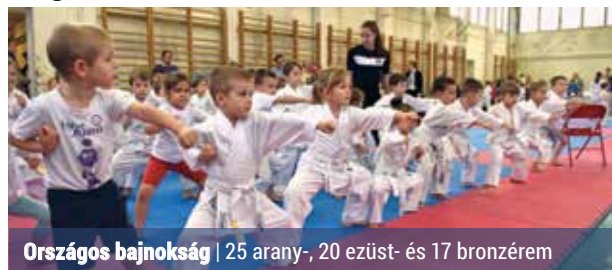
Országos bajnokság | 25 arany-, 20 ezüst- és 17 bronzérem

A Mogyoródon rendezett karate magyar bajnokság mindig a sportág legnagyobb hazai ünnepe. A nemzetközi szövetség (WKF) szabályai alapján rendezett eseményen minden klub részt vesz. A karate magyar bajnokságok sajátossága, hogy az újonctól a felnőttéig minden korosztály tagja részt vesz. Az idei versenyen parakarátosok is részt vettek.