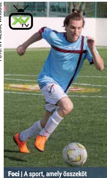
Foci | A sport, amely összeköt

A XV. kerületi önkormányzat a tavalyihoz hasonlóan idén is benevezett a versenyre. A csapat a negyvennégy fős mezőnyt felvonultató Kelet Kupában