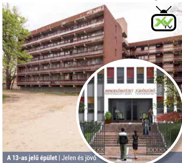
A 13-as jelű épület | Jelen és jövő

Az ÉPK 13. számú épületének elkezdődik az átalakítása, felújítják a volt Neptun iskola épületét is, a Deák téri orvosi rendelő kivitelezése azonban még várat magára.