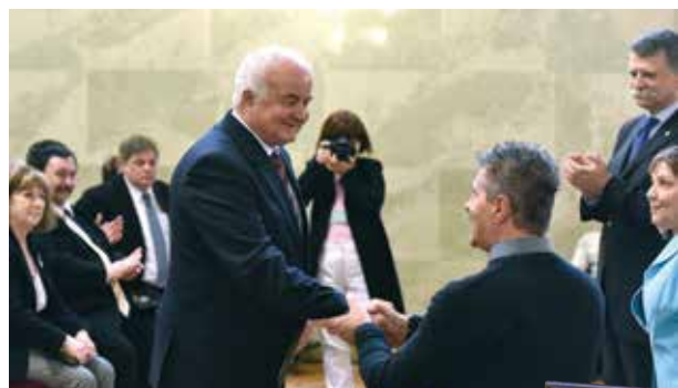
Emberséges kerület | Szeretet és felelősség

A Fogyatékos Emberek Szervezeteinek Tanácsa (FESZT) 2010 óta díjazza azokat a településeket, melyek sokat tesznek a fogyatékkal élők életkörülményeinek javításáért. Idén első alkalommal már nemcsak vidéki települések, hanem fővárosi kerületek is bekerülhettek a Befogadó Magyar Települések díjazottjai közé. Az április 8-án a Parlamentben rendezett ünnepségen két kategóriában osztottak díjakat. Az 50 ezer lakos feletti települések között a VIII., a XIII. és a XV. kerület, míg az 50 ezer lakos alatti kategóriában Dunaiújváros, Mórhalom és Vác önkormány-