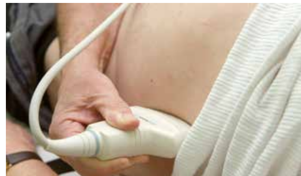
Urológiai vizsgálatok | Megelőzhető vele a prosztataprobléma

Májusban az urológiai szűrések, azon belül is a prosztataraákszűrések lesznek a Rákos úti Szakrendelőben.