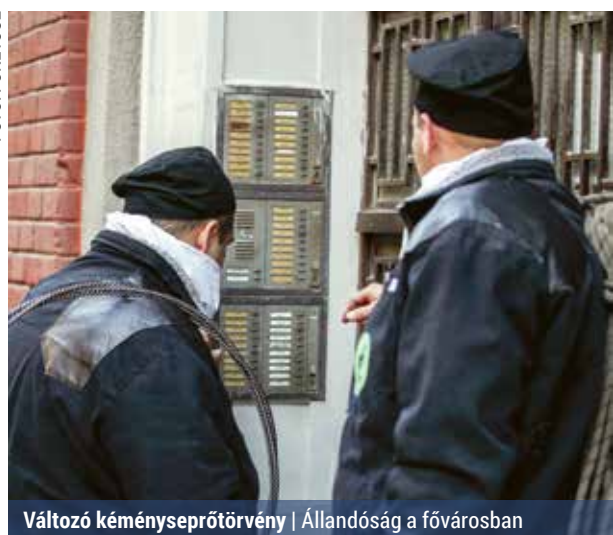
Változó kéményseprőtörvény | Állandóság a fővárosban