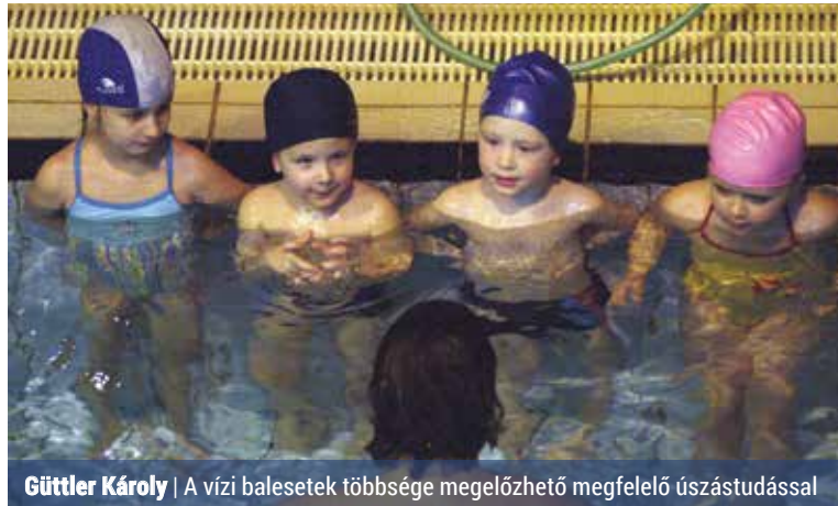
Güttler Károly | A vízi balesetek többsége megelőzhető megfelelő úszástudással

– Az úszás úgy mozgatja és fejleszti az összes izomcsoportot, hogy nem terheli túl az ízületeket. A tüdőkapacitás fejlesztésére, a tartáshibák megelőzésére vagy kezelésére ugyancsak kiválóan alkalmas. Harmonikusan fejleszti a testet, amelynek a gyermekkorban meghatározó jelentősége van. Az úszás azonban nemcsak a test, hanem a lélek edzésére, fejlesztésére is kiváló eszköz. Az így megszerzett lelki- és akaratere nemcsak a sportban, hanem az élet minden területén nagyon hasznos – sorolja az úszás előnyeit Güttler Károly Európa-bajnok úszó.