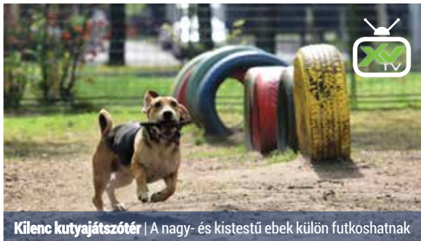
Kilenc kutyajátszóter | A nagy- és kistestű ebek külön futkoshatnak

Jelenleg 9 kutyafuttató van a XV. kerületben, ezek 2012 és 2015 között épültek, tehát az állapotuk jónak mondható. Mivel egyre nagyobb lakossági igény van újabbak létesítésére is, ezért az önkormányzat folyamatosan tervezi új kutyafuttatók építését.