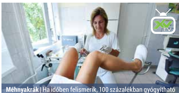
Méhnyakrák | Ha időben felismerik, 100 százalékban gyógyítható