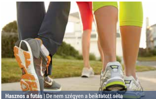
Hasznos a futás | De nem szégyen a beiktatott séta

– Érdekes időnként gyalogni azoknak, akik hosszú távú futás után nagyon elfáradnak, nehéznek érzik lábukat. Akik ezt tapasztalják, a következő edzésük már vezessék be, hogy minden – vagy minden második – kilométer után 30-60 másodperces gyaloglással váltják fel a futást – tanácsolja a szakember.