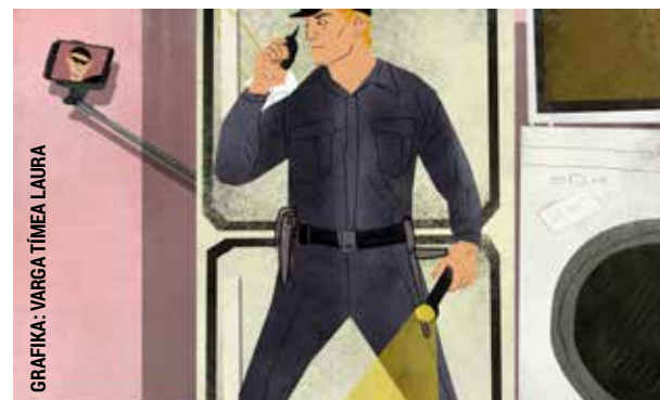
GRAFIKA: VARGA TÍMEA LAURA

Az egyik kerületi műszaki áruházban nagy értékű fényképezőgépet akart ellopni az egyik vevő. A férfi a kiválasztott gépet a kosarába tette, majd az egyik hűtőszekrény mögé bújva csípőfogóval levágta a masináról a lopásgátlót, és a készüléket a táskájába rakta. Sze-