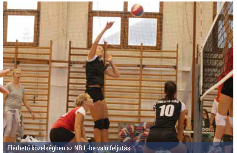
Elérhető közelségben az NB I.-be való feljutás