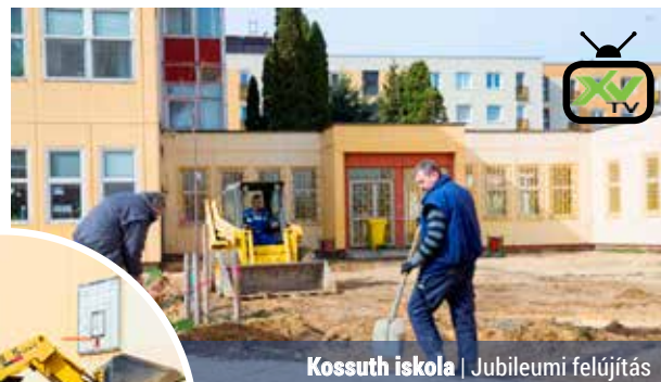
Kossuth iskola | Jubileumi felújítás