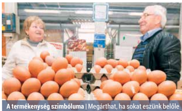
A termékenység szimbóluma | Megárthat, ha sokat eszünk belőle

Egyre gyakoribb a tojásallergia, hazánkban a lakosság 1 százaléka allergiás a tyúktojás valamely összetevőjére – olvasható a webbeteg honlapján. A diagnózist legtöbbször már gyermekkorban állapítja meg az orvos, hiszen az első tünetek akkor válnak nyilvánvalóvá, mikor a hozzátáplálás elkezdődik.