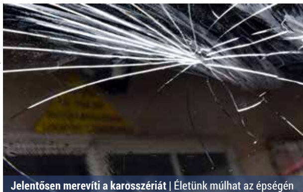
Jelentősen merevíti a karosszériát | Életünk múlhat az épségén

Már egy kicsi kavicsfelverődés is sérülést okozhat a szélvédőn, amely később bármikor berepedhet. De nem csak ezért érdemes minél hamarabb kijavíttatni a hibát. Az elmúlt két évtizedben a szélvédők szerepe jelentősen megváltozott. Azon felül, hogy a menetszél-től és a csapadéktól megvédi a jármű utasait, ma már aktív és passzív biztonsági szempontból is sokkal nagyobb jelentőséggel bír.