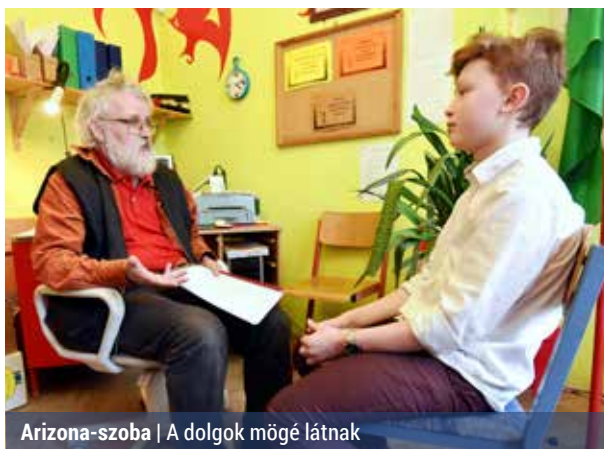
Arizona-szoba | A dolgok mögé látnak

Az Arizona-programot 1994-ben egy phoenixi iskolában vezették be. A foglalkozásokon a diákok megtanulják, hogy a cselekedeteiknek következményük van, s a döntéséért mindenki maga felel. Megértik azt is, hogy a tanár és a diák csak a kölcsönös tiszteltettség alapján működhet együtt, továbbá az alapvető jogok, illetve kötelezettségek mindkét félre vonatkoznak.