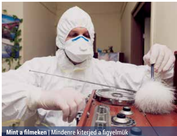
Mint a filmekben | Mindenre kiterjed a figyelmük