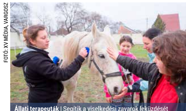
Állati terapeuták | Segítik a viselkedési zavarok leküzdését

Nem mindennapi lehetőséghez jutottak a Rákospalotai Javítóintézet és Speciális Gyermekotthon lakói. Az EMMI Gyermekvédelmi Főosztályának pályázatán nyertek támogatást, és így hente egyszer lovakat hoznak a Pozsony utcai intézménybe. Az állatokkal nemcsak barátkozhatnak, hanem a támogatásnak köszönhetően alapszinten még lovagolni is megtanulhatnak az otthonban élők.