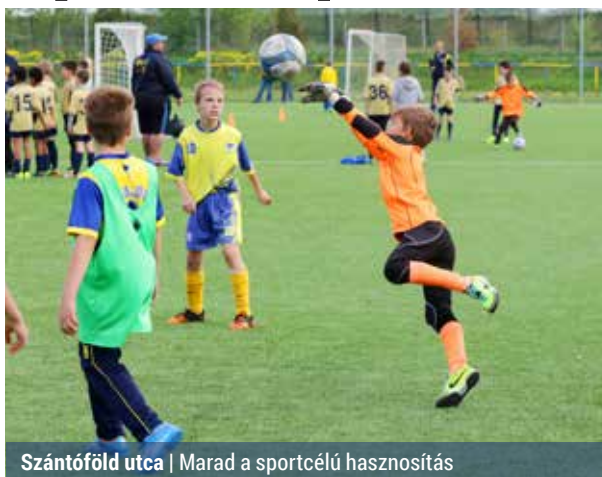
Szántó föld utca | Marad a sportcélú hasznosítás

Az Életképek 3. számában Új hely a tábornak? címmel cikket közöltünk arról, hogy a képviselő-testület a február 2-i ülésén polgármesterről hatáskörbe utalta a nyári napközis tábor helyszínének kijelölését. Ennek kapcsán Hajdu László polgármester említette, hogy a Szántó föld utcai sporttelep iránt érdeklődik egy beruházó, aki megvenné a telepet.