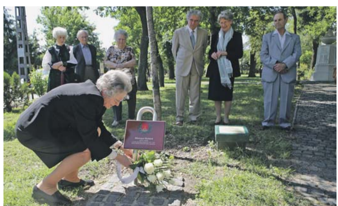
Az emlékezés virágai

RÁKOSPALOTA • PESTÚJHELY • ÚJPALOTA A XV. kerület polgárainak kétheti, ingyenes lapja. Kiadja az XV. Média Kommunikációs és Szolgáltató Közhasznú Nonprofit Kft. Az újság szerkesztéséért felelős: Metz Edina Szerkesztőség: 1153 Budapest, Eötvös u. 1. Tel.: 720-5456, Tel./Fax: 720-5457 • info@xvmedia.hu • xvmedia.hu ISSN 2062-6770 (Nyomtatott) • ISSN 2063-6555 (Online) Nyomtatás: Lapcom Lapkiadó és Nyomdaipari Kft., 9021 Győr, Újlak u. 4/a.