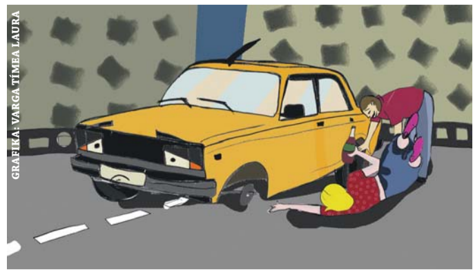
GRAFIKA: VARGA TÍMEA LAURA

A rendőrök előállították őket a kerületi kapitányságon, ahol mindkettőjüktől vér- és vizeletmintát vettek. Ezek eredményeit szakértők vizsgálják, és ez határozza meg a további intézkedést.