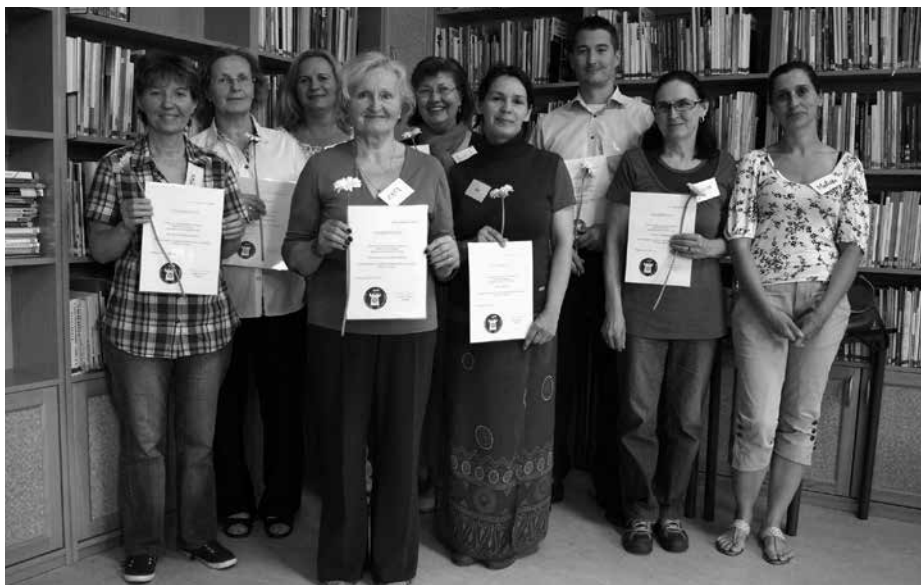
FORRÁS: OTTHON SEGÍTÜNK ALAPÍTVÁNY

Cél, hogy a kisgyermekeket nevelő édesanyák örömként éljék meg a szülővé válás időszakát, ne érezzék magukat elszakadva a külső kapcsolataiktól, és hogy a gyerekek körüli teendők ne váljanak mindennapos taposómalommá. A szülők által felkért szolgálati önkéntesek heti egy alkalommal, két-három órás időkereten belül, megegyezés szerint besegítenek a háztartásba, mesélnek a gyerekeknek, játszanak és foglalkoznak velük. Ez idő alatt a szülő gyorsabban tud végezni a felügyelettel tennivalóval,