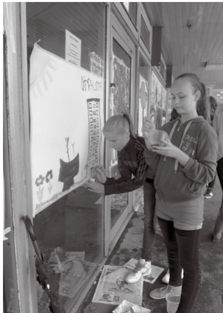
FOTÓK: XV MÉDIA, NAGY BOTOND ÉS VARGOSZ