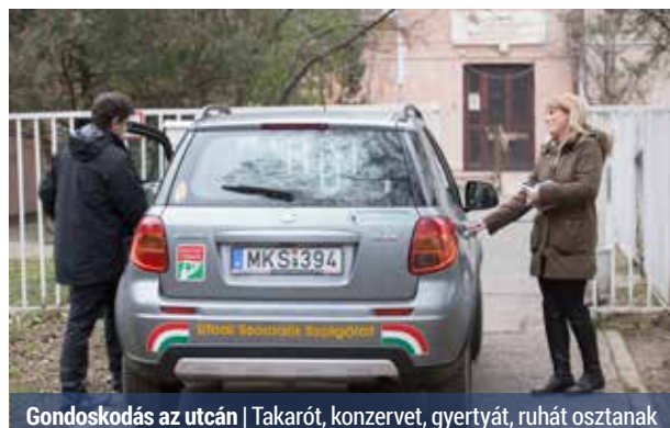
Gondoskodás az utcán | Takarót, konzervet, gyertyát, ruhát osztanak