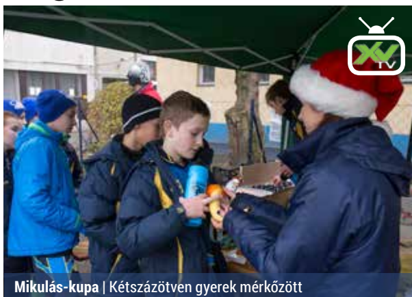
Mikulás-kupa | Kétszázötven gyerek mérkőzött