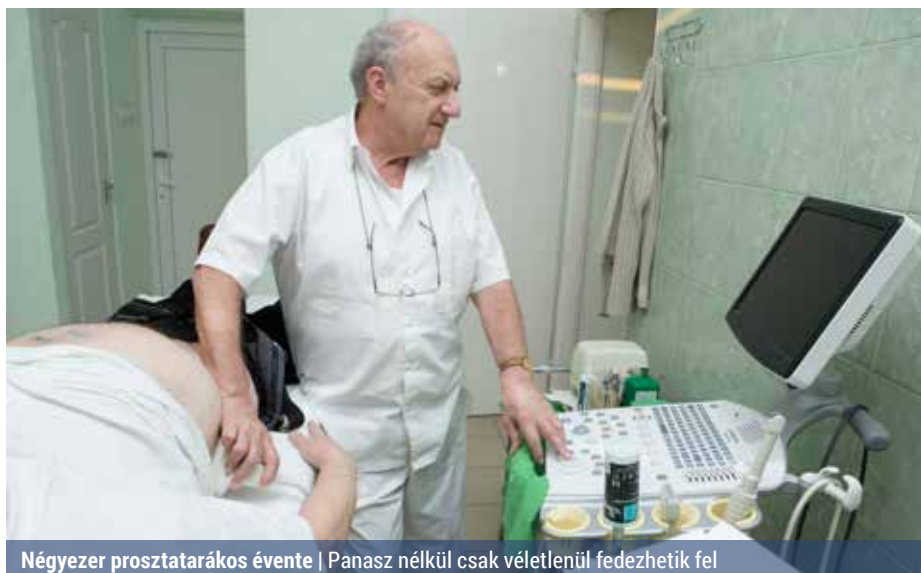
Négyezer prosztatarákos évente | Panasz nélkül csak véletlenül fedezhetik fel