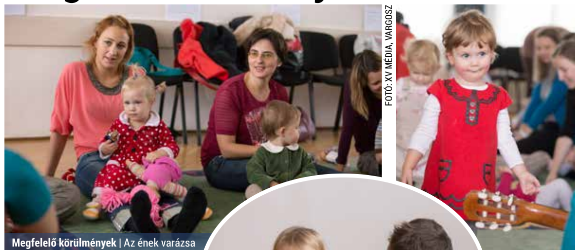
Megfelelő körülmények | Az ének varázsa