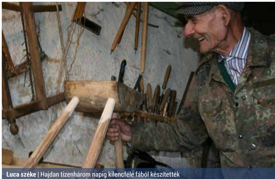
Luca széke | Hajdan tizenhárom napig kilencféle fából készítették

Szent Luca a legenda szerint a szembetegségben, vakságban szenvedők, a bűnbánó utcanők és a varrónők patrónusa. A Gergely-féle naptárreform előtt december 13-a az esztendő legrövidebb, egyúttal a téli napforduló kezdőnapja volt, mely tele volt tilalmakkal, jóslásokkal. A magyar néphitben Luca alakja kettős, egyrészt kapcsolatos a legendabeli Szent Lucával, másrészt egy boszorkányszerű, rontó nőalakkal is.