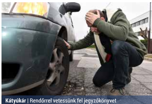
Kátyúkár | Rendőrrel vetessünk fel jegyzőkönyvet

A hogy a tél beköszöntével szaporodnak a kátyúk az utakon, egyre gyakrabban fordul elő, hogy az útról felverődő kavicsok szélvédőkárt okoznak. Ez különösen hidegben jelent problémát, hiszen a hőmérséklet-különbség okozta anyagfeszültség miatt az üveg a pontszerű sérülés helyett akár végig is repedhet