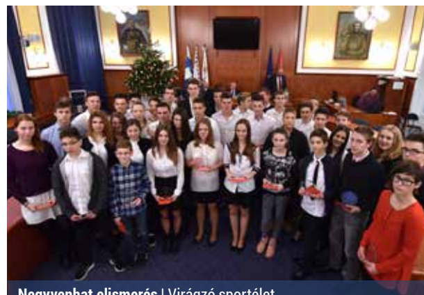
Negyvenhat elismerés | Virágzó sportélet