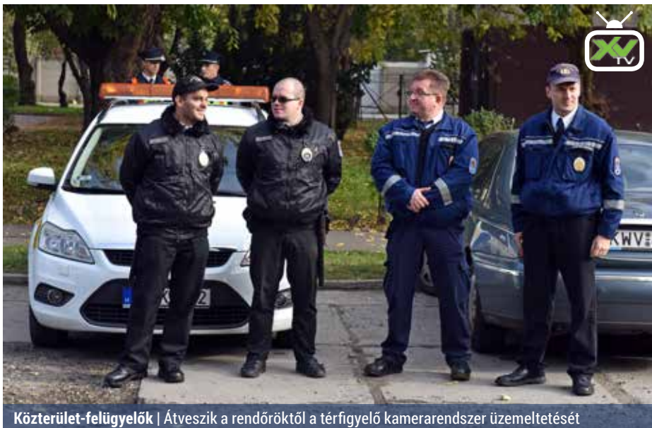
Közterület-felügyelők | Átveszik a rendőroktól a térfelügyelő kamerarendszer üzemeltetését

Az idei év utolsó ülésére gyűlt össze a képviselő-testület december 1-jén. Többek között rendeltetési módokról, kerületi szabályozási tervekről, az Újpalota–Astoria közötti gyorsvillamos kiépítésével kapcsolatos álláspont kialakításáról, a térfelügyelő rendszer további működtetéséről, a Szentmihályi úti szánkózódombnál létesítendő zebra-ról döntöttek a képviselők.