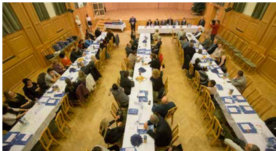
Jutalom a sportszakembereknek | Távlatok a testnevelésben

Tizenhetedik alkalommal köszöntötte a kerület sportvezetőit, edzőit és testnevelőit az önkormányzat. A december 8-i ünnepségen a hagyományos elismerések mellett egy rendhagyó díjátadásra is sor került.