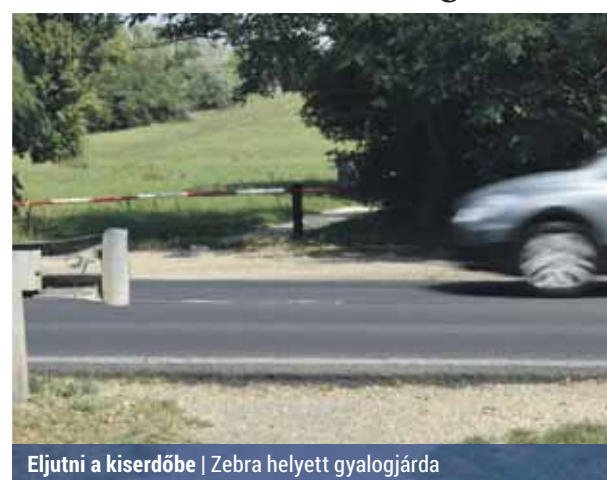
Eljutni a kiserdőbe | Zebra helyett gyalogjárda

A társaság ugyanakkor arról is tájékoztattott, hogy a forgalomszámlálási adatok alapján nem tartják indokoltnak a Kórkás parkot a szánkózódombbal összekötő zebra megépítését, és erre jelenleg forrást sem tudnak biztosítani. Megoldásként azt javasolják, hogy az ön-