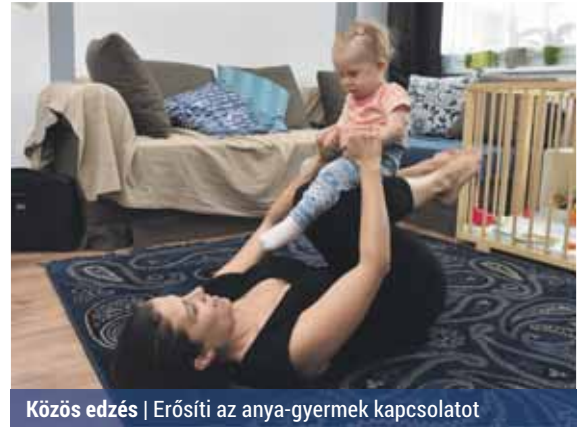
Közös edzés | Erősíti az anya-gyermek kapcsolatot

Pár hónapos kisbaba mellett az anyáknak általában nem sok idejük marad magukra. Ugyanakkor a terhesség alatt rájuk rakódott pluszkilók és a bezártság miatt egyre nagyobb az igényük a mozgásra. Erre jelenthet jó megoldást a babával való közös torna, amely anyának és gyermekének egyaránt hasznos.