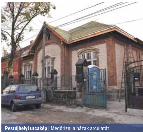
Pestújhelyi utcakép | Megőrizni a házak arculatát

A módosítás lehetővé teszi meghatározott feltételekkel a védett utcaszakaszok és településrészek esetén az eredeti nyílászáró osztáshoz illeszkedő műanyag nyílászárók alkal-