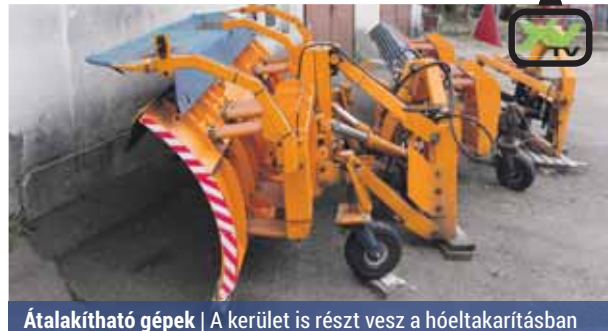
Átalakítható gépek | A kerület is részt vesz a hóeltakarításban