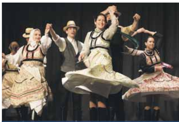
Szilás | Fontos a szerepük a palotai hagyományörzésben

November harmadik hete a magyar népdal és népköltészet hete, kedvenc gyermekkori népmeséink, népdalaink ünnepe. Országszerte több iskolában és művelődési házban szerveznek az eseménnyel kapcsolatos programokat: népdaléneklő, népmeseszavaló, meseillusztráló, valamint rajzversenyeket tartanak. A magyar népdalkincs néhány zenetudósnak köszönhetően nem merült feledésbe. A XIX. század első gyűjtői után a XX. század két nagy zeneszerző-tudósa, Kodály Zoltán és Bartók Béla kezdték a tudományos célú népzenekeletést. Bejárták az egész országot, lejegyezték a népd-