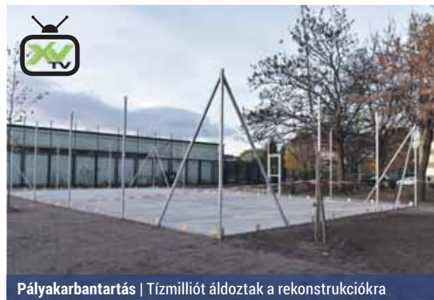
Pályakarbantartás | Tízmilliót áldoztak a rekonstrukcióra

Két kerületi „dühöngőt” újított fel a napokban a Répszolg. Az egyik sportpálya a Páskomligeti utca – Bánkút utca – Gazdálkodó út által közrefogott területen található. A régi, pici dühöngő helyén egy 10×17,5 méteres műfüves, elasztikus hálószerű pályát építettek. A műfüv lábtérfelületet kapott, így kiskapus focipályaként használhatják a környékbeliek.