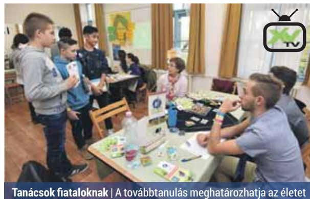
Tanácsok fiataloknak | A továbbtanulás meghatározhatja az életet

A továbbtanulás napjainkban központi kérdés. A Munkanélküli Fiatalok Tanácsadó Irodája (MUFTI) fontosnak tartja, hogy a pályaválasztás előtt álló diákok megfelelő döntést hozzanak, hiszen lényeges, hogy a munkaerő-piaci igényeknek megfelelő tudással és végzettséggel rendelkezzenek. Ehhez elengedhetetlen, hogy ismerjék a továbbtanulás, a szakmatanulás széles körű lehetőségeit.