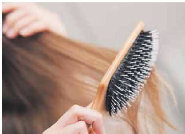
Hajhullás | Gyulladás is állhat a jelenség hátterében

A hajunk folyamatosan megújul, így a hajhullás bármennyire is furcsa, normális jelenség. Sőt ősze és tavaszszal, valamint szülés után látványosabb hajhullást is tapasztalhatunk. Napi 100 elvesztett hajszál azonban még nem ad okot aggodalomra. Probléma akkor jelentkezik, ha az elvesztett hajszálak helyén nem nő újabb, így a hajkorona folyamatosan csökkenését észleljük.