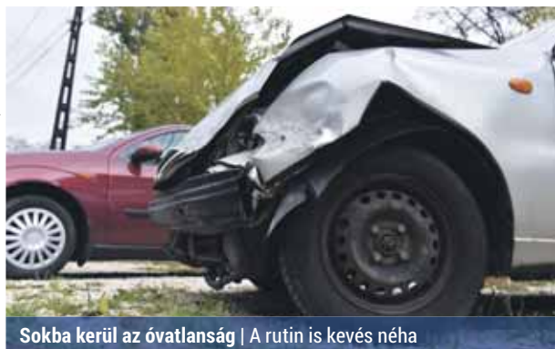
Sokba kerül az óvatlanság | A rutin is kevés néha

– Bár a lefagyott úton történő vezetéskor a reflexeinkre is szükség lehet, a baleset elkerülése nem elsősorban a gyorsaságon múlik, hanem a vészhelyzetek tudatos elkerülésén. Éppen ezért a téli útvisszonyok mellett az egyik legfontosabb teendő a megfelelő követési távolság betartása. Az általában ajánlott 2-3 másodpercet ilyenkor kötelező tartani, nagyon síkos úton pedig ennél többre is szükség van a megálláshoz – hívja fel a figyelmet a szakember.