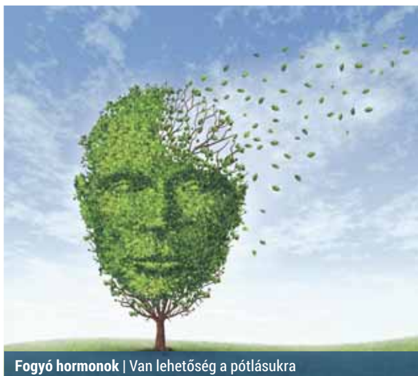
Fogyó hormonok | Van lehetőség a pótlásukra

Sokszor beszélnek a női klimaxról, annak tüneteiről, azonban arról kevesebb szó esik, hogy az 50. életkor körül a férfiakban is hormonhiány alakul ki, vagyis a tesztoszteron, a férfi nemi hormon mennyisége drasztikusan csökken. Ez a változás természetesen koronáját testileg-lelkiileg felforgatja. A hormonszint csökkenésének nemcsak a nemi életre van hatása, hanem a közérzetre és a pszichés működésekre is.