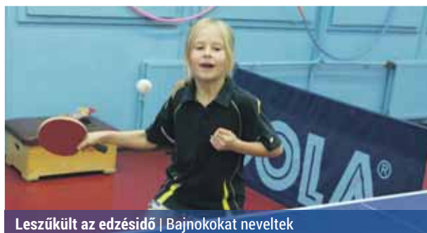
Leszűkül az edzésidő | Bajnokokat neveltek

Mostanában gyakran zene hangjai szűrődnek ki a Kontyfa Sportiskola edzéseiről. Januártól ugyanis a gyerekek nemcsak asztaliteniszezni, hanem táncolni is tanulhatnak.