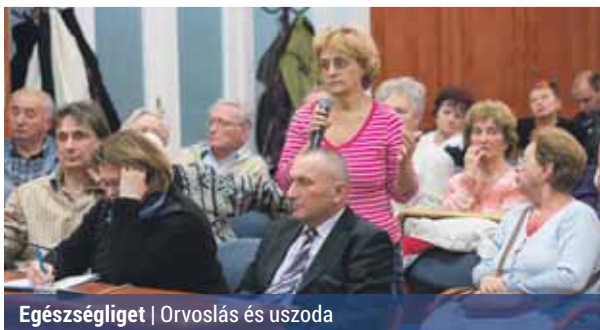
Egészségügy | Orvoslás és uszoda

Ugyancsak nagy vitát kavart az ingatlan területére tervezett kínai gyógyászati központ is, amely sokak szerint indokolatlan fejlesztés, helyette inkább a hazai gyógyítási módszereket szeretnék. Ilyen hazai egészségügyi intézményeket azonban felvázoltak a tervekben is. A közmeghallgatáson felmerült a vesebetegek számára kialakít-