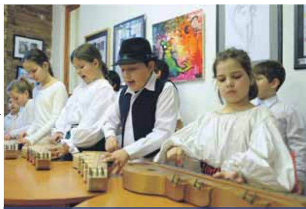
Népdal és -költészet hete | Kedvenc meséink, dalaink ünnepe

lok szövegét, dallamát, majd gyűjtéseiket rendszerezték: típusokba sorolták témáik, dallamuk, formájuk szerint.