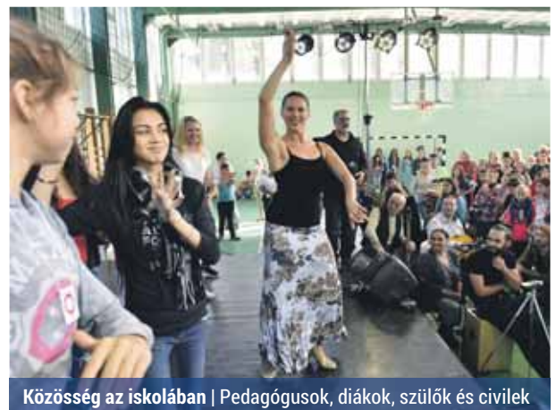
Közösség az iskolában | Pedagógusok, diákok, szülők és civilek